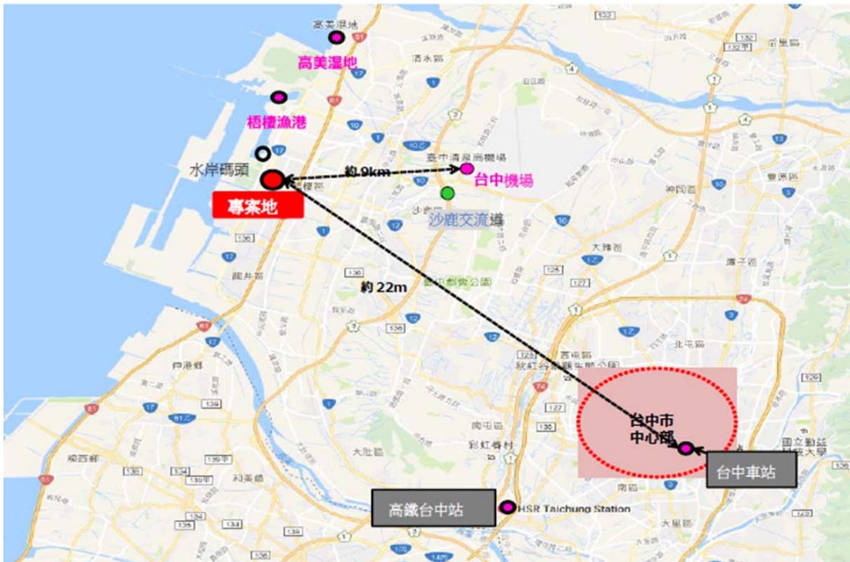
圖 2、交通相對位置圖