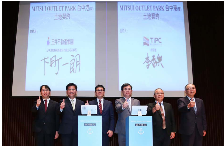
圖6、三井大型購物中心土地簽約儀式