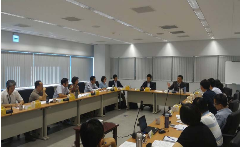
圖 5、跨局處協調會議