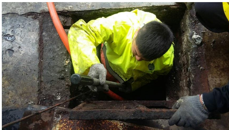
圖 3 道路側溝疏通作業