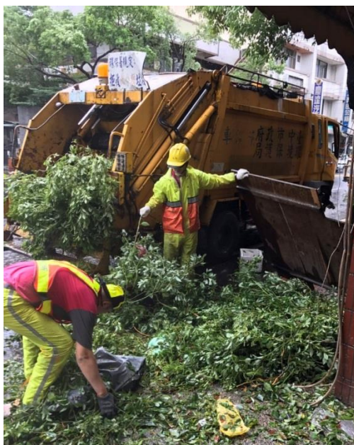
圖 4 風災時道路清理作業