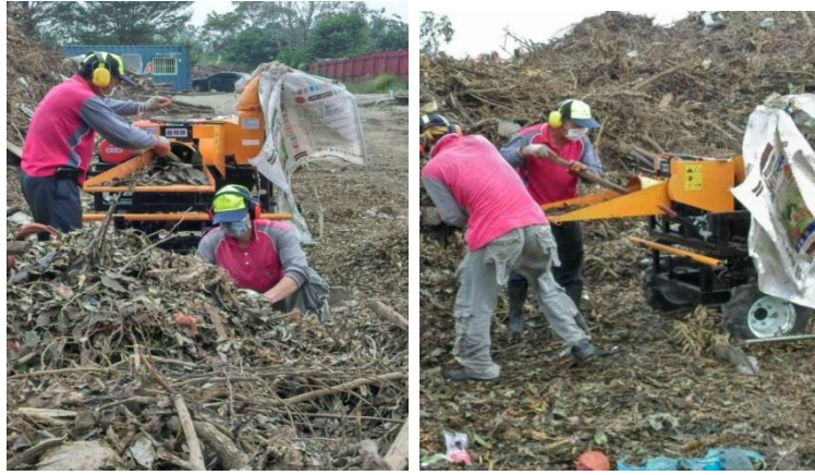
圖 1 廢樹枝破碎圖

(四)廚餘堆肥等作業：106 年 1 月至 8 月止，廚餘堆肥量計 2,826 公噸，相較於 104 年同期 2,678 公噸，增加 148 公噸。