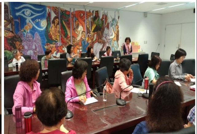
新市政服務中心志工隊隊長致歡迎詞