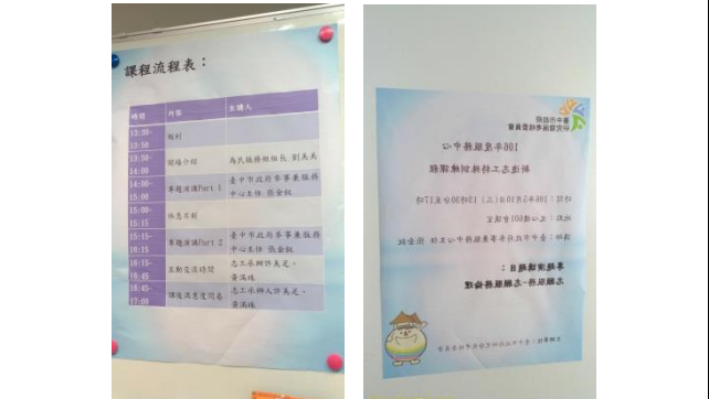
今日主題~志願服務倫理