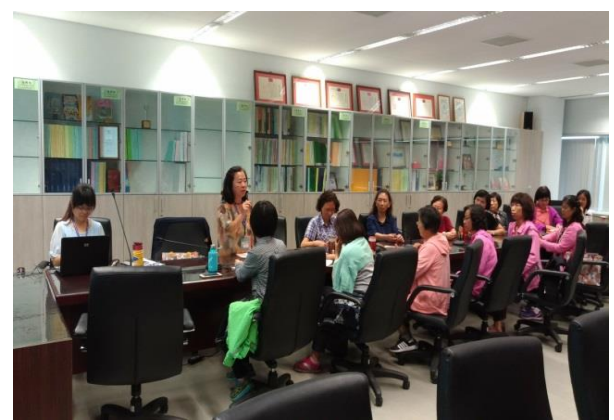
陽明服務中心志工承辦人致詞