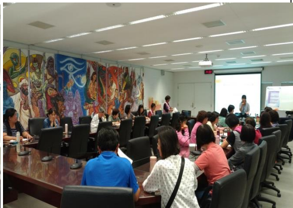
志工與承辦雙方意見交流