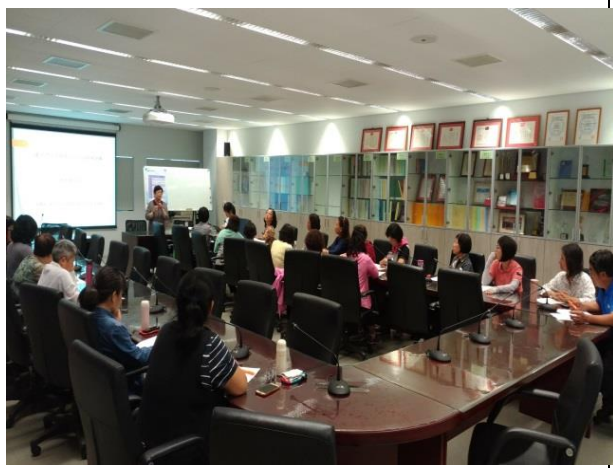
學員認真聆聽講習