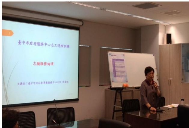
本府參事(兼服務中心主任)擔任講師