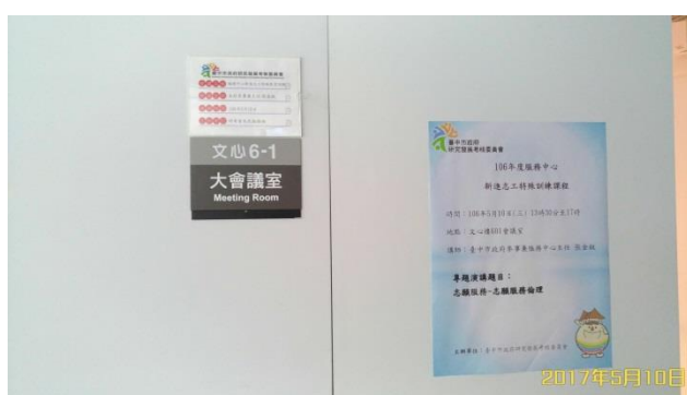
在溫馨的大會議室舉辦志工研習