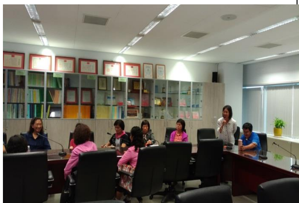
參與研習志工心得分享