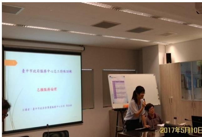
新市政服務中心志工承辦人致詞