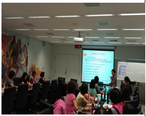
本府研考會參事詳實並仔細的說明志工法