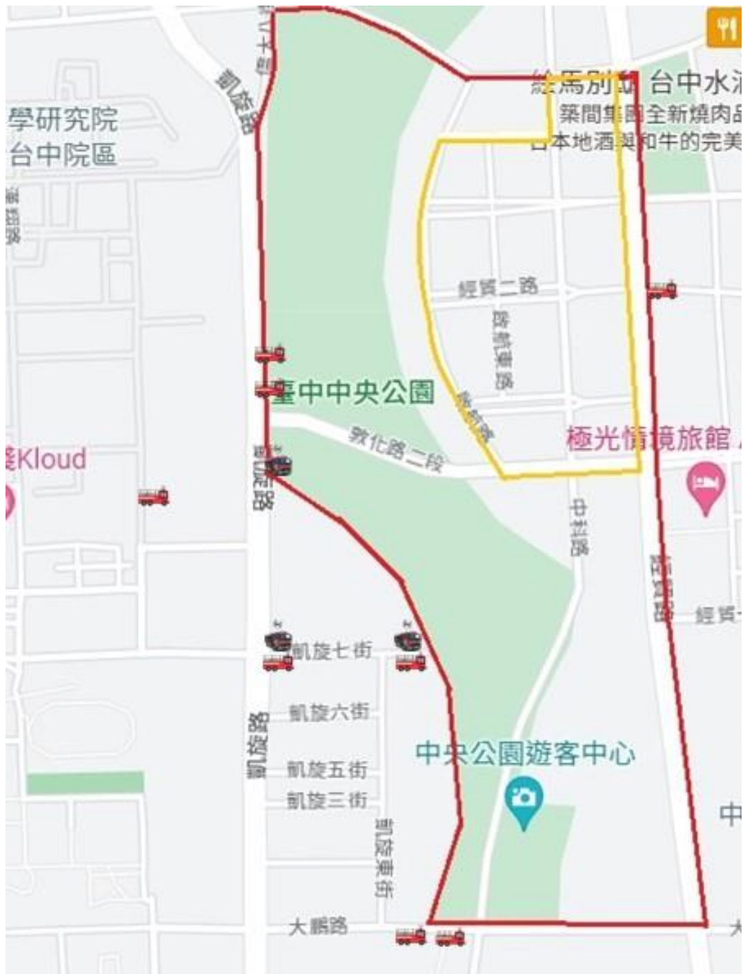
▲10月9日、10月10日國慶焰火活動消防車輛佈署圖