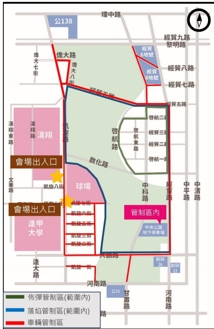
圖 4-4 「112 國慶焰火在臺中」交通管制規劃示意圖

佈彈管制區主要為佈設焰火彈藥位置，包含部分啟航路、啟航東路、中科路、啟航二路等路段，嚴禁人車進入，確保民眾安全；作業管制區則考量焰火施放期間落焰可能掉落之區域，禁止人車進入，包含部分中科路及敦化路等路段，避免落焰危險；車輛管制區禁止一般車輛通行，僅供提供接駁車及行人進入，包含凱旋七街、僑大八街及經貿五路等路段。活動期間警察局亦將視現場車流狀況彈性調整管制作為。交通管制規劃如圖 4-4 所示。