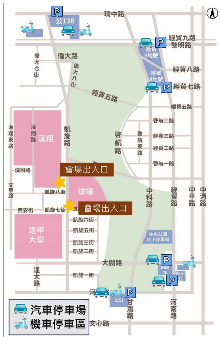
圖 4-3 「112 國慶焰火在臺中」會場周邊停車場位置示意圖

計汽車可提供約 11,800 格。而機車停車場則考量民眾會停放在最靠近會場的特性，於距會場不遠處規劃有臨時停車區，北側將以不影響周邊住戶為原則，封閉部分人車流較少之區域作為臨時停車區，約可容納 5,000 輛機車；南側則規劃有創研 21 及公 51 停車場，約可容納約 4,500 輛機車，共計機車可提供近 1 萬席。會場周邊停車場位置如圖 4-3 所示。