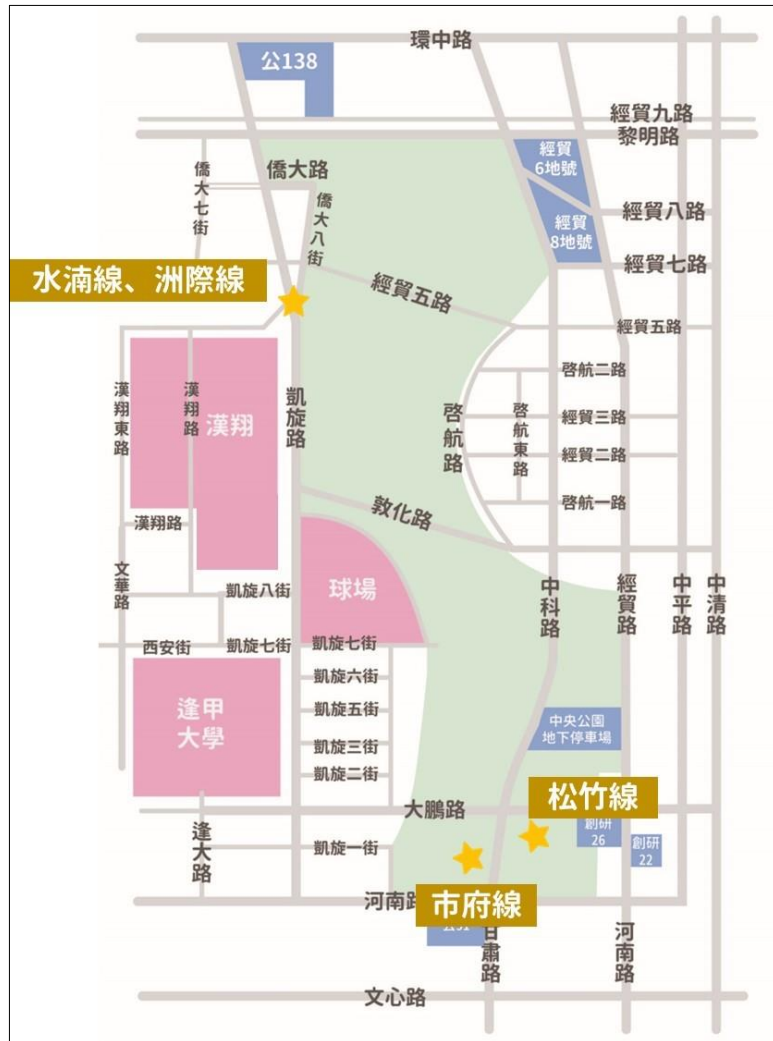
圖 4-2 會場周邊接駁點位規劃示意圖

外，另外準備至少 50 輛接駁車待命，活動期間將全力疏運民眾，減少民眾候車時間。會場周邊接駁點位規劃示意圖如圖 4-2。