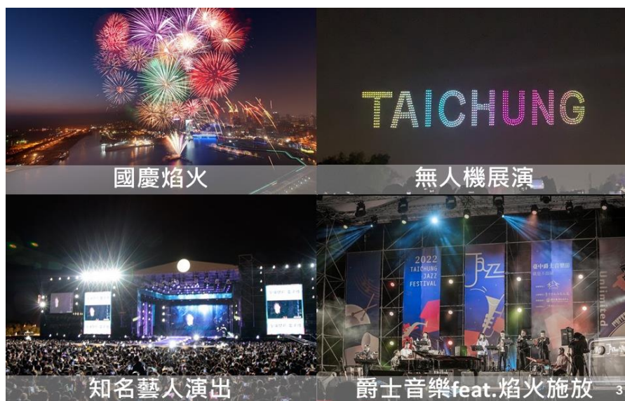
圖 3-3 「112 國慶焰火在臺中」活動節目設計四大亮點

（四）爵士音樂表演：聘請國內指標性的爵士樂團登台演出，並創全國之先，現場演奏爵士風格的焰火配樂，強化「爵士樂之都在臺中」的城市意象。