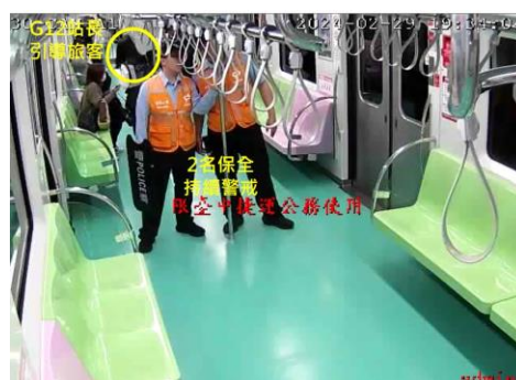
圖 9、隔離行為異常旅客