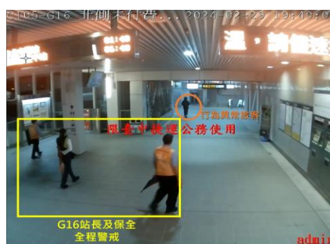
圖 11、異常旅客於烏日站下車