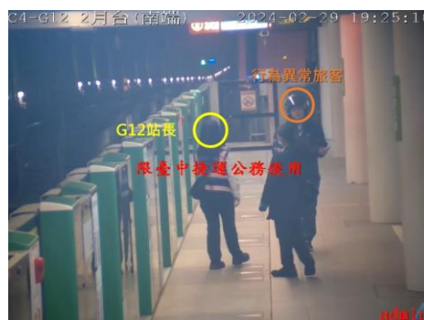
圖6、站長現場警戒與溝通

19:26 行控中心觀察該旅客於月台期間未有明顯失序行為，指示豐樂公園站長與保全持防身器具（警盾、齊眉棍）於現場警戒。行控中心完成通報轄區警察（110）。