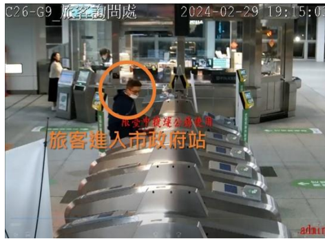
圖 1、旅客進入市政府站

19:15 旅客自市政府站進站時，手提紙袋及安全帽，行為並無異常，於2月台搭乘下行（往高鐵臺中站）車組17（車尾）/18（車頭），坐於17車廂（車尾）。