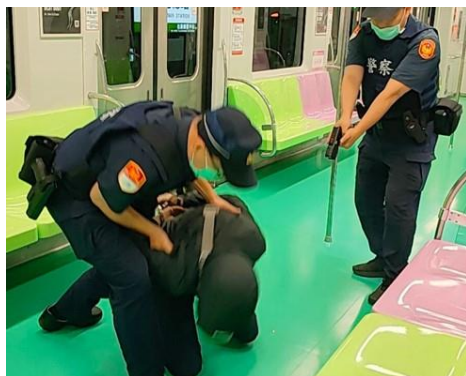
圖 13、111 年列車犯罪演練