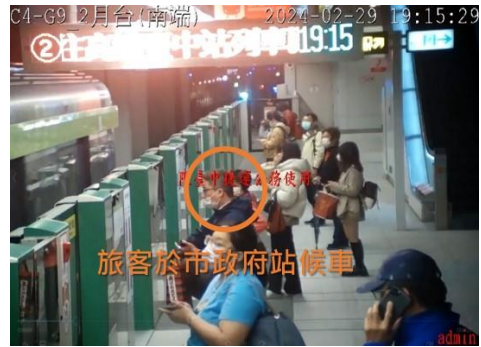
圖 2、旅客於市政府站候車

19:22 南屯站下行（往高鐵臺中站方向）車組17/18隨車人員回報1名行為異常男性旅客於車廂內往18車廂（車頭）移動，疑似持有玩具槍。行控中心設定豐樂公園站2月台暫停，並指示豐樂公園站長前往2月台確認狀況，以及使用車廂及車站閉路電視（CCTV）持續監控該旅客動向。