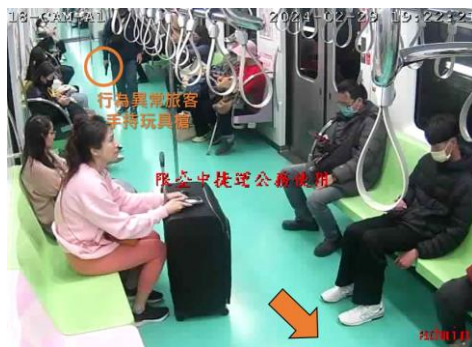
圖 3、旅客持玩具槍於車內走動

19:22 南屯站下行（往高鐵臺中站方向）車組17/18隨車人員回報1名行為異常男性旅客於車廂內往18車廂（車頭）移動，疑似持有玩具槍。行控中心設定豐樂公園站2月台暫停，並指示豐樂公園站長前往2月台確認狀況，以及使用車廂及車站閉路電視（CCTV）持續監控該旅客動向。