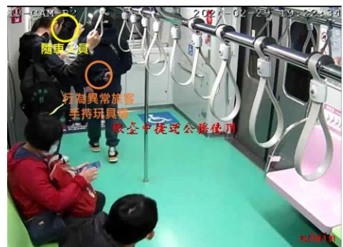
圖 4、旅客靠近隨車人員

19:23 車組17/18停妥豐樂公園站2月台。行控中心通知捷運警察。隨車人員回報該旅客位於17車廂（車尾）。