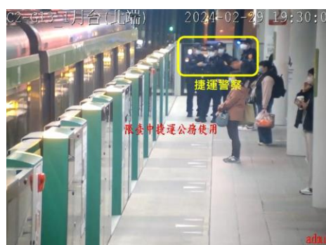
圖8、捷運警察於大慶站候車

19:30 捷運警察於大慶站搭乘上行（往北屯總站）列車前往豐樂公園站。豐樂公園站長回報：該旅客逕自登上2月台進站車組29（車尾）/30（車頭），人員位於30車廂（車頭），並表示搭乘至高鐵臺中站。行控中心指示豐樂公園站長與保全隨車警戒。