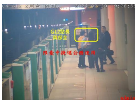
圖 7、站長與保全警戒及溝通