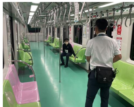
圖 14、112 年旅客異常演練