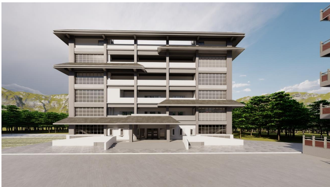
圖五、太平第一花園公墓新建納骨塔模擬圖