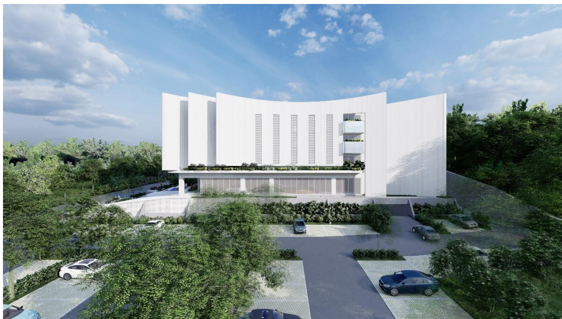
圖六、北屯第 28 公墓新建納骨塔模擬圖