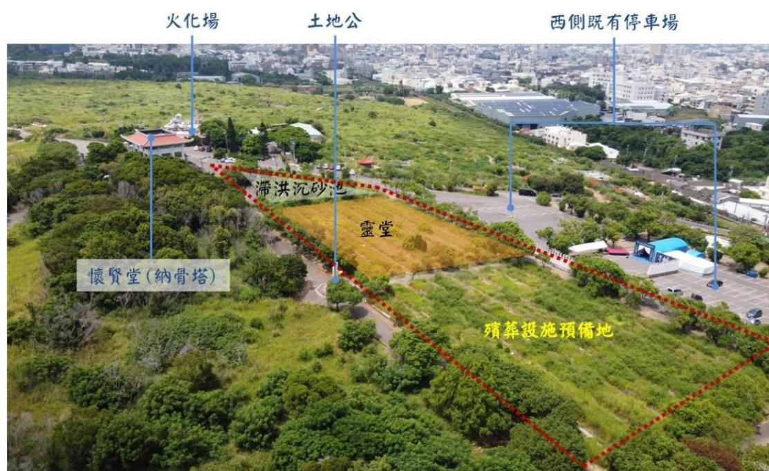
圖一、大甲新建靈堂預定位置

20 間小靈堂規劃於大甲區劍井段 737-6、830 地號及永信段 226 地號等 3 筆土地，計畫面積約 9,893.89 平方公尺，如圖一紅色虛線範圍，並預留未來增設其他殯葬設施之空間。