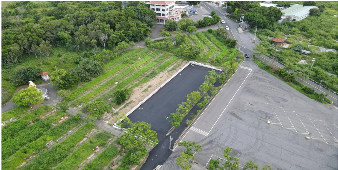
圖二、大甲殯儀館臨時搭棚場地

本局將持續提升大甲殯儀館設施服務效能，並針對既有老舊設施設備更新整修，現階段為因應靈堂不足，已優先設置臨時搭棚場地，提供民眾申請使用，如圖二及圖三，未來 20 間小靈堂完工後，將大幅增加設施量能，期營造更良好舒適的治喪環境。