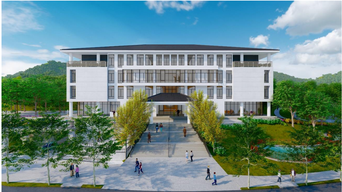
圖四、東勢第一公墓新建納骨塔模擬圖