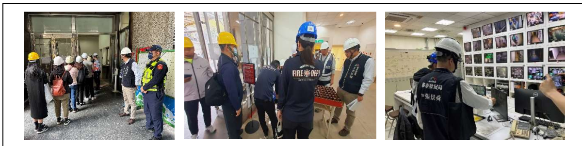
圖. 都發局各管制作業點確認及現場視察，警察、消防人員配合管制