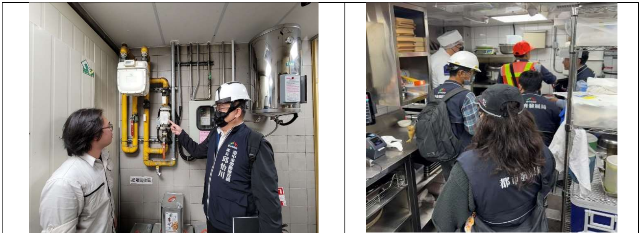
圖6、7配合本府都發局辦理「本市大型百貨公司、商場、量販店聯合稽查」