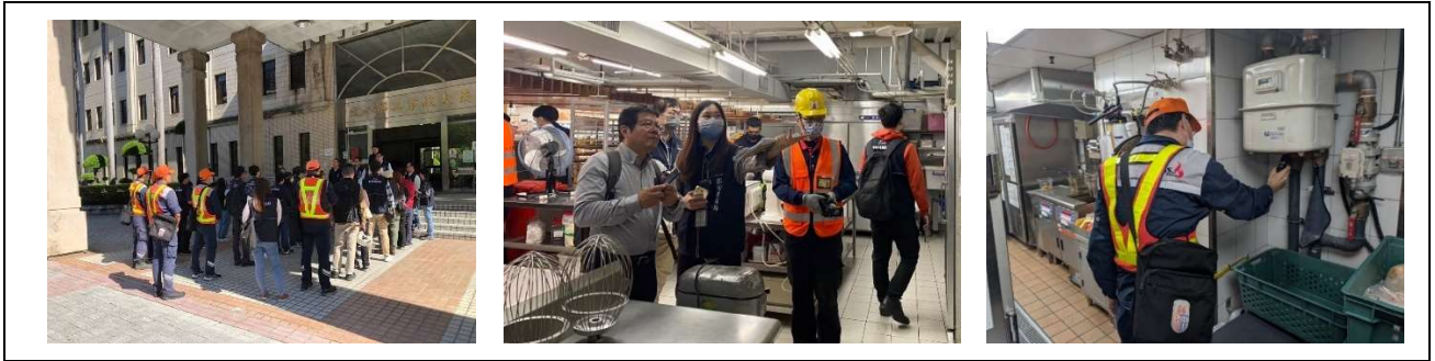
圖. 市府針對本市38家(不含新光三越百貨)大型百貨商場、量販店進行專案聯合稽查7日

家(不含新光三越中港店)，其中計有22家尚符規定，有部分缺失者計16家，因非屬重大缺失，均已依規裁罰並限期改善；惟爾後此類場所若經查有重大缺失項目，將依規裁罰並勒令停止使用。