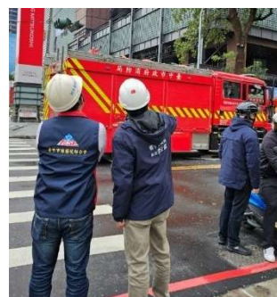
圖. 新光三越百貨氣爆事件後都發局長與專業技師現場討論