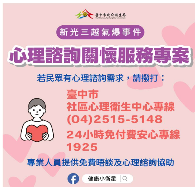
圖一、新光三越氣爆心理諮詢關懷服務專案文宣

事件發生後隨即啟動心理諮詢關懷服務專案(如圖一)，由相關醫院社工及社區心理衛生中心專業人員提供諮詢與支持，協助市民與傷患度過心理創傷。