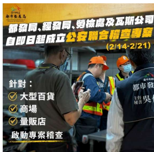
圖. 都發局、經發局、勞檢處及瓦斯公司自即日起成立公安聯合稽查專案

臺中市政府為防範類似事件再發生，於2月14日市長責由都發局(建築空間防火避難設施)、經濟發展局(百貨商場及天然氣事業主管機關)、消防局(消防安全設備)、勞工局(職場環境安全)、天然氣公司(天然氣管線安全)，及專業檢查機構(含建築師)組成跨機關單位之專案聯合稽查小組，針對本市轄內大型百貨商場、量販店等38家(不含新光三越百貨)，進行專案聯合稽查，連續稽查7日。