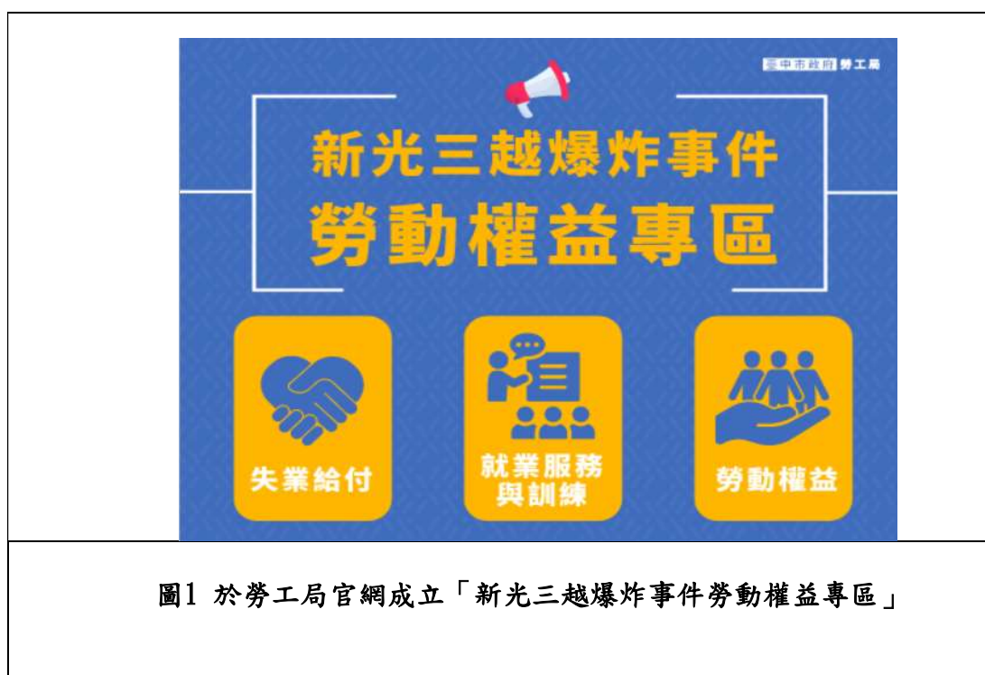
圖1 於勞工局官網成立「新光三越爆炸事件勞動權益專區」

於官網設置「新光三越爆炸事件勞動權益專區」，提供受影響勞工「勞動權益」、「就業服務與訓練」及「失業給付」三大支援，並將相關勞動法令製作成QA放置於專區供勞工查詢，同時發函請市府各機關透過機關跑馬燈宣導相關勞動權益及服務資訊。