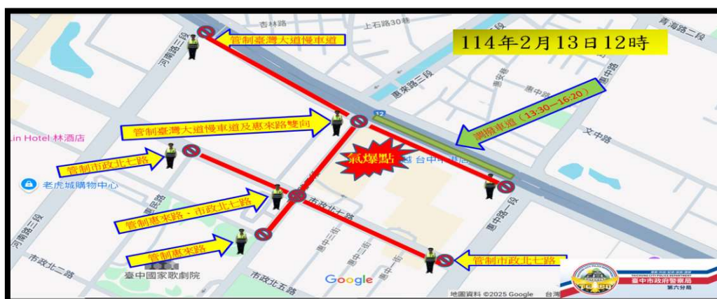
圖. 針對新光三越周邊道路擴大實施交通管制範圍