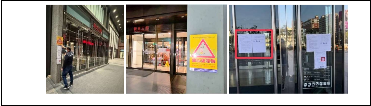
圖 1. 2月13日事故發生後因施工管理不善造成工安事故，依法裁罰並勒令停止使用