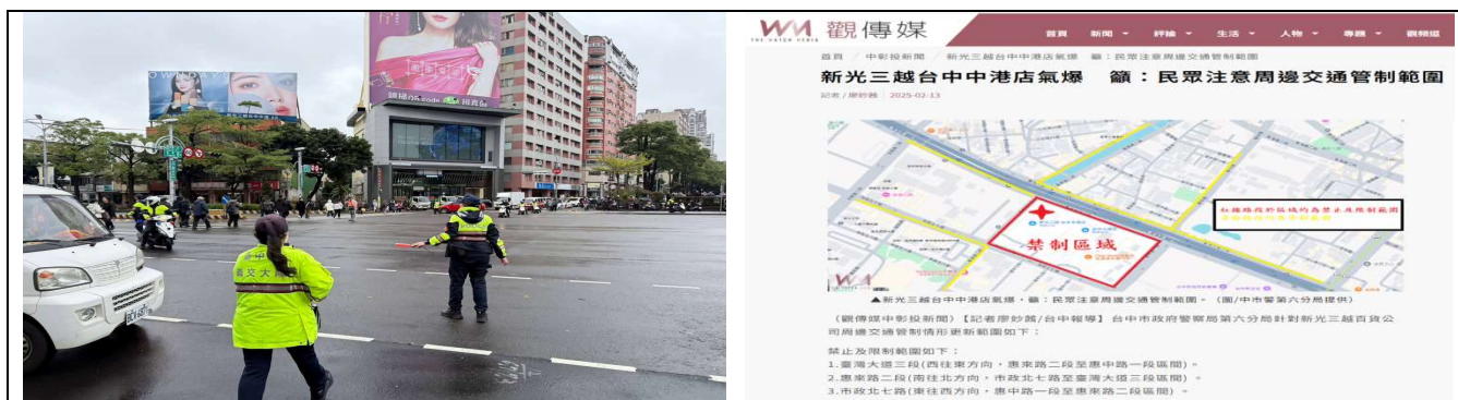
圖. 啟動交通快打執行交通管制疏導並即時發布新聞