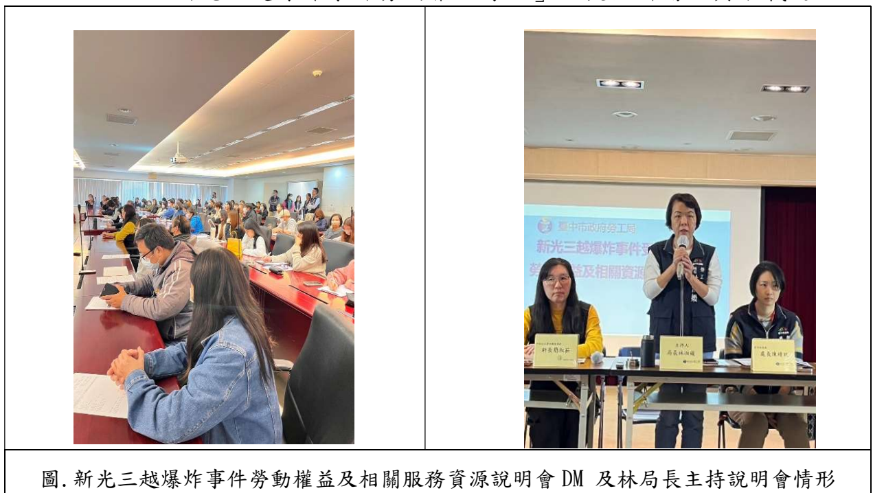
圖. 新光三越爆炸事件勞動權益及相關服務資源說明會 DM 及林局長主持說明會情形

於114年2月20日、2月21日辦理2場次「新光三越爆炸事件受影響勞工勞動權益及相關服務資源說明會」，並於會後將參加者詢問事項彙整放至「新光三越爆炸事件勞動權益專區」，提供所需人員下載運用。