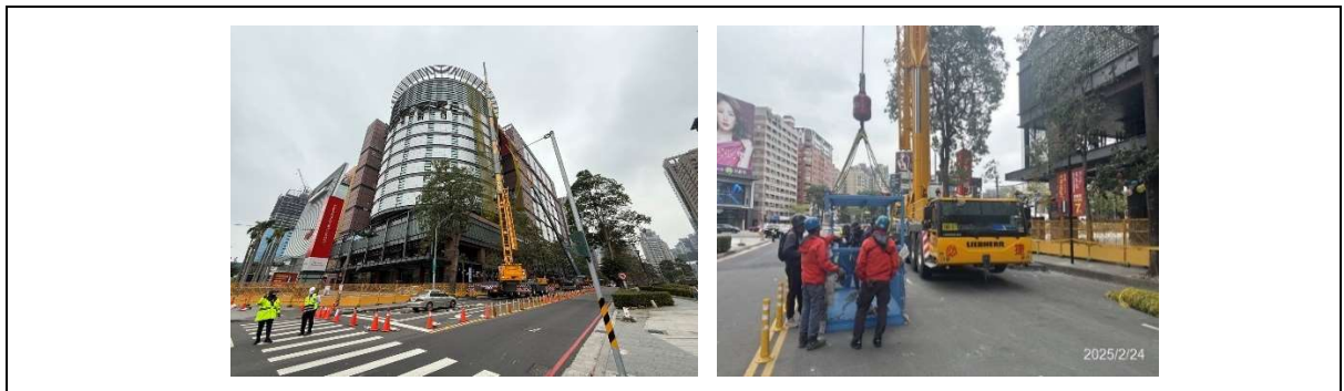
圖. 建築物外牆進行防護網附掛拉撐與固定施工