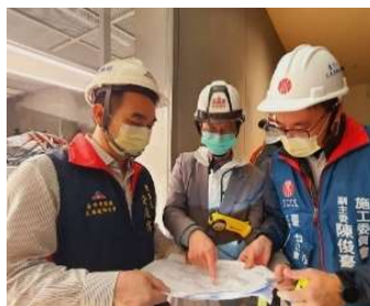
圖. 各勘查公會專業技師討論案情

氣爆工安事故發生後，都發局立即邀集臺中市結構工程技師公會、臺中市土木技師公會及臺中市建築師公會，進入標的物執行勘災任務，確認案發現場之結構安全狀況。