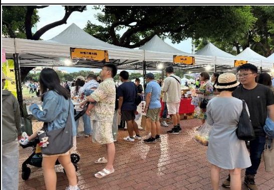
2025 臺灣好咖 x 臺中好餅特色市集鏈結不同產業業者，共同展售