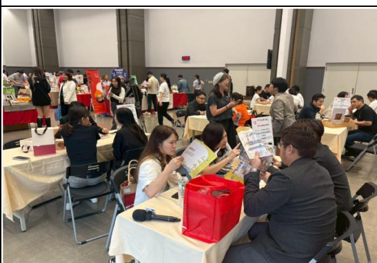
2025 臺中好物媒合推介會吸引線上、線下通路商參與