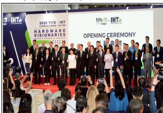
全球五金高峰論壇