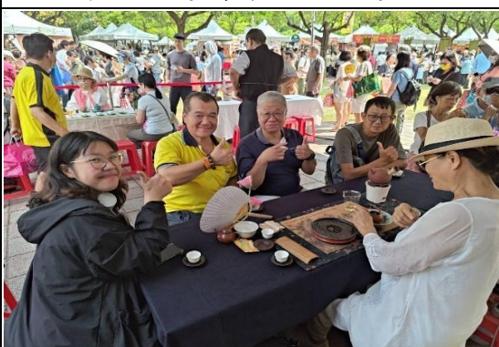
太陽餅文化節結合茶席文化