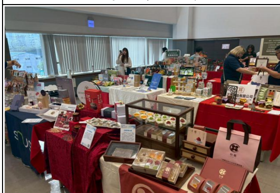
2025 臺中好物媒合推介會約 50 家好禮、糕餅業者參與