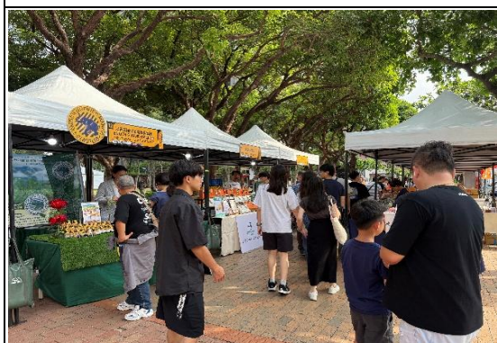
2025 臺灣好咖 x 臺中好餅特色市集於市民廣場盛大登場