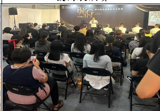
臺中烘焙展：傳統糕餅的未來-烘焙、開心、享受！