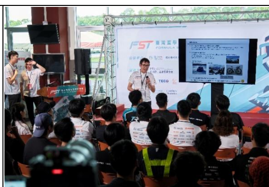
第五屆臺灣盃學生方程式 技術展演賽