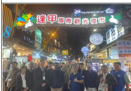
2025 亞洲區域麻醉國際研討會成員，參訪逢甲夜市感受臺灣特有文化體驗