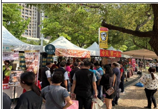
自 2006 年辦理太陽餅文化節至今已邁入第 20 年