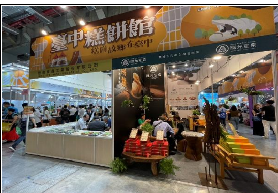
2025 臺北國際食品展設置臺中糕餅館，邀請業者共同參展