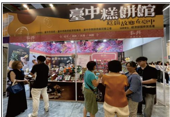
2025 臺北國際食品展設置臺中糕餅館，邀請業者共同參展