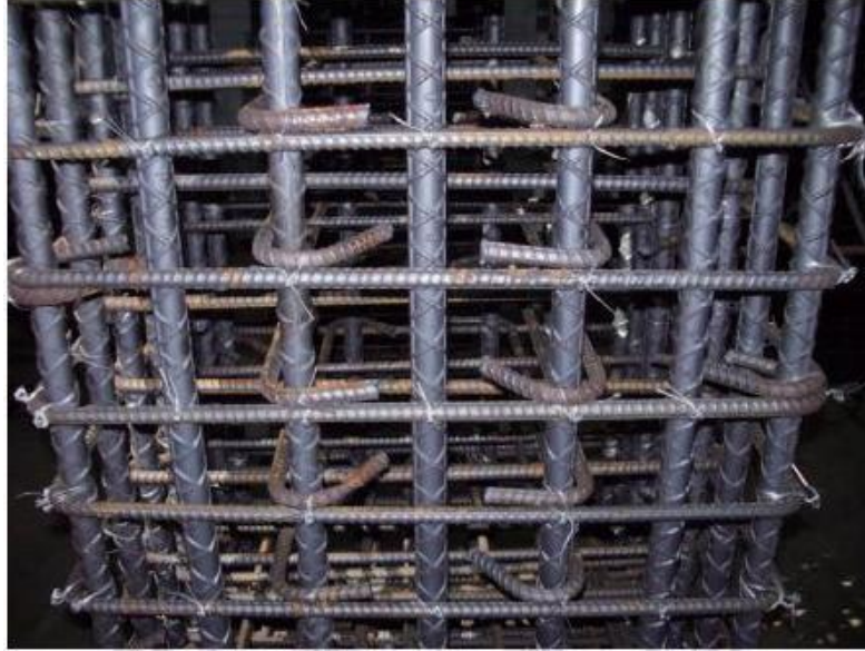
標準圖說及優良施工照片。