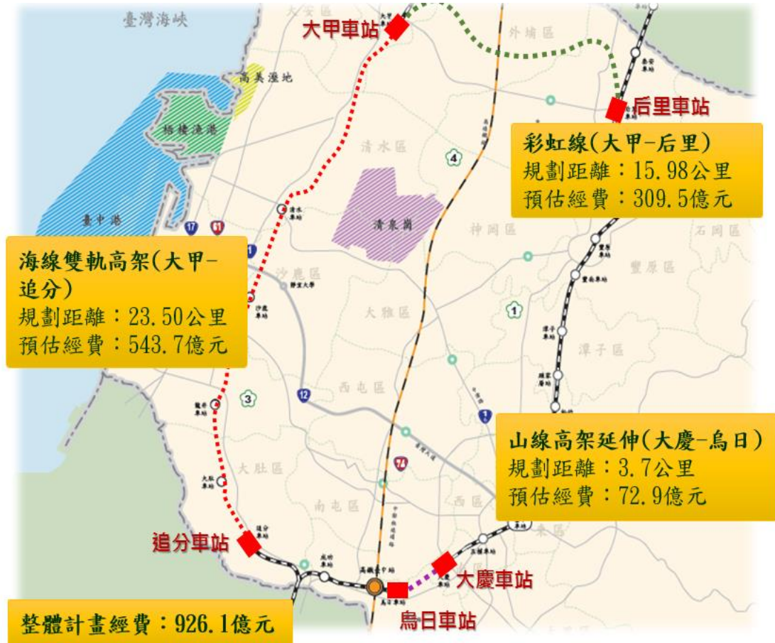
圖 3 山手線整體計畫及路線示意圖

本計畫主要目標以消除平交道與鐵路山、海線造成的長期空間阻隔，強化山海間聯繫、促進都市縫合發展，打造大臺中環狀鐵路，加速山、海、屯間人流及物流串聯，提升交通便利和產業發展。