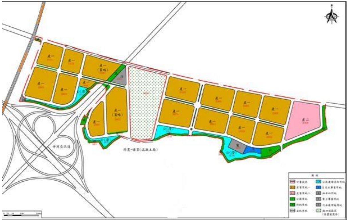
圖 3、土地使用計畫圖(初稿)

高耗水之細業別，另就進駐廠商之用水，並制定使用再生水相關規定，以節約用水，並提升用水效率。本開發案土地使用規劃，如圖 3。另因應中央推動「中台灣智慧機械計畫」推動，及符合二階環評之要求，後續將適度調整引進之產業類別。