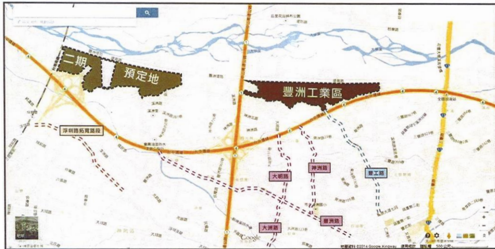
圖 1、豐洲一期與二期位置圖

規劃開發面積為 55.41 公頃，其範圍內皆為公有土地，其中國有土地約 38.7 公頃(占比 69.8%)、市有土地為 16.71 公頃(占比 30.2%)，土地權屬詳見圖 2。