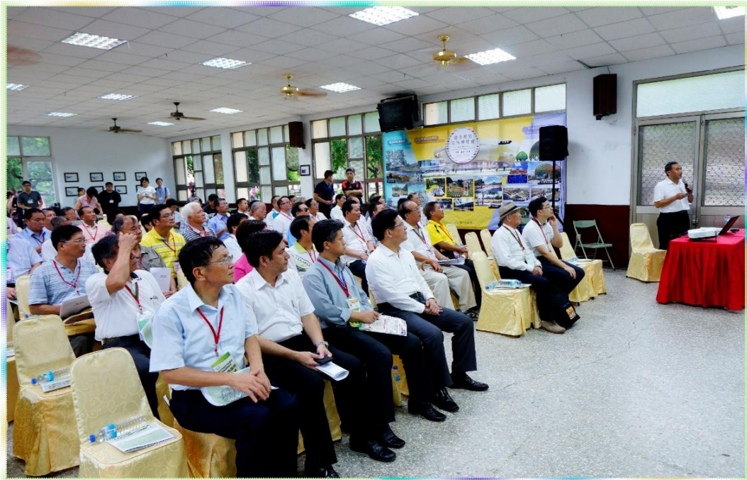
9/3 市政顧問參訪-花博預定地-后里園區花博辦公室簡報照片