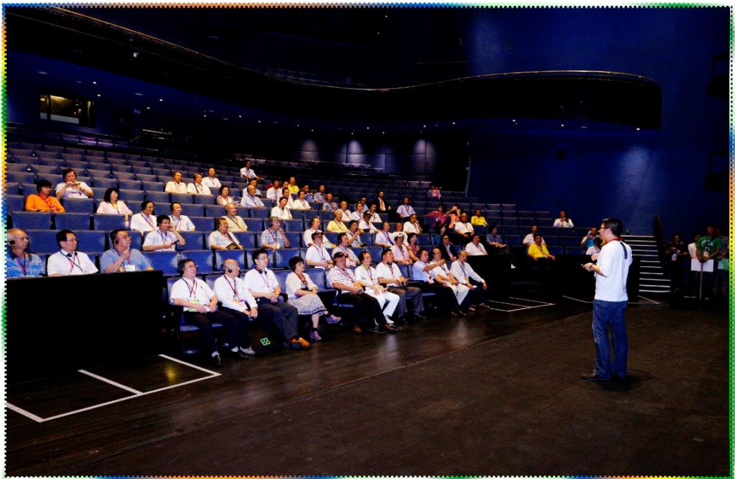
9/3 市政顧問參訪-臺中國家歌劇院 2 樓中劇院導覽照片