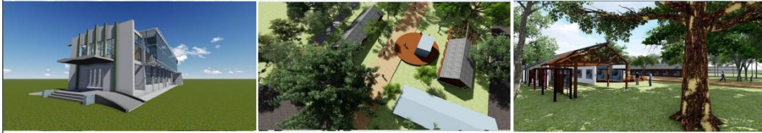
臺中市政府市政顧問105年度市政建設參訪活動 花博預定地-后里馬場森林園區