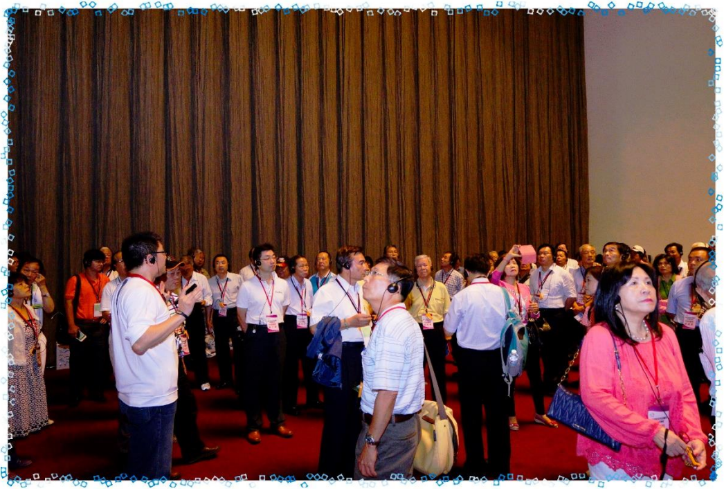
9/3 市政顧問參訪-臺中國家歌劇院 2 樓導覽照片