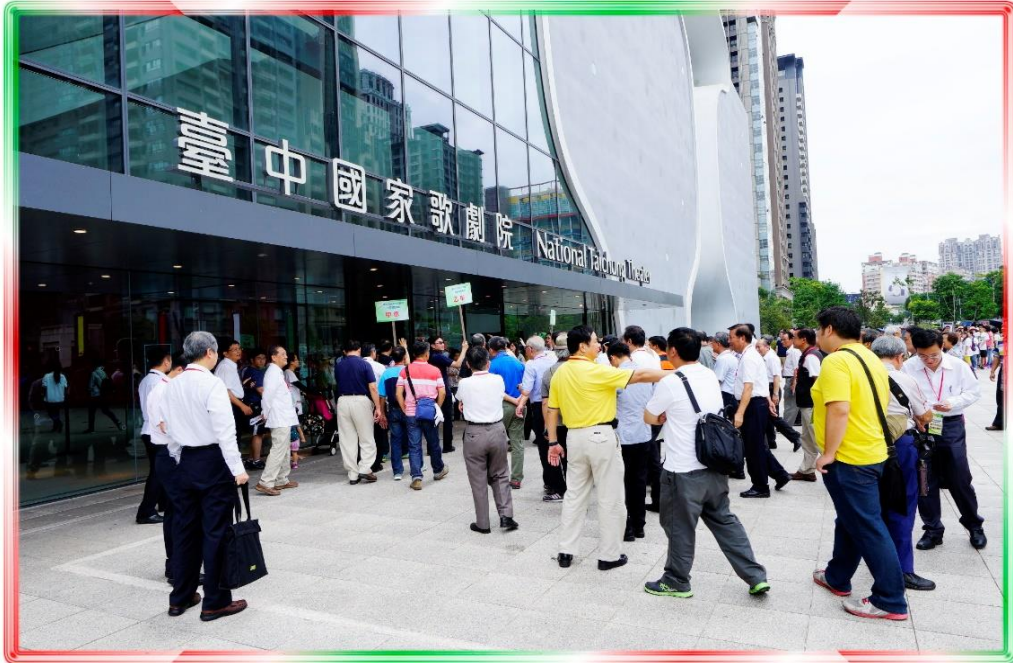
9/2 市政顧問參訪-臺中國家歌劇院門口集合照片