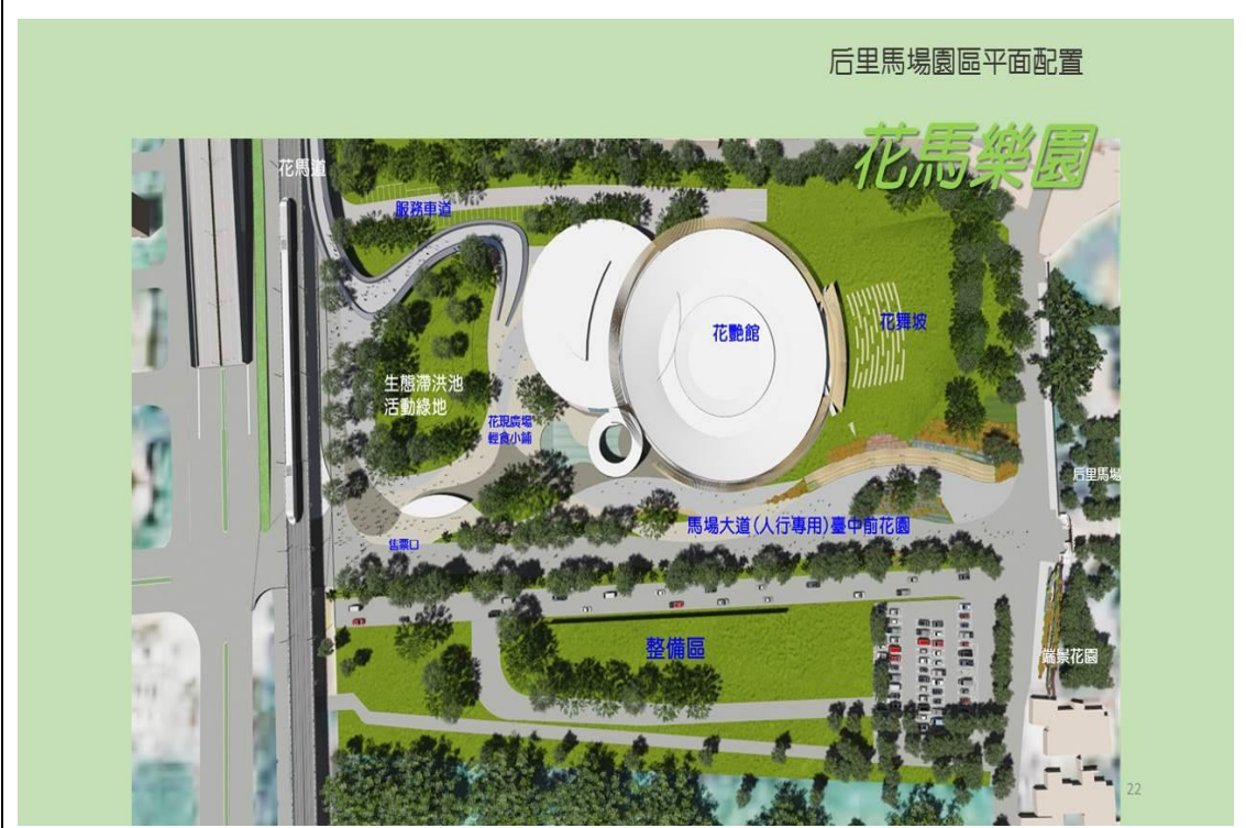
花博辦公室簡報資料-后里馬場園區平面配置