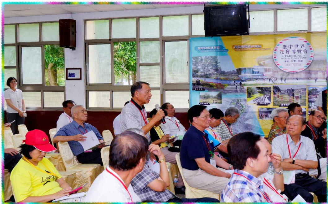
9/2 市政顧問參訪-花博預定地-后里園區市政顧問發言照片