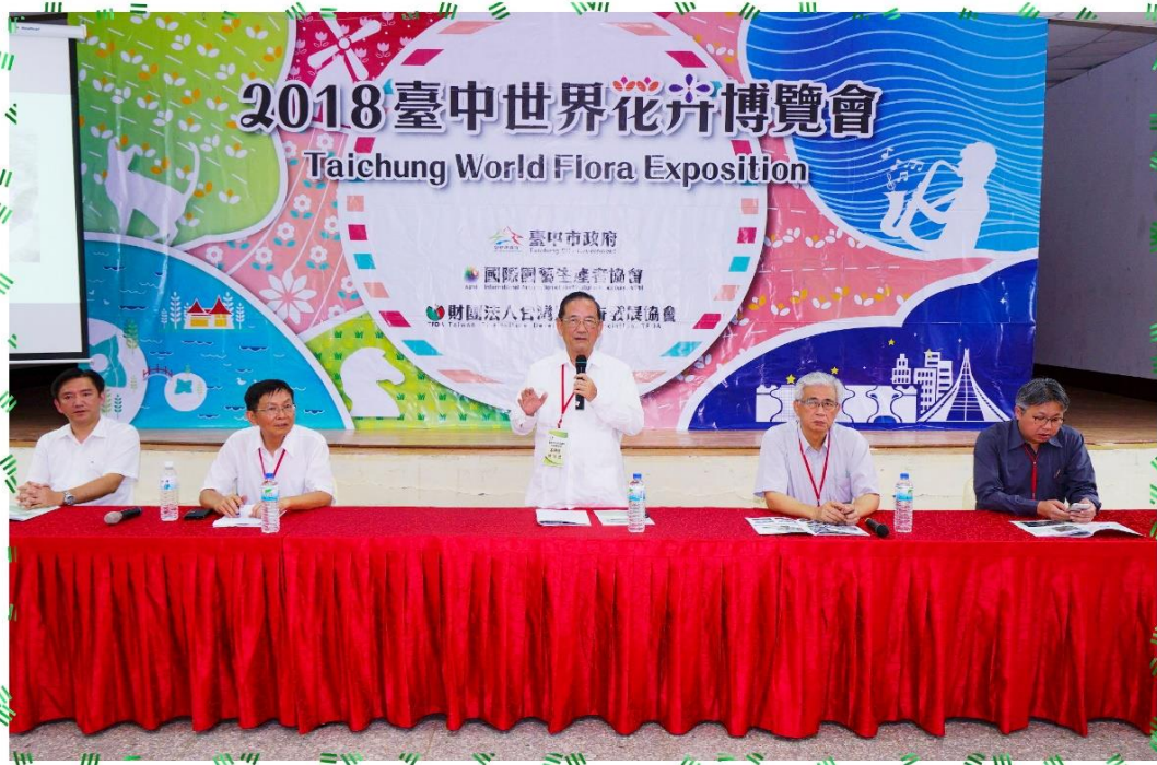
9/2 市政顧問參訪-花博預定地-后里園區林副市長主持照片