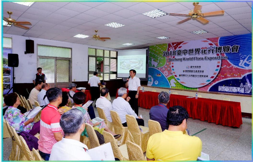
9/2 市政顧問參訪-花博預定地-后里園區簡報照片