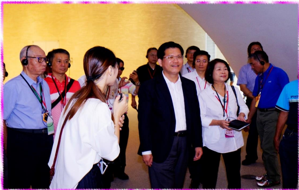
9/2 市政顧問參訪-臺中國家歌劇院內導覽照片