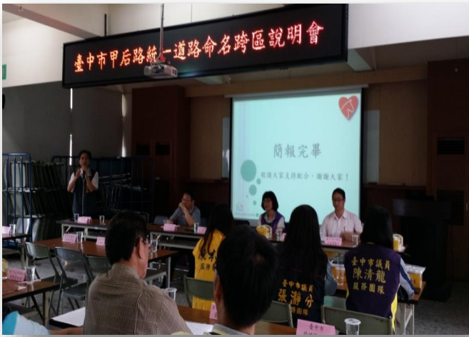
◎甲后路道路名稱分段更名跨區說明會