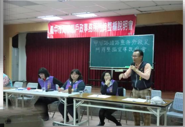
◎甲后路門牌整編說明會