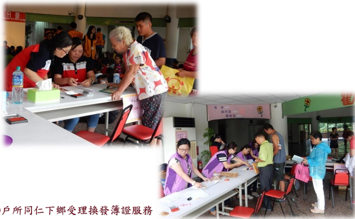
◎戶所同仁下鄉受理換發簿證服務

為降低民眾困擾，於門牌整編生效後，戶政事務所將主動派員至當地定點協助住戶免費換領國民身分證(免附照片)及戶口名簿，且未換發前上開簿證仍屬有效。