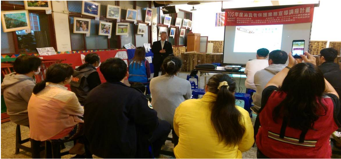
105 年消費者保護業務宣導活動照片-和平區環山社區