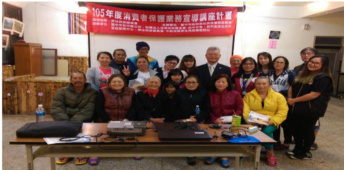
105 年消費者保護業務宣導活動照片-和平區環山社區