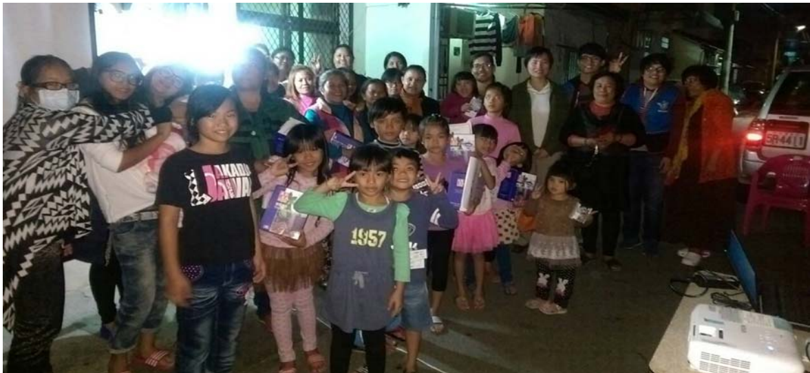
104 年消費者保護業務宣導活動照片-南屯區-排灣族聚落