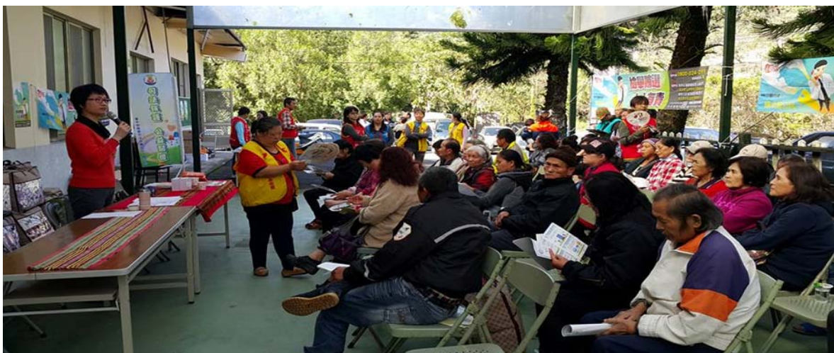
104 年消費者保護業務宣導活動照片-和平區原家中心