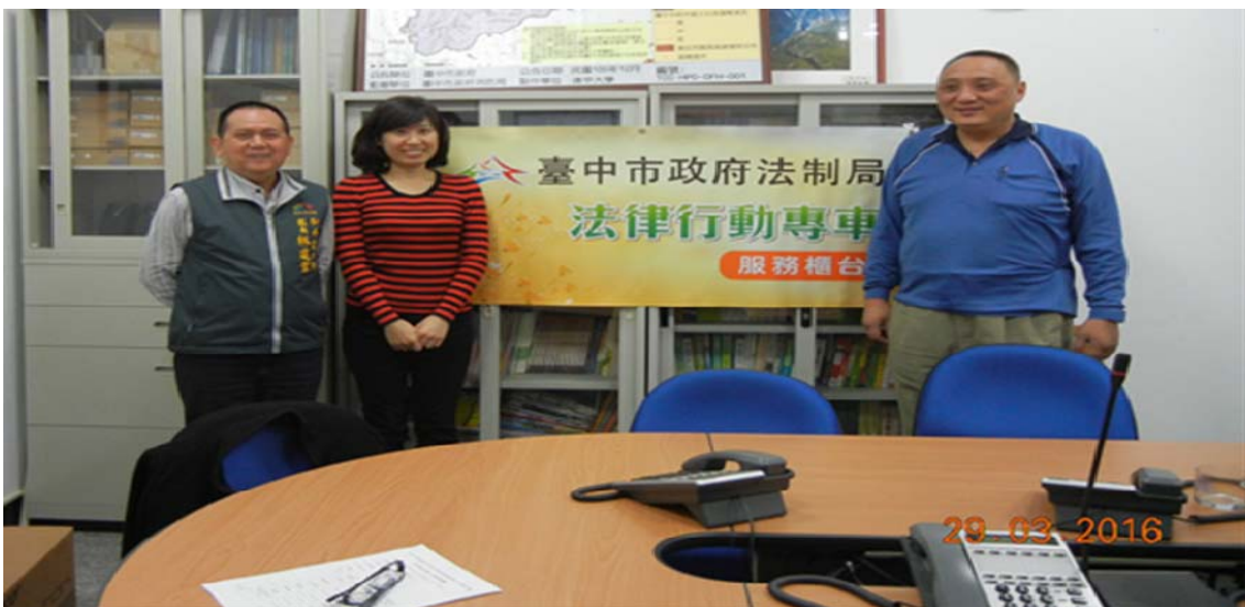
105 年度和平區法律行動專車