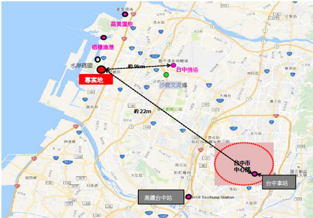
圖 2、交通相對位置圖