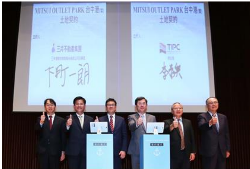
圖6、三井大型購物中心土地簽約儀式

尚品牌、餐飲及娛樂設施。搭配海線雙星、媽祖文化園區等海線相關景點，輔以海空雙港「中市進、中市出」政策可吸引相當可觀之遊客人潮，預估增加就業機會約1,500人，年業績預估可達150億元。