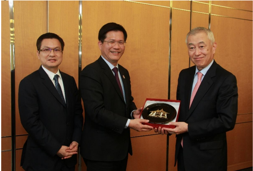
圖 4、市長拜會日本三井集團

三井集團評估投資台灣時，本府就積極協助，包括三井與臺灣港務公司的合作模式、行政程序與周邊配套等項目，準備將近一年，在 105 年 3 月 24 日三井不動產以在日本國內、海外所累積的成功開發經驗與大型商業設施的營運成果，獲得臺灣港務公司評選決定取得最優先議約權。同時在市長 105 年 3 月 31 日參訪日本時，前往東京三井不動產集團總部，拜會取締役社長菰田正信，共同宣布三井大型購物中心將落腳臺中港，堅定本案之投資信心