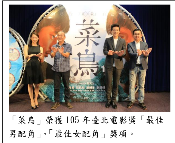
「菜鳥」榮獲 105 年臺北電影獎「最佳男配角」、「最佳女配角」獎項。

服務，在臺中拍片的相關行政申請程序十分順暢。他也感謝臺中市政府出借原警察局豐原派出所已未使用的二樓空間，讓劇組重新佈置，成為電影中「第八分局」的場景，而豐原派出所警員們在拍片過程中也提供許多專業建議，使「菜鳥」更貼近真實。