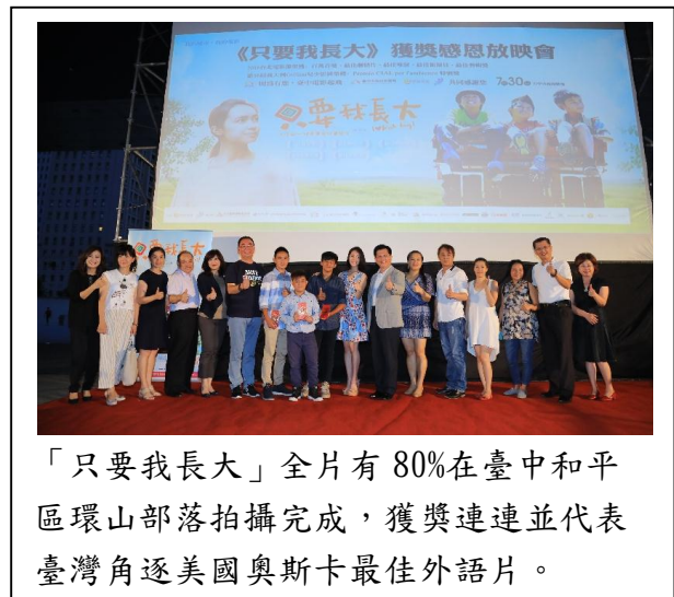
「只要我長大」全片有 80% 在臺中和平區環山部落拍攝完成，獲獎連連並代表臺灣角逐美國奧斯卡最佳外語片。