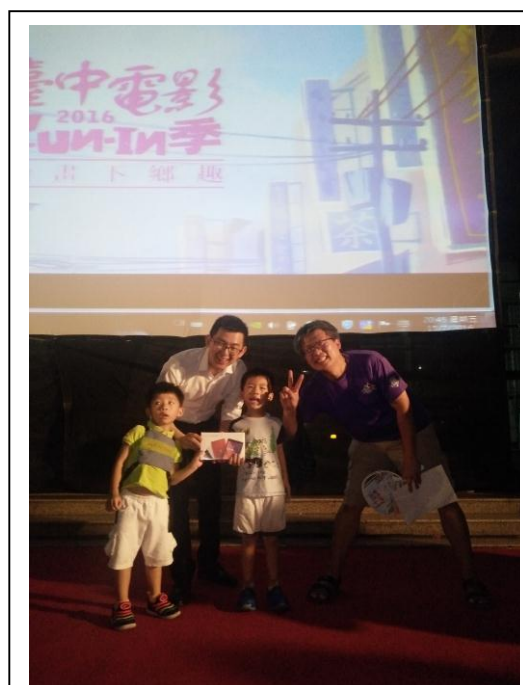
開幕場抽中平板電腦的幸運民眾。