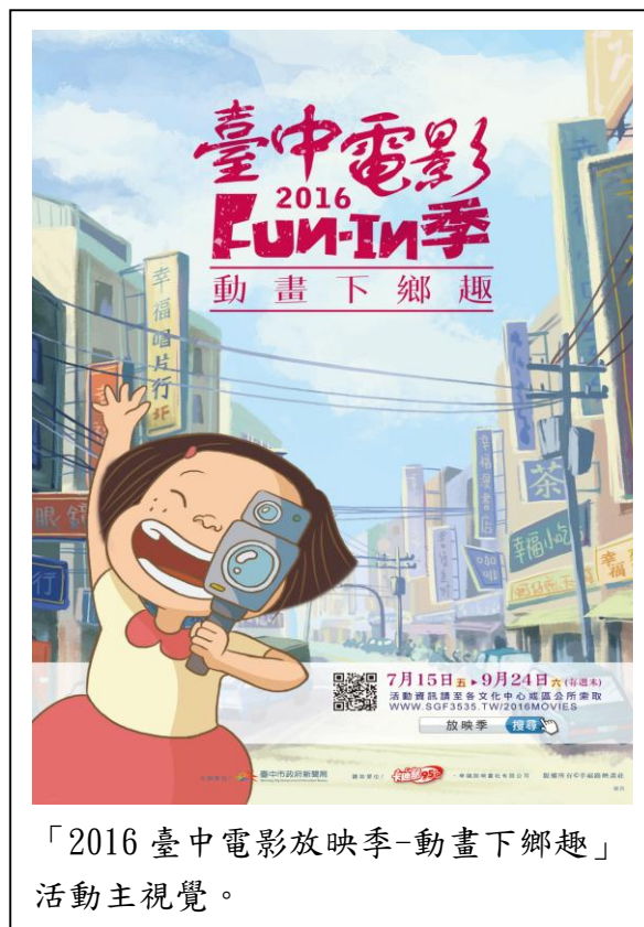
「2016 臺中電影放映季-動畫下鄉趣」活動主視覺。