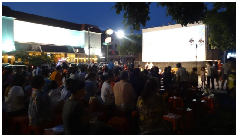
左鄰右舍相揪到戶外看電影，除了增進社區感情，也提升文化藝術的氣息。

106 年原爭取編列新臺幣 300 萬元的活動預算經費，在市議會考量各項市政推動急迫性比較下已被刪除，為了落實影視文化推廣的政策，本局將持續爭取預算，敬請市議會全力支持，為本市創造豐富文化涵養的宜居生活。