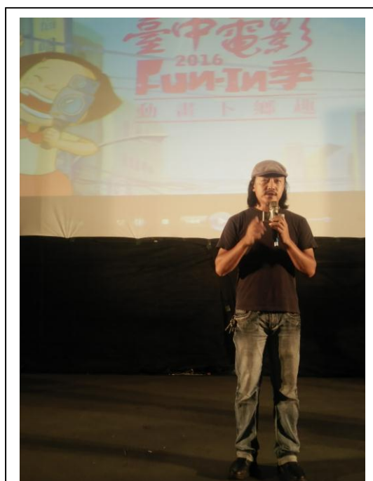
電影放映前動畫相關講師座談分享。

此外，每場次電影放映前安排動畫科系講師座談，不僅寓教於樂，讓許多家長可以在暑假期間的夏夜星空裡，帶著孩子們到戶外參與露天蚊子電影院，與左鄰右舍一起坐在大廣場上，吃零嘴看電影。期間各區民意代表、里長也到場同樂，不但拉近了人與人之間的距離，也培養了市民的文化氣息。