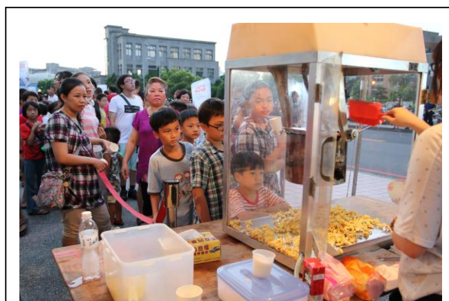
民眾排隊領取免費爆米花。

每個戶外場次皆免費提供限量爆米花、零嘴及飲料，所有場次更舉辦摸彩抽獎活動，送出文創背包、電影票等好禮，而開幕場送出最大獎為手機 iPhone6s 及平板電腦，閉幕場最大獎則是 5 臺 50 吋液晶電視。