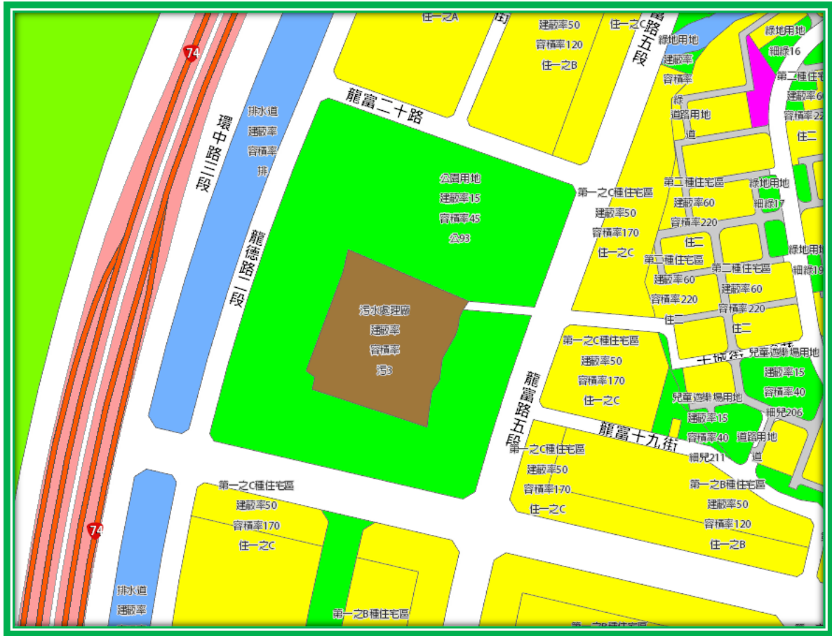
圖 2 公 93 公園用地細部計畫暨位置圖

「公 93 用地」屬單元二主要計畫內之公共設施用地，其四至範圍以南屯區龍富路五段、公益路二段、龍德路二段及龍富二十路為界，總面積 3.8379 公頃，細部計畫圖如圖 2 所示。