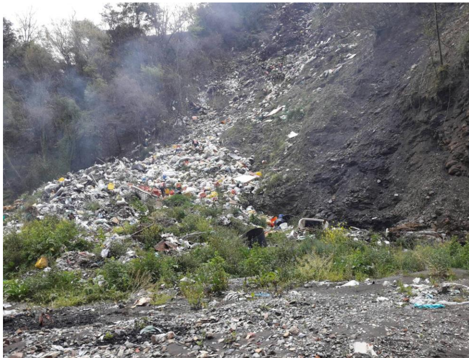
圖 18 和平區列管垃圾瀑布堆積情形