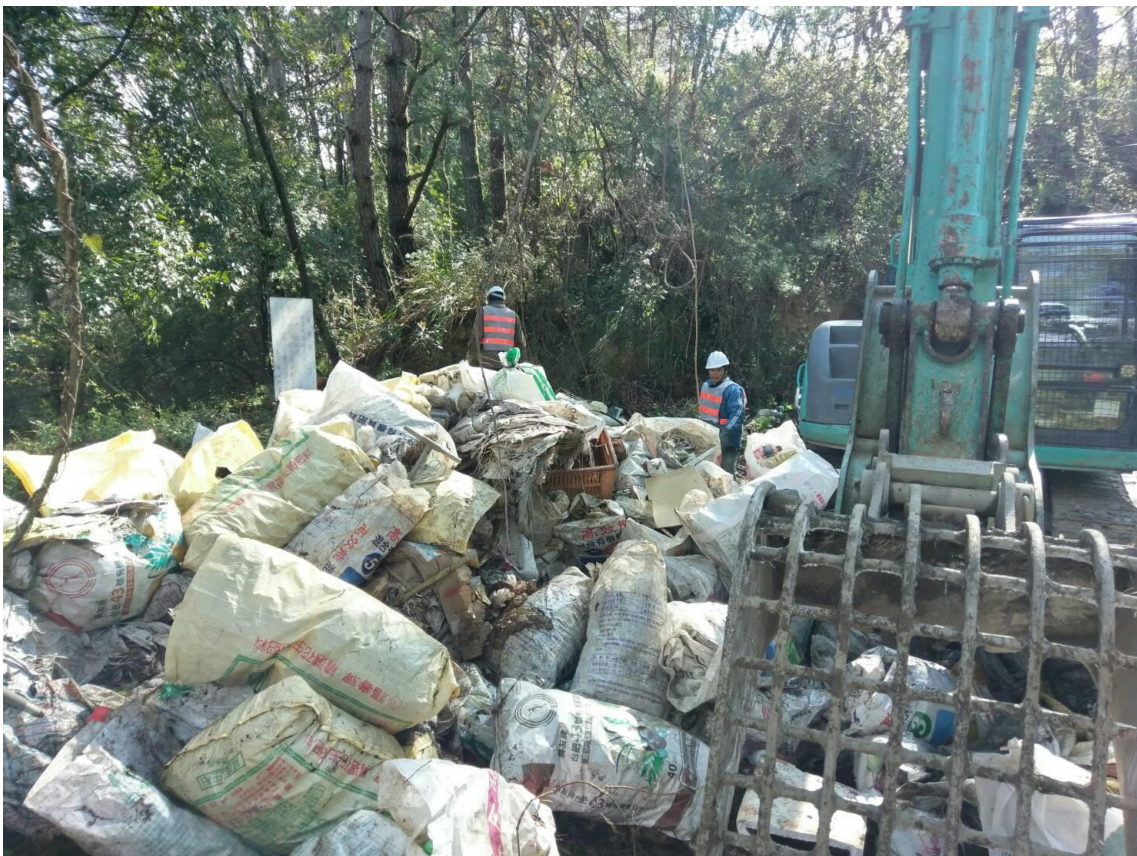
圖 20 和平區列管垃圾瀑布清理情形—平等里臺七甲線環山苗圃路段