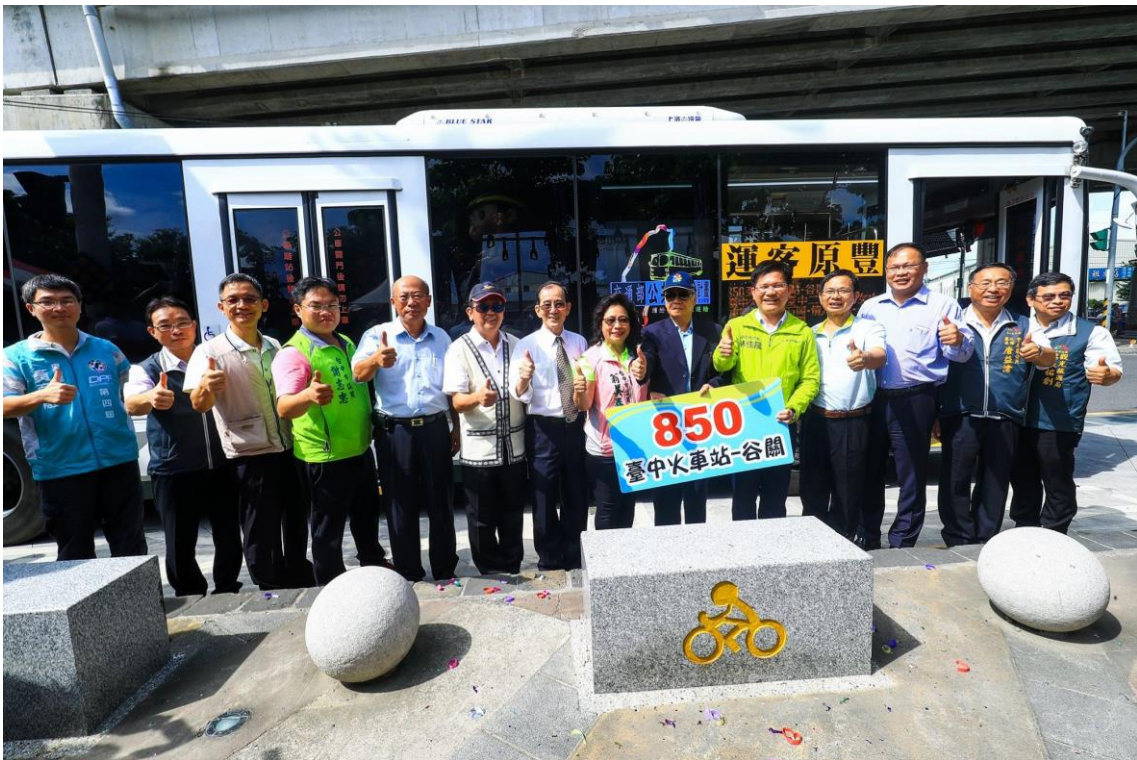
圖 7 谷關快線公車熱鬧上路！

本案自 106 年 6 月 28 日起上路，規劃自臺中火車站出發後，行經國道一號及四號，停靠東豐、后豐鐵馬道交會入口處，最後抵達谷關，每日共計 28 班次直達公車，除可節省民眾轉乘時間，亦可促進谷關地區觀光發展。