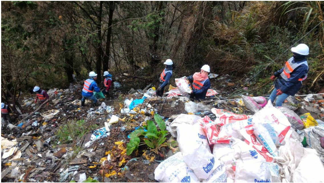
圖 19 和平區列管垃圾瀑布清理情形—梨山里福壽山