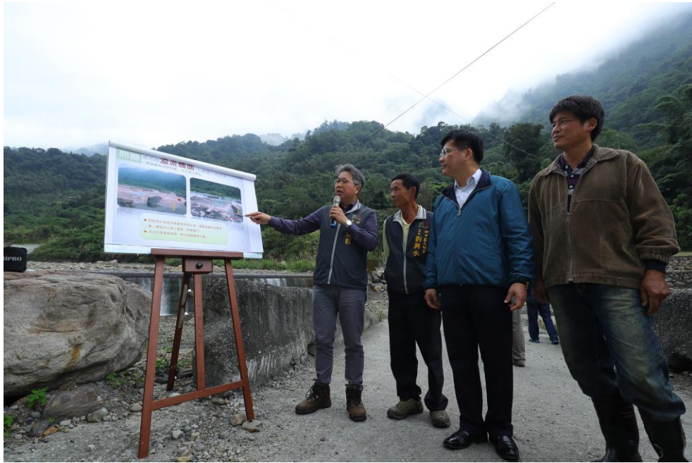
圖 2 天輪里東卯溪過水路面工程視察 (105/11/26)

2、水利局辦理「天輪里東卯溪過水路面工程」，投入經費 500 萬，藉由施作箱涵擴大斷面，減少水流阻礙，本案業於 105 年 8 月 31 日開工，並於 106 年 1 月 16 日完工，將可有效改善原有過水路面每逢颱風、豪雨即遭洪水湧上路面情形。