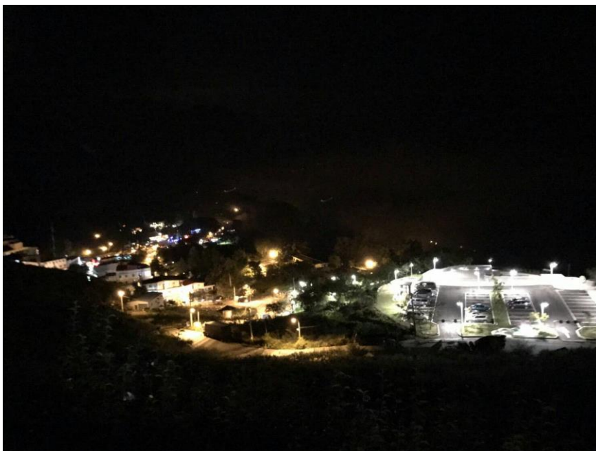
圖 6 臺中市彌平城鄉差距路燈增設工程—梨山里福壽山山下停車場周邊