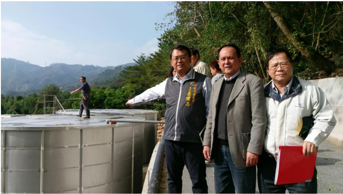
圖4 南勢里簡易自來水系統改善工程完工後視察 (106/01/16)

為保障偏遠地區居民基本飲用水安全，本府持續編列預算辦理簡易自來水系統修繕工程，以提供穩定且健康供水水源。經發局陸續於104年10月29日分別完成「梨山里佳陽社區簡易自來水系統改善工程」、「自由里烏石坑簡易自來水系統改善工程」，投入經費分別為285萬、456萬7千元；105年1月8日完成「平等里簡易自來水系統改善工程」，投入經費286萬；106年1月12日完成「南勢里簡易自來水系統改善工程」，投入經費375萬；106年3月27日完成「平等里第8鄰簡易自來水系統改善工程」，投入經費538萬。和平區公所亦於104年11月30日完成「博愛里裡冷部落簡易自來水系統改善工程」。