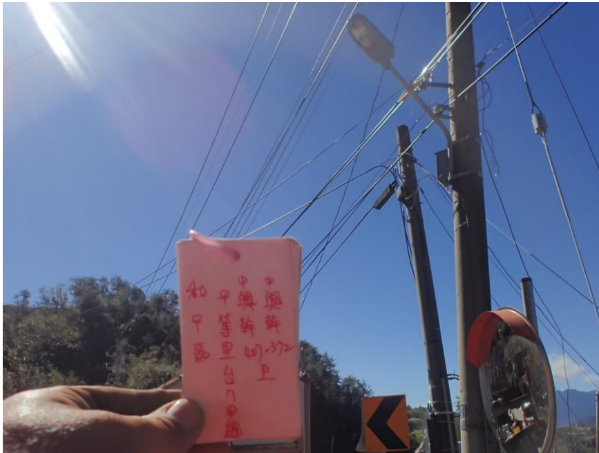
圖 5 臺中市彌平城鄉差距路燈增設工程—和平區 (105/12/27)

為彌平城鄉差距，建設局自 105 年起執行「山區農路點燈計畫」，本案業於 105 年 5 月 26 日開工，並於 106 年 3 月 31 日完成，其中和平區增設 307 盞路燈，將可提升當地用路安全。