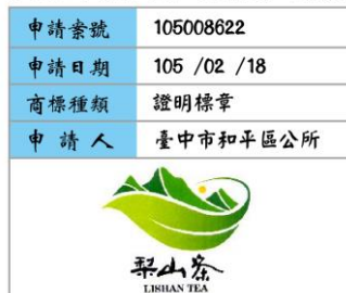
圖 9 梨山茶產地證明標章