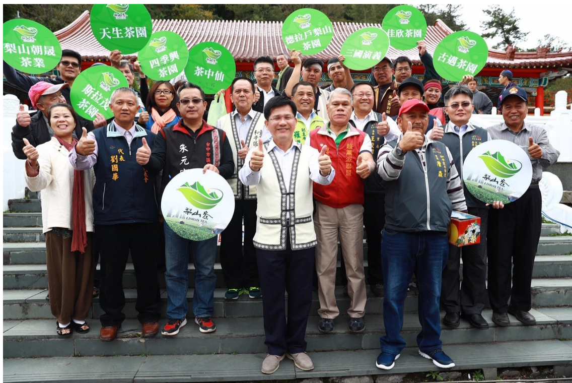
圖 10 市長力挺「有標章才是正港梨山茶！」