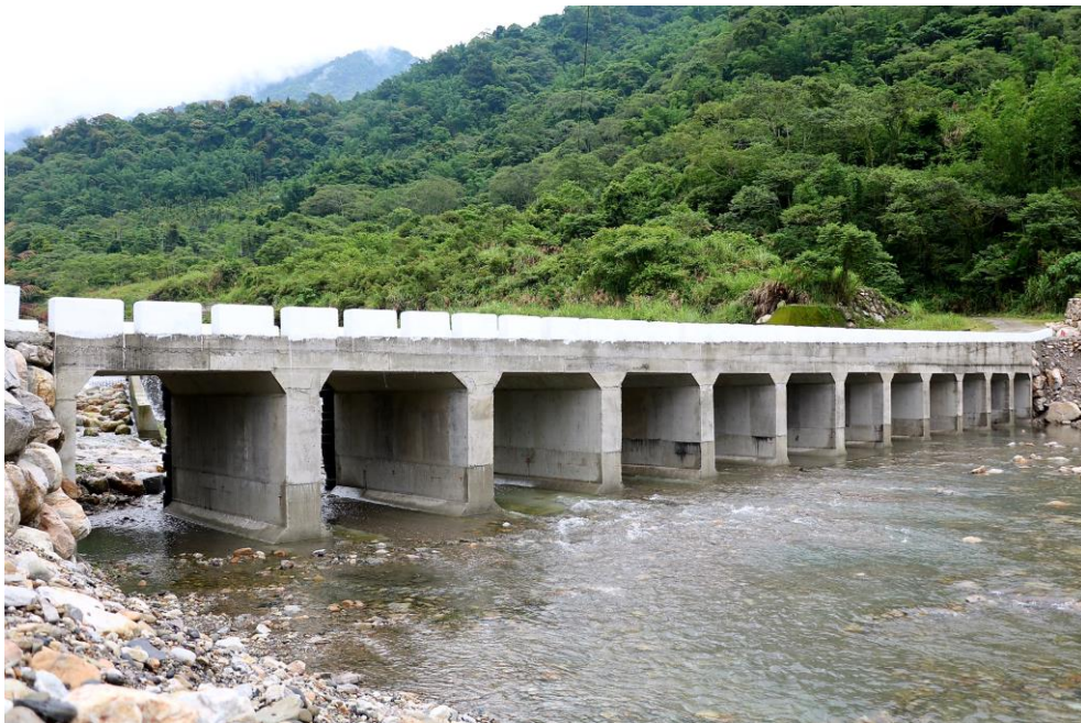
圖 3 天輪里東卯溪過水路面工程完工後視察 (106/05/26)