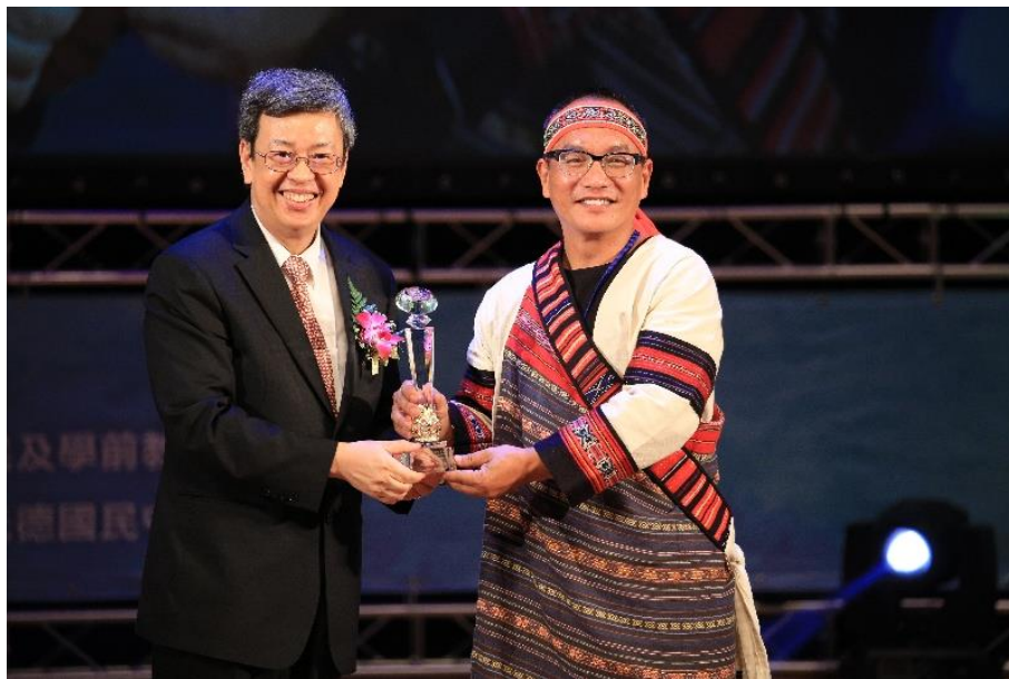
圖 16 副總統陳建仁親自頒獎予博屋瑪國小校長比令·亞布 (106/09/08)

博屋瑪國小於 105 年 8 月 25 日辦理自編教材試教，為落實民族教育，量身打造以泰雅文化為本、部落素材為體的教學方式，讓原住民學童透過母語認識自身文化，發揚文化傳承的使命。106 年 6 月 16 日為第一屆畢業典禮，計有 12 名學生畢業。106 年 9 月 8 日博屋瑪國小雙獲「教學卓越獎—銀質獎」及「校長領導卓越獎」的肯定，讓民族教育發展方向更為明確。