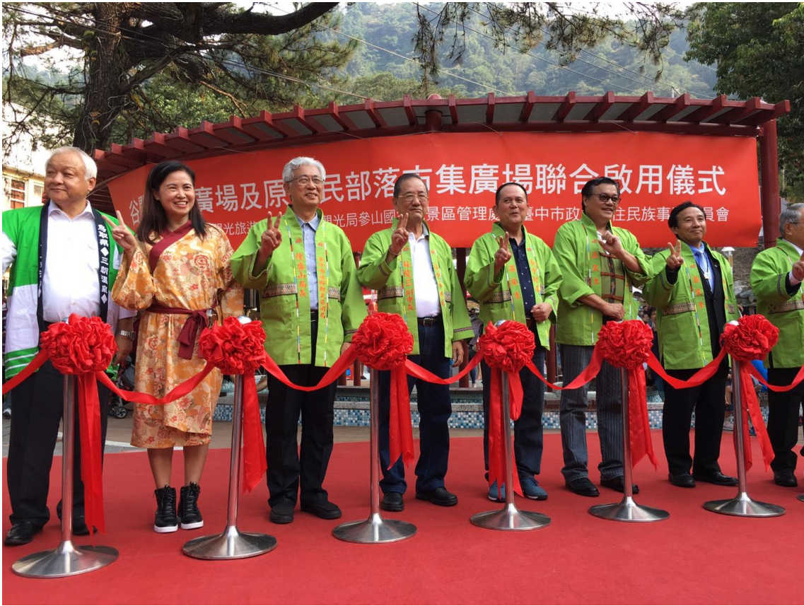
圖 14 谷關溫泉廣場暨原住民部落市集廣場聯合啟用儀式 (106/09/23)