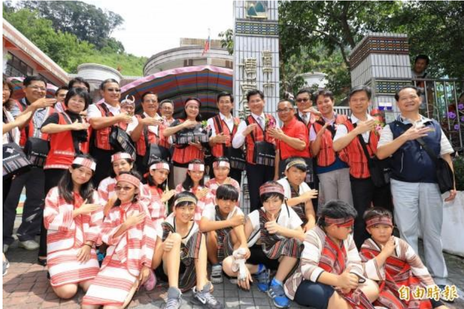
圖 15 原達觀國小改制博屋瑪國小熱鬧揭牌 (105/08/24)

博屋瑪國小於 105 年 8 月 25 日辦理自編教材試教，為落實民族教育，量身打造以泰雅文化為本、部落素材為體的教學方式，讓原住民學童透過母語認識自身文化，發揚文化傳承的使命。106 年 6 月 16 日為第一屆畢業典禮，計有 12 名學生畢業。106 年 9 月 8 日博屋瑪國小雙獲「教學卓越獎—銀質獎」及「校長領導卓越獎」的肯定，讓民族教育發展方向更為明確。