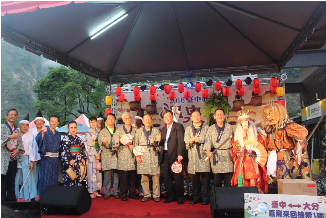
圖 13 2016 臺中好湯溫泉季—谷關遊街趣浴衣嘉年華（106/09/10）

觀旅局連年規劃溫泉季行銷活動，推動中臺灣溫泉觀光產業發展，「2016 臺中好湯溫泉季」活動期間自 105 年 9 月 1 日至 10 月 31 日止，除可體驗溫泉文化、品嚐特色美食、走訪懷舊景點，更有許多在地文化藝術及民俗技藝活動供遊客選擇。「2017 臺中好湯溫泉季」更進一步推動溫泉觀光國際化，邀請日本岐阜縣下呂溫泉區及南韓大田市儒城溫泉區締結臺日韓三國溫泉觀光交流合作協定，希望為臺中創造跨國溫泉商機與觀光人潮。