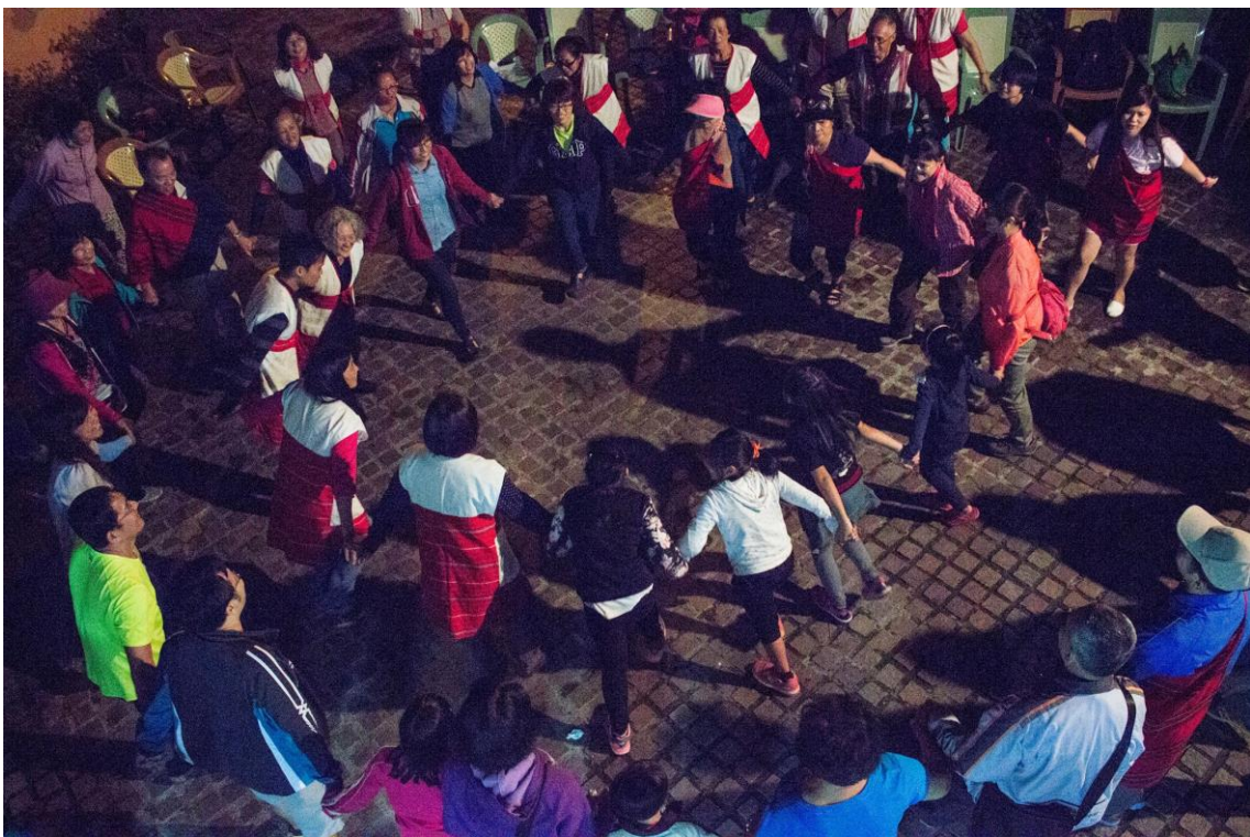
圖 12 105 年度「跟著泰雅足跡去旅行」二日遊 (105/08/13~14)