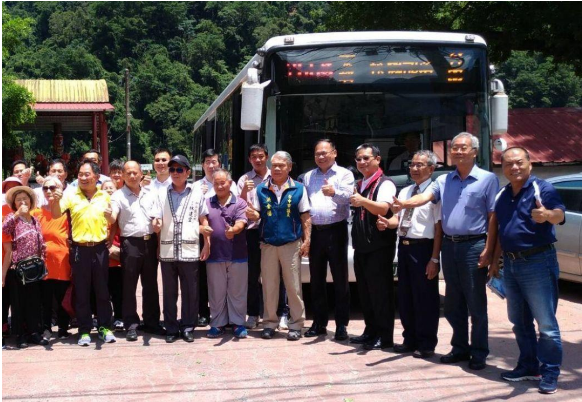
圖 8 首部公車開進部落，當地居民齊按讚！