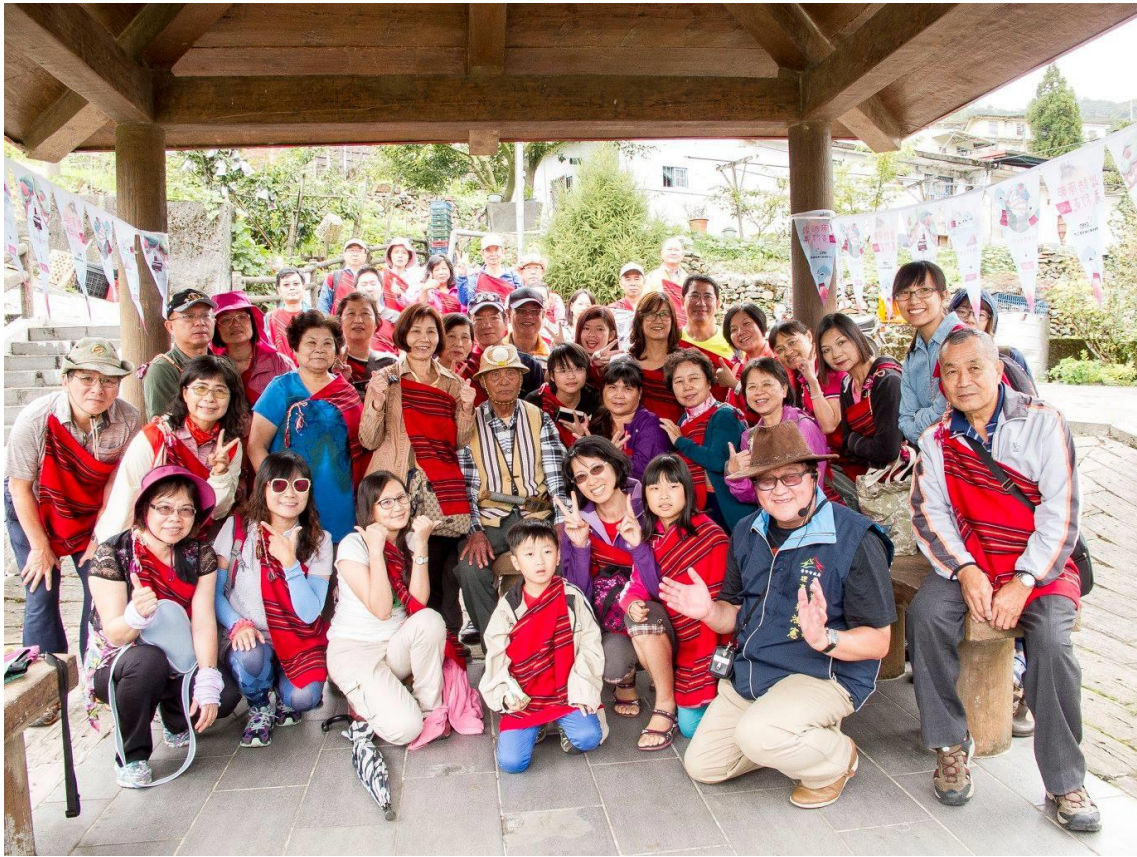
圖 11 105 年度「跟著泰雅足跡去旅行」二日遊 (105/08/13~14)