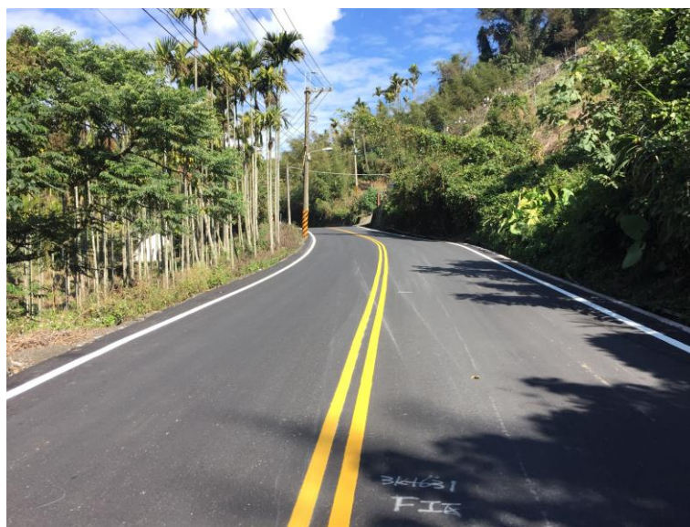
圖 1 和平區東崎路路平工程完工 (3K+631)

建設局每年持續於和平區施作路平工程，105 年度辦理「東崎路路平工程」，投入經費 1,271 萬，施作路段為東崎路自竹林派出所至下雪山坑，全長約 3 公里、寬約 8 公尺，本案業已於 106 年 1 月 25 日完成，將可改善道路面積 24,744 平方公尺。