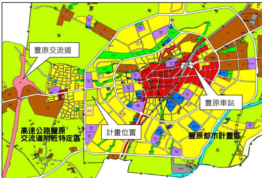
圖 1 計畫區位置示意圖