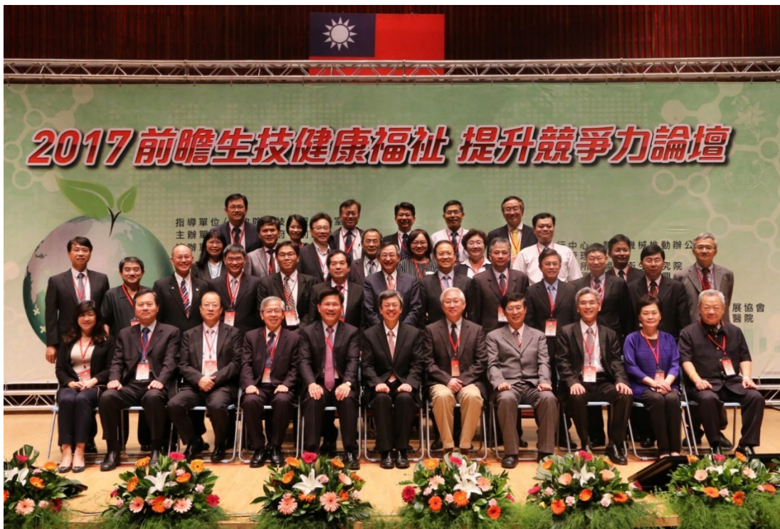
圖 6 106 年 5 月 13 日辦理 2017 前瞻生技健康福祉提升競爭力論壇

本府經濟發展局已於 106 年編列預算辦理招商作業，並進行招商文件、設定地上權及召開說明會等招商規劃事宜，預計 107 年 6 月前公告招商。