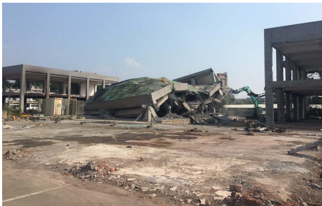
圖 4 豐富專案工地現況（106 年 10 月拍攝）