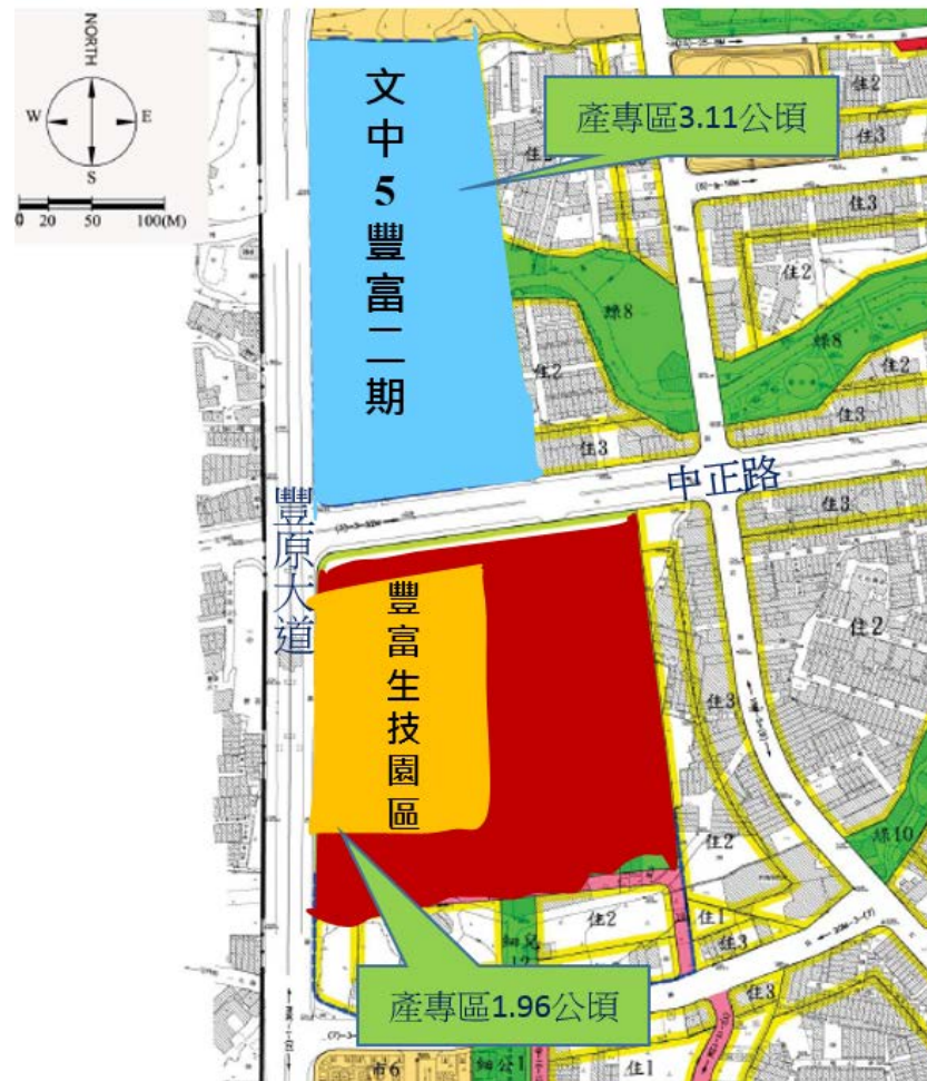
圖 5 豐富專案一期與二期發展構想

豐富二期開發面積 6.8 公頃（產專區 3.11 公頃）正進行都市計畫變更作業，刻蒐集陳情人意見及召開市都委會專案小組討論會議，預計先以第一期作為生技產業的引進，成為中部生技產業領頭羊的角色。