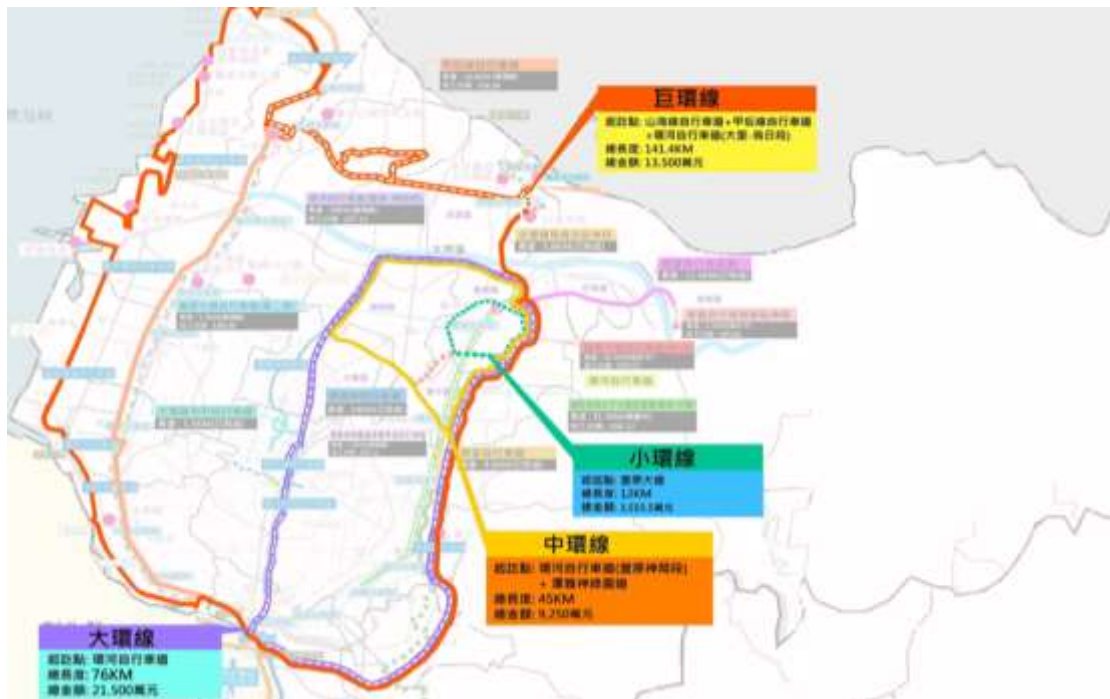
圖 3 臺中市自行車四環線計畫

計有小環(豐原大道自行車道，12 公里)、中環(環河自行車道-豐原神岡段+潭雅神綠園道，45 公里)、大環(環河自行車道，76 公里)與巨環(山海線自行車道+甲后線自行車道+環河自行車道-大里至烏日段，141.4 公里)，其中包含豐原大道自行車道、甲后線自行車道及山線自行車道等(詳圖 3)，均陸續竣工或辦理規劃設計作業中。