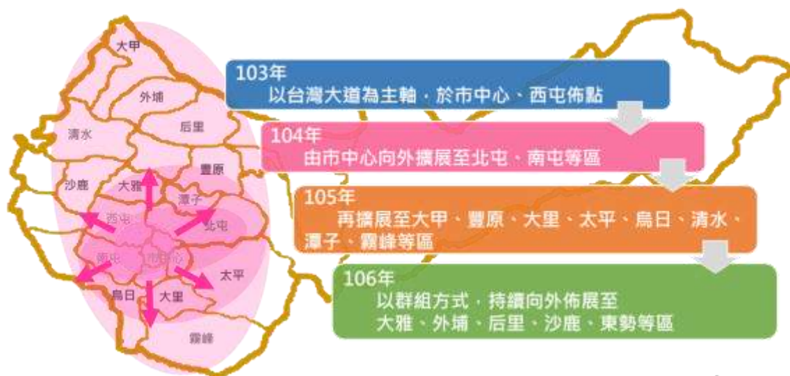
圖 2 本市 iBike 租賃系統推行計畫