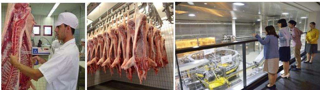
▲豬隻屠體評級示意圖 ▲豬隻評級後預冷示意圖 ▲開放部分空間供民眾參觀示意圖

肉品市場除應具有傳統批發市場屠宰場功能外，應提供零售販賣服務，並開放部分空間作為一般民眾、團體參訪、教育使用，進而串聯周邊具教育意義之場區，如烏日焚化爐、烏日水資源回收中心以及烏日高鐵維修站、衛生掩埋場等，發展成休閒觀光兼具教育性質之園區，以附加價值帶動產業升級。