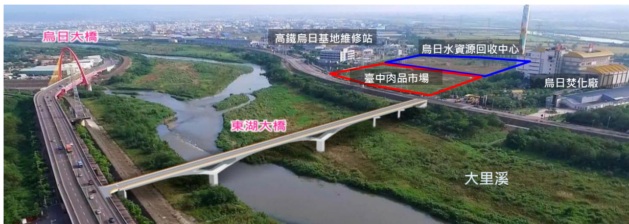
圖 2 聯外道路-東湖大橋示意圖