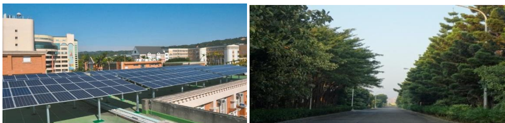
▲屋頂設置太陽能板示意圖

新場規劃參酌「屠宰場設置標準」，規劃動線、減少繞行、內部公共空間規劃緊密連結，場區外圍留設緩衝隔離綠帶及設施，屋頂部分空間以太陽能板搭建、配合屋頂雨水回收機制，作為場區清洗、沖廁及澆灌使用，符合環保、節能概念。