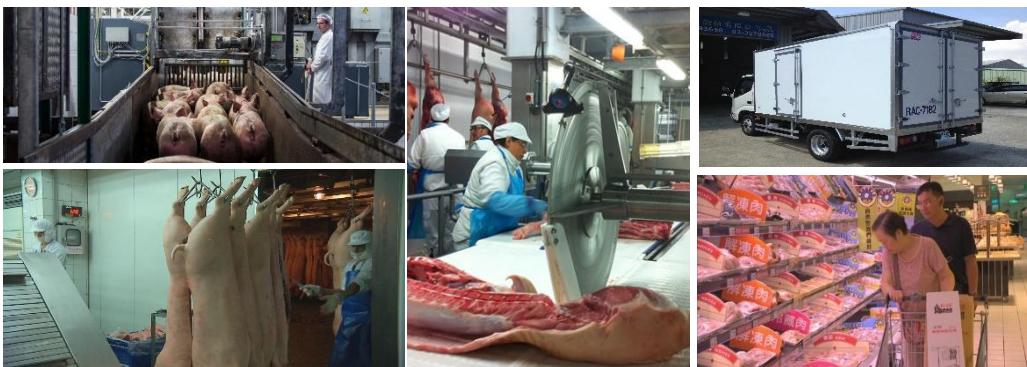
▲設備及產能升級、結合冷鏈物流，冷凍(藏)肉品直達消費端示意圖

參考國內、外優質案例，配合現代化肉品市場管理及設備升級、整體規劃場區之空間配置，以有限空間創造最大產能，並加強維護肉品安全衛生，捍衛消費者食肉健康，促進產業永續發展，同時需整合低溫運輸及肉品銷售端之冷藏櫃設備。