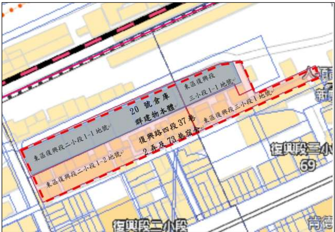
圖4 臺鐵宿舍群位置圖

本臺鐵宿舍群位於復興路四段37巷2弄及73巷，約計19間建築物，其坐落土地位於臺中市東區復興段二小段1-2地號及復興段三小段1地號(詳圖4)。