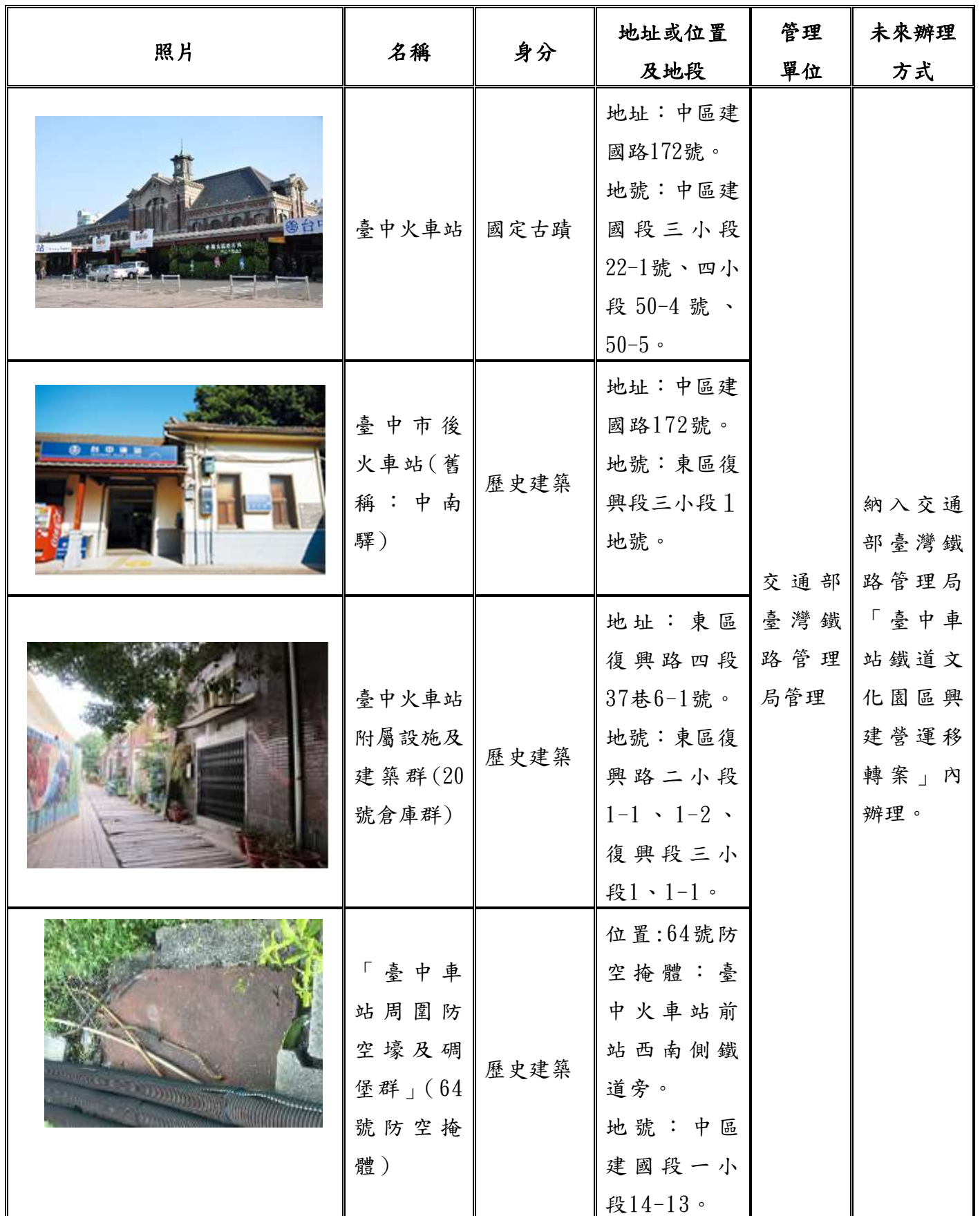
表2 促參範圍內法定文化資產列表