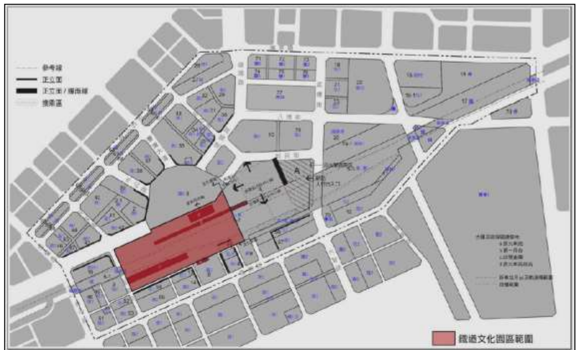
圖1鐵道文化園區範圍圖

本案基地位於市府民國100年3月11日公告實施之「擬定臺中市都市計畫(配合臺中都會區鐵路高架捷運化計畫-臺中車站第區)細部計畫書(第一階段)」所劃定之車站專用區(詳圖1)，範圍為新臺中車站以西之土地；計畫範圍則包含新臺中車站部分商業空間及地下停車場、國定古蹟「臺中火車站」，包含第一月台、第二月台、歷史建築「臺中市後火車站(舊稱：中南驛)」及「臺中火車站附屬設施及建築群(20號倉庫群)」、西南段部分鐵路高架軌道下方空間等建築物。