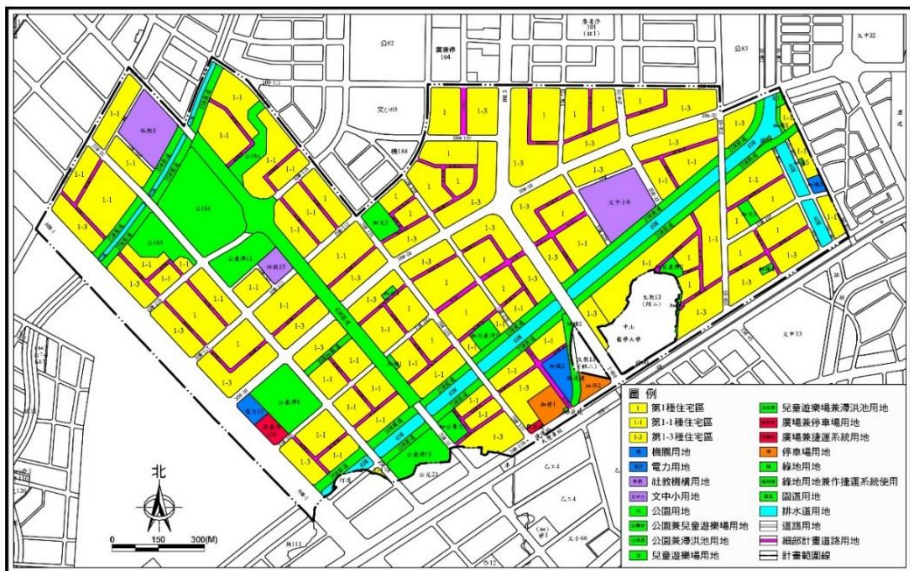
圖 4 變更後都市計畫示意圖