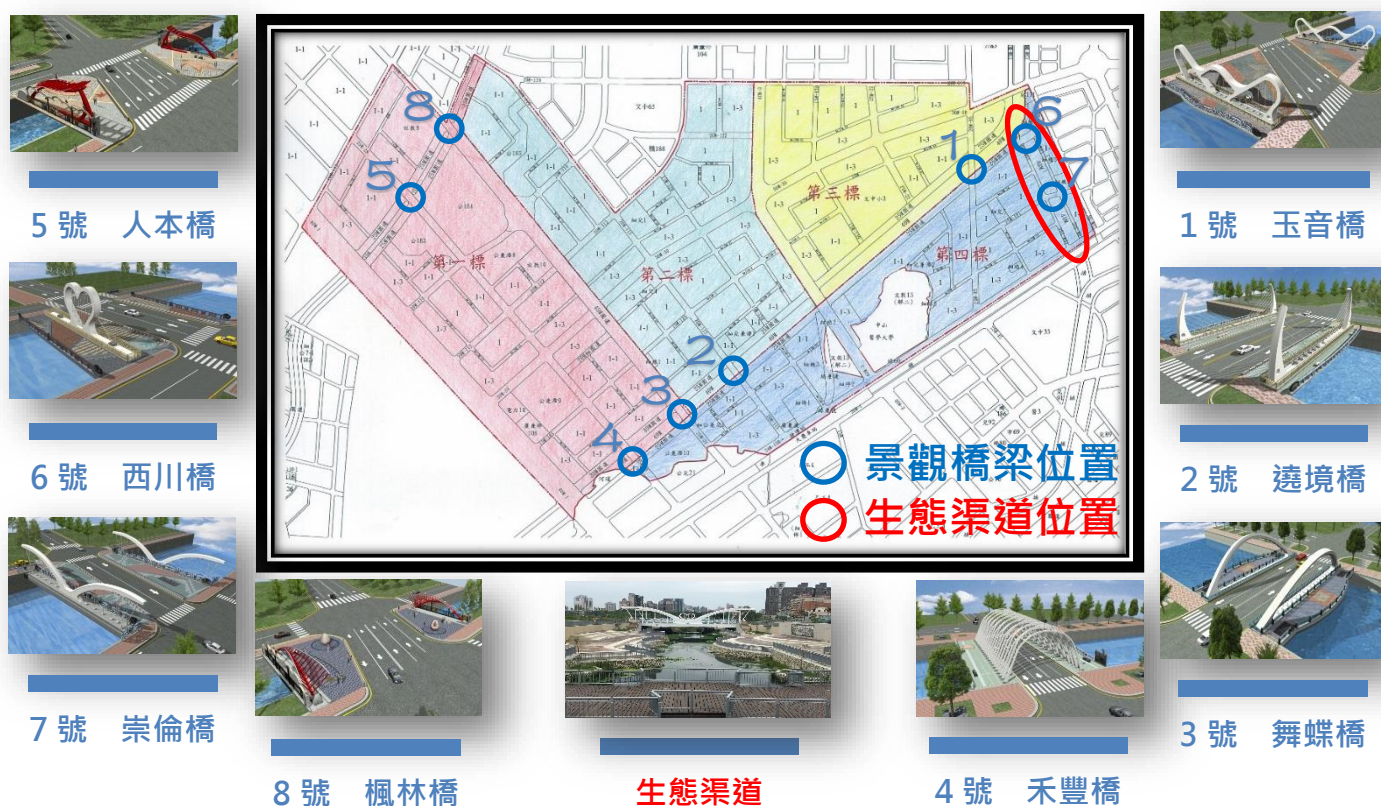
圖 5 第 13 期市地重劃區工程分區示意圖

本重劃區工程係由地政局擔任主辦機關，工程規劃設計監造係委由內政部土地重劃工程處代為辦理，全區劃分為四區土木工程及一個橋梁暨生態景觀渠道工程標案（工區示意圖詳如圖 5）。其中橋梁工程係委由內政部土地重劃工程處代辦專案管理，杜風工程顧問有限公司擔任設計監造角色，各工區工程發包及施工進度情形分述如下：