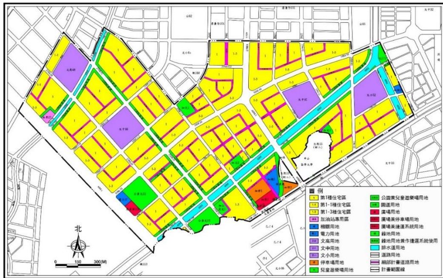
圖 3 現行都市計畫示意圖

市地重劃計畫書(修正),送經市地重劃主管機關審核通過後,再併同修正後之都市計畫變更書圖報請該部逕予核定,始得發布實施。有關重劃計畫書修正草案,於106年7月報內政部審核,歷經3次審退,經本府修正補充後,已於107年4月再送內政部審核,目前由該部審核中。(現行都市計畫及修正草案詳如圖3、圖4)