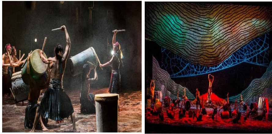
表演團隊：九天民技藝團《大肚王朝》