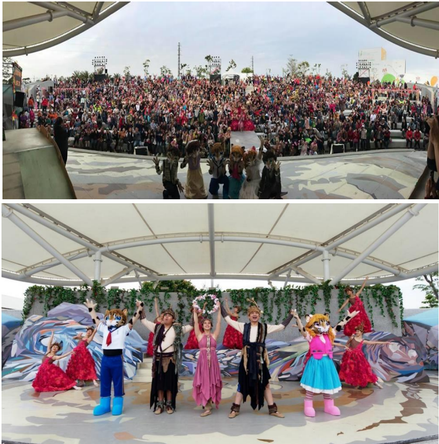
表演團隊：台灣青年舞團《山櫻花之環》