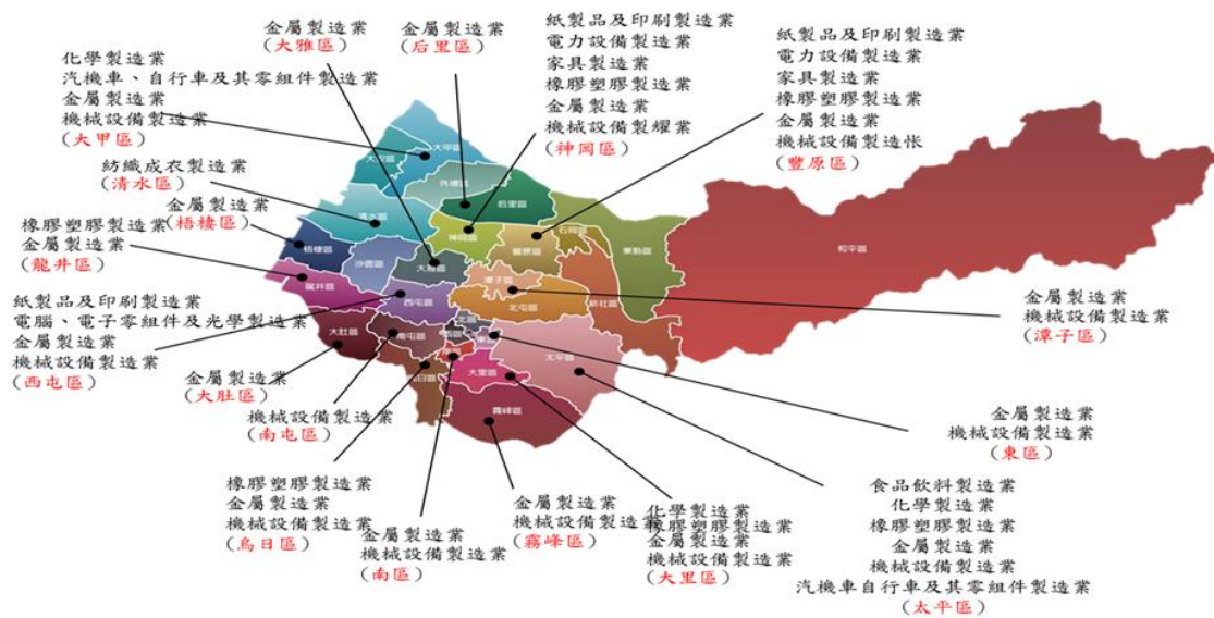
圖 2-1：臺中市產業分布圖

本市之工具機暨機械零組件、光電面板產業、自行車及零組件、木工機械、手工具、航太產業發展歷程極為悠久，為臺灣最重要之工業產業聚落，並享有「影響全世界的 60 公里」美譽。在三級產業（商業及服務業）方面，本市為中部區域之中心都市，三級產業人口佔全市產業人口近 6 成，可謂本市經濟命脈所在。