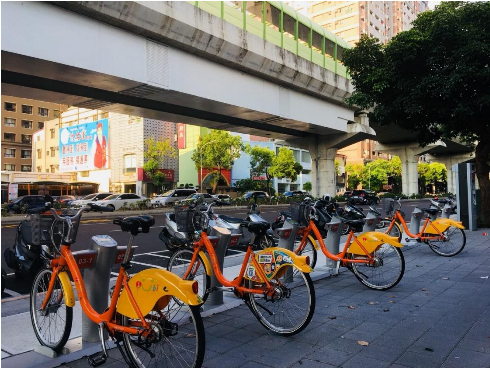
圖 3. iBike 文心崇德路口站現地照片