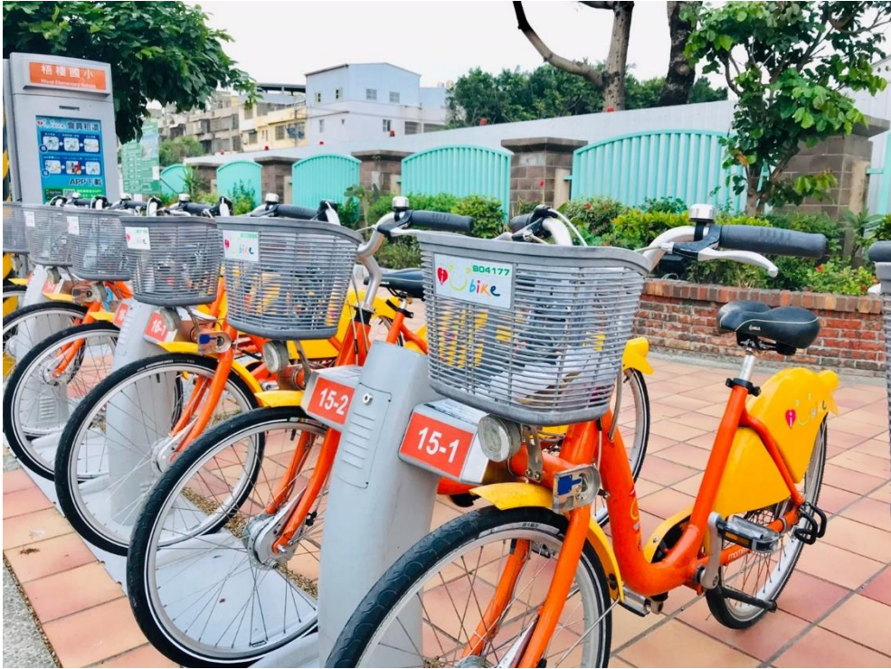
圖 2. iBike 梧棲國小站現地照片