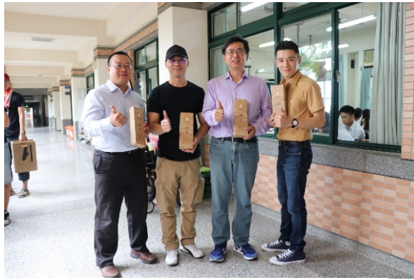
圖 1：『給我愛 the teacher』劇組探班