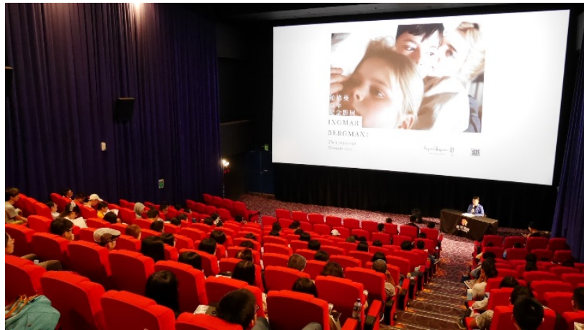
圖 9：柏格曼百年紀念影展－臺中場盛況空前