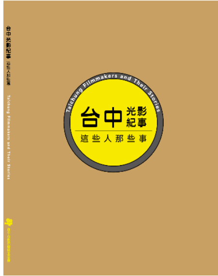
圖 5：影視專書「臺中光影紀事 這些人那些事」封面