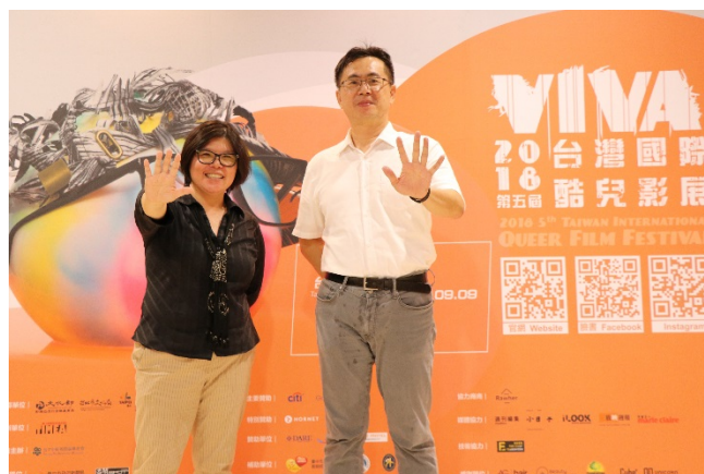
圖 8：酷兒影展於臺北、臺中、臺南、高雄串聯播映