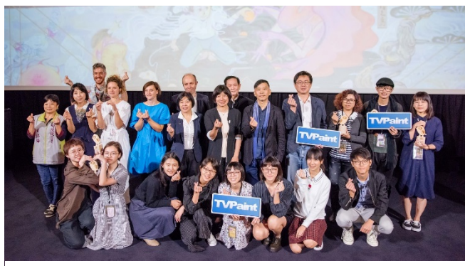
圖 10：臺中國際動畫影展首度以雙影城形式辦理