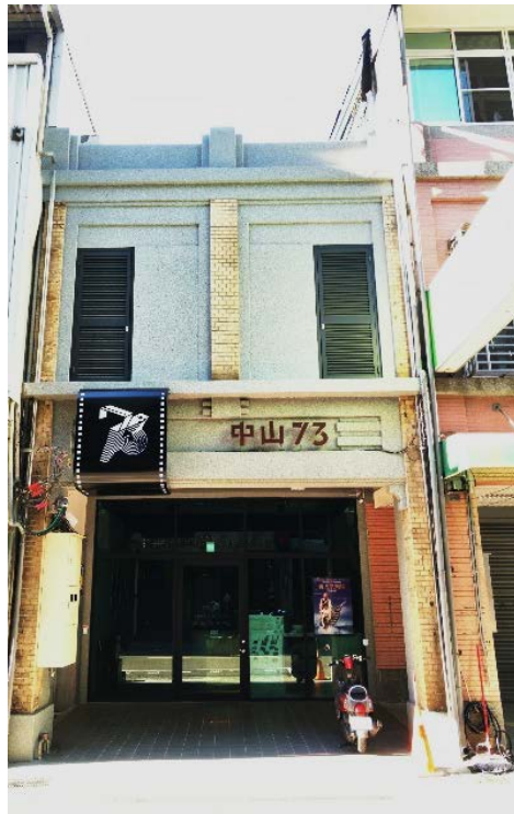
圖 13：中山 73 正面