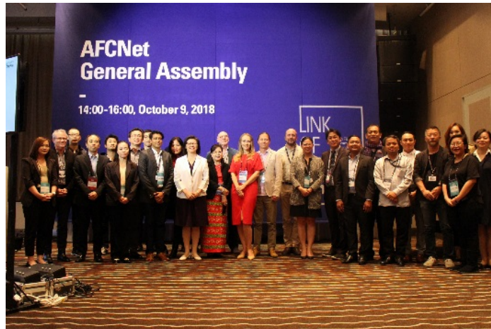
圖 4：AFCNet 會員大會