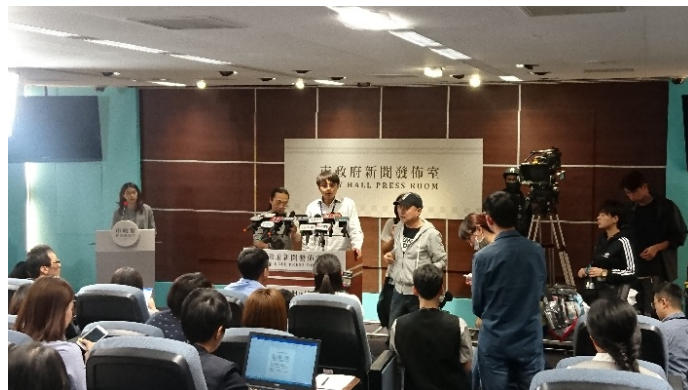
圖 2：『王牌記者』劇組探班