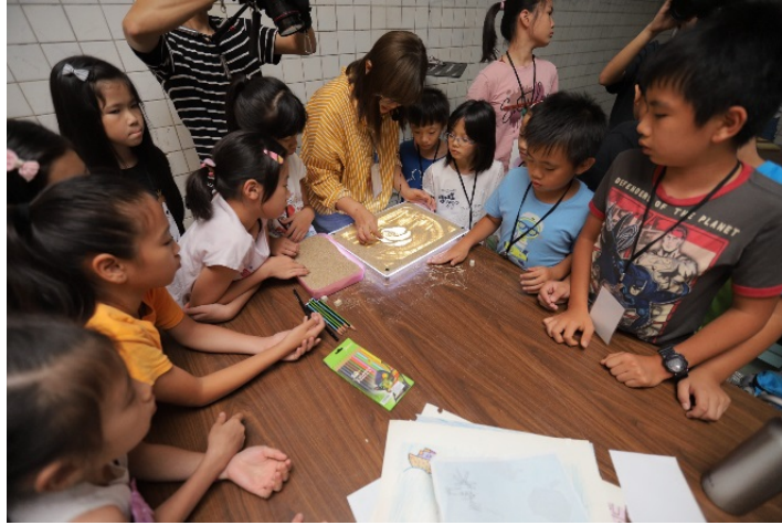
圖 7：小朋友專注學習動畫製作的原理