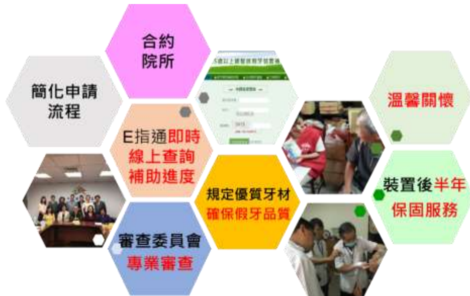
圖 3:延續性假牙裝置補助計畫執行策略與特色