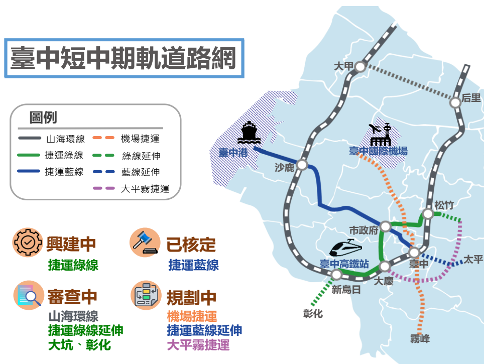
圖 1：臺中短、中期軌道路網示意圖

為建構本市完善大眾運輸網，捷運綠線作為臺中第一條的捷運路線，未來將作為都市與高鐵、臺鐵連結轉乘的橋梁，為臺中便捷交通奠定穩定的基礎，截至今年 8 月底整體進度達 85.85%，預計 109 年底前通車營運；捷運藍線已於今年 3 月啟動綜合規劃，預計 2 年內完成綜合規劃並呈報交通部，爭取中央核定；山海環線及綠線延伸可行性研究目前已在交通部審查，本府會積極配合交通部審查，以爭取中央加速核定；機場捷運及大平霧捷運目前也正如火如荼辦理可行性規劃研究中，本府會儘速完成，依程序函報中央審查，臺中短、中期軌道路網如圖 1 所示。