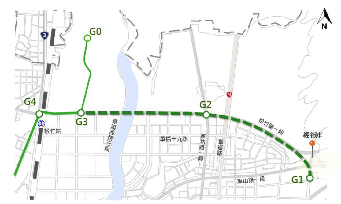
圖 3 捷運綠線延伸大坑路線示意圖

路線規劃自捷運綠線 G3 舊社站起，沿松竹路向東延伸，跨越臺 74 號線至大坑經補庫地區。全線採高架型式規劃，全長 2.49 公里，新設 2 處車站，預估經費 79.61 億元，如圖 3。