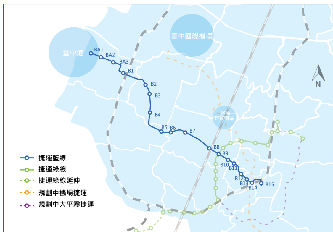
圖 2 捷運藍線路線規劃示意圖