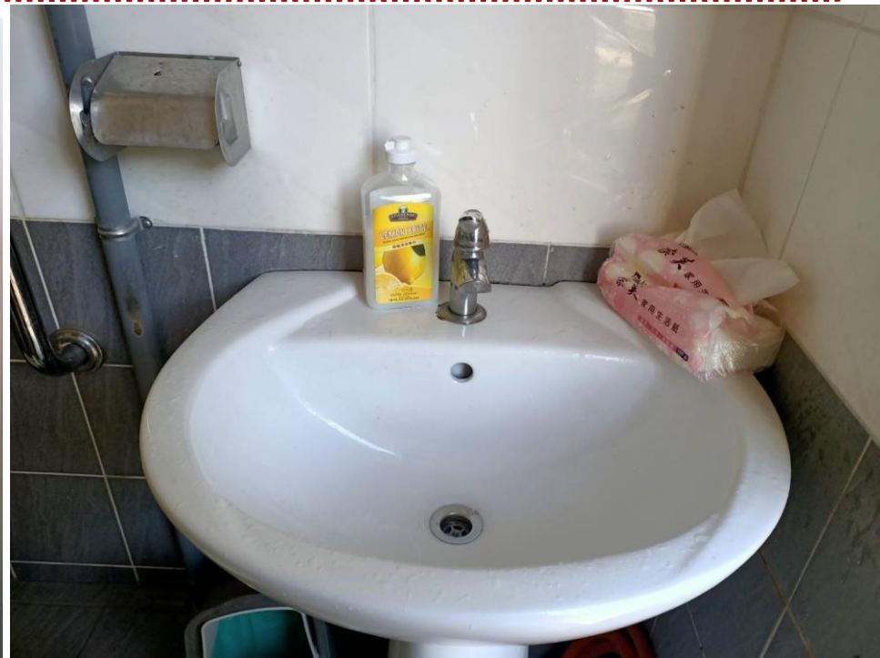
大慶公園備有洗手乳