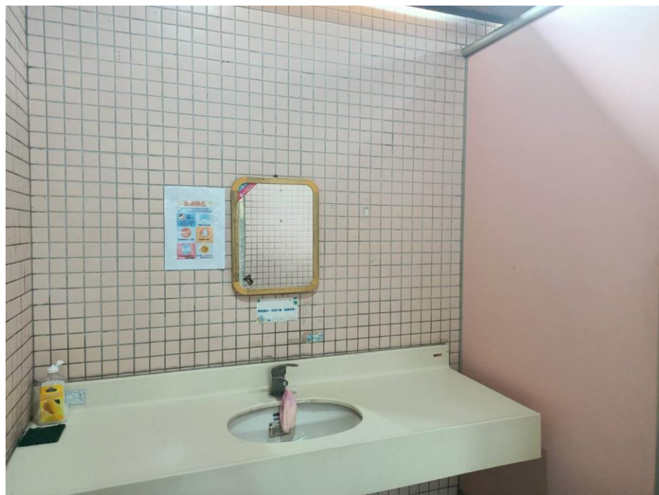
南平公園張貼海報及備有洗手乳

為因應本市針對武漢肺炎2019新型冠狀病毒防疫作業，本所對轄管南平公園，大慶公園等二公園之公廁設置洗手乳及張貼防疫宣導單相關宣導資訊，以利協助民眾並共同作好防疫工作。