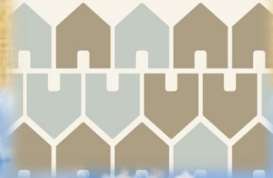
浪漫臺三線指標導覽系統 - 主視覺色系表

聚落名，位處臺中市石岡區九房里，石岡街東側、豐勢路北側，石岡國小東邊900公尺處。為黃姓居民所形成的血緣集村。乾隆16年(西元1751年)，潮州府海陽縣(今潮安縣)人黃英隆入墾，為九房屋最早之開闢者，初期只有九戶人家，故得名。其公廳「江夏堂」在廣興宮東側。