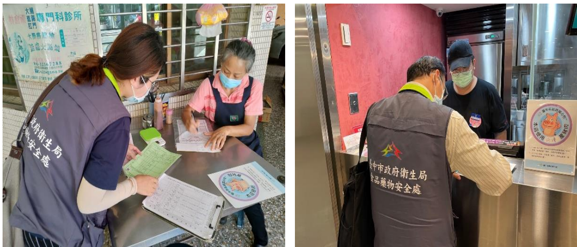
圖 4、宣導牛豬肉品標示