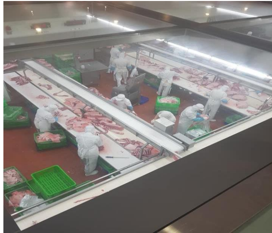
圖 11、學校訪視上游食材商情形