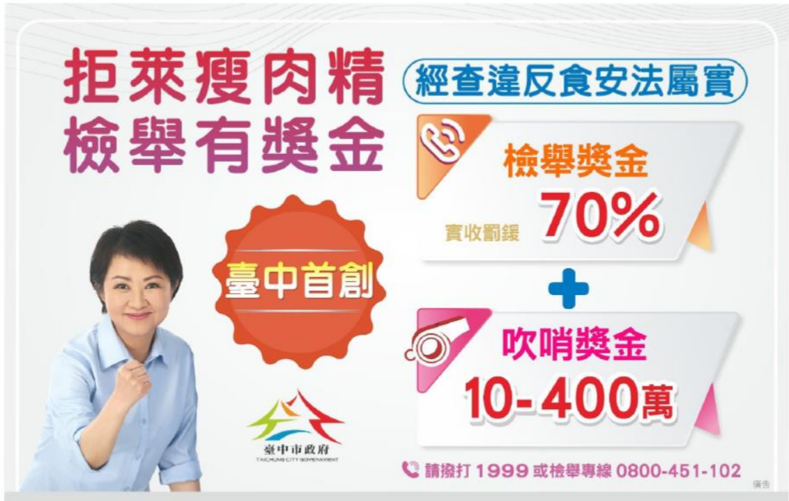
圖 13、「拒萊瘦肉精 檢舉有獎金」圖卡

民眾可透過本府陳情整合平台、1999 專線、本市食品藥物安全處(04-22220655)、政風處檢舉專線(04-22288226)、或撥打檢舉專線(0800-451-102)等管道提出檢舉(圖 13)，在不洩漏陳情人個資下，交由食安處專責查察辦理。