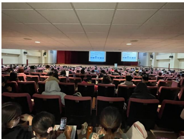
圖 9、辦理強化瘦肉監控研習