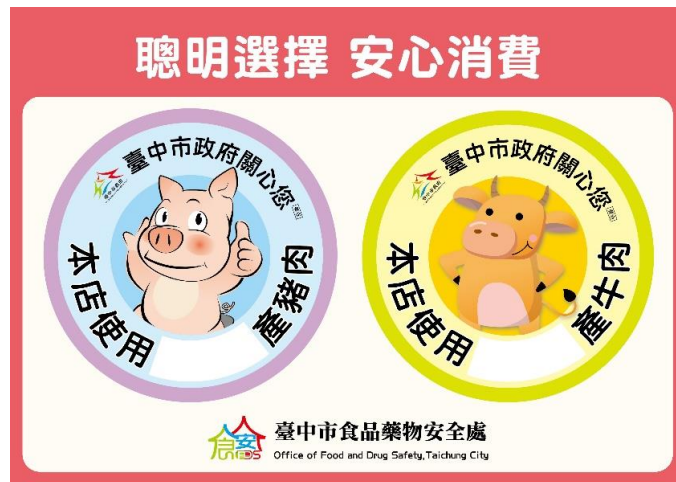
圖 3、「牛哥豬弟」肉品安心標示貼紙圖樣