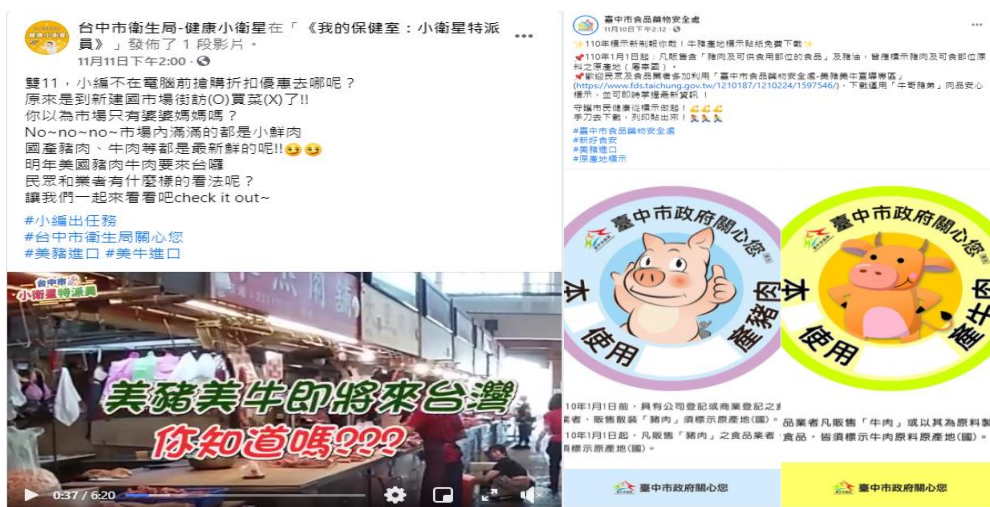
圖 16、本局及食品藥物安全處臉書影片宣導

(1) 啟動跨局處橫向聯合分工，持續推廣本市「牛哥豬弟」肉品產地標示輔導，並運用網頁、臉書、社群群組、跑馬燈、電子看板、公車智慧站牌及臺中交通網 APP 等多元媒體管道(如圖 16、圖 17)，設計懶人包及圖卡、發布新聞稿，結合觀光行銷，加強民眾宣導。