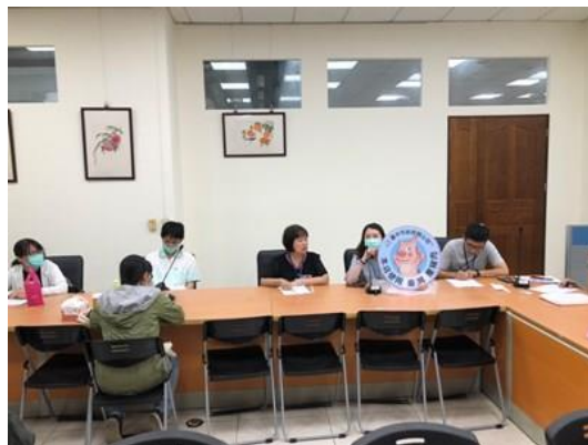
圖 2、109 年 11 月辦理養豬頭數調查勤前會議，請本市區公所人員加強標章宣導並廣為周知

此外，輔導本市在地特有生鮮豬肉及其加工產品，如大安-飛天豬、養豬協會-豬市吉等，運用新興加工技術，加速自有品牌多元化開發，同時以品牌即是品質的保證策略，提供市民完整選購平台與管道。清楚標示生鮮肉品產地及必要資訊，充分保障民眾的選擇權，建立消費者對於國產肉品的信心。