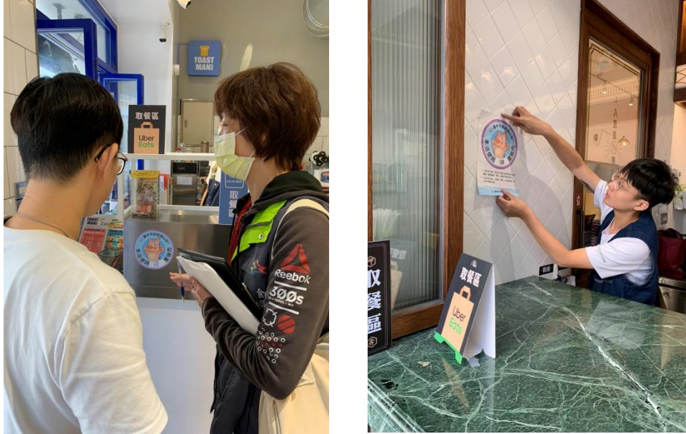
圖 6、本府肉品來源標示輔導情形