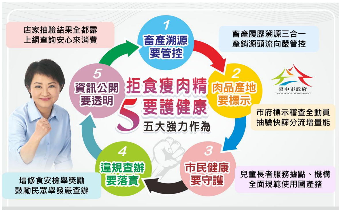
圖 1、本府 5 大強力作為推動示意圖