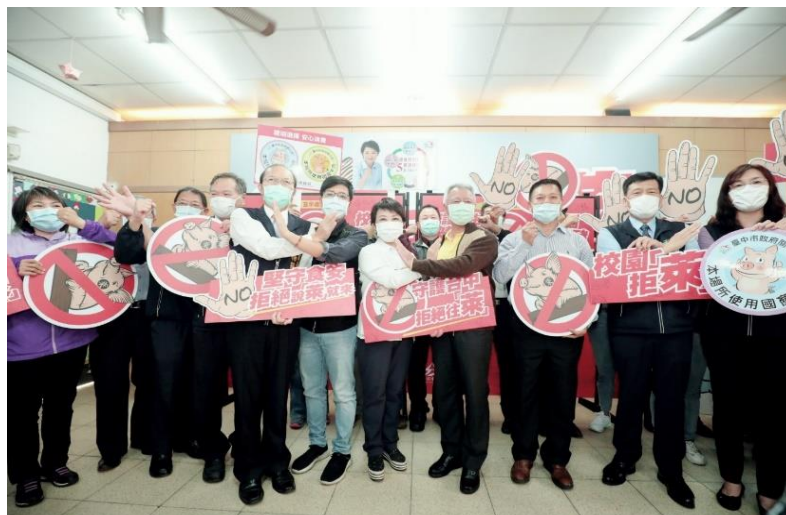
圖 19、109 年 12 月 2 日教育局舉辦「臺中市拒絕往『萊』記者會」