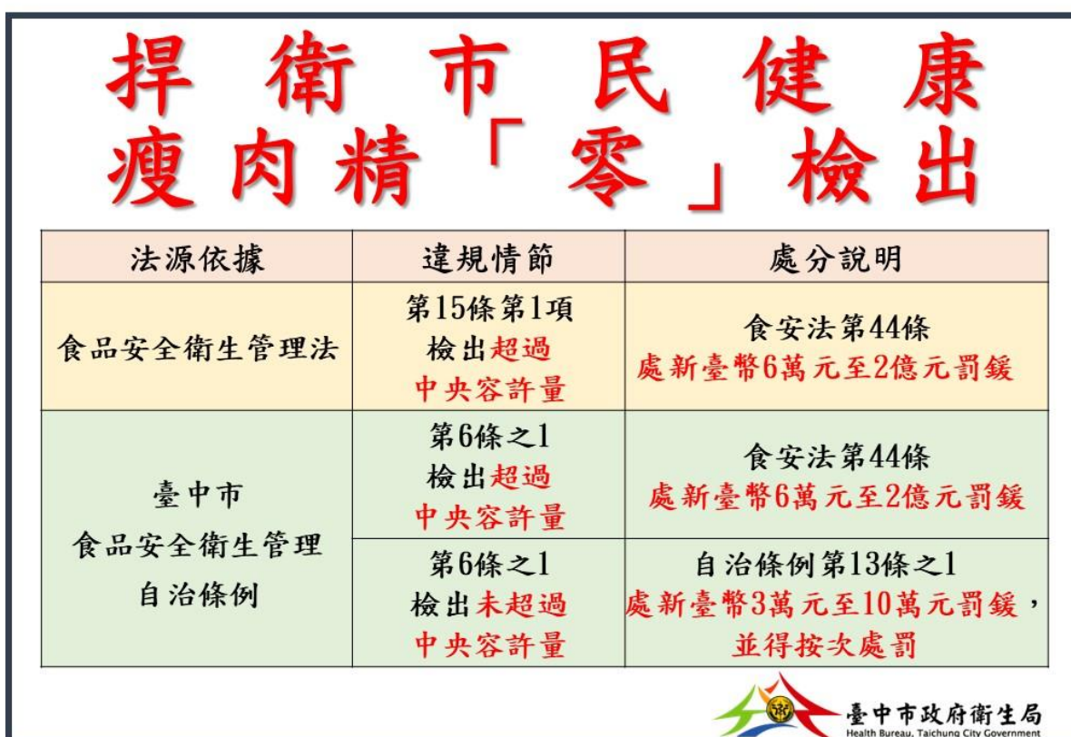
表 1 豬肉檢出瘦肉精相關法規

依東海大學地方自治研究中心 109 年 9 月 9 日發布民調，針對萊豬牛進口政策相關議題，以 20 歲以上臺中市民為受訪對象，結果顯示近 7 成民眾支持臺中市政府維持瘦肉精零檢出政策。對此，本府已持續透過各種管道與中央溝通，希冀中央聆聽並採納民眾的心聲，尊重並支持本市對食安採取最嚴格標準，維護市民權益。