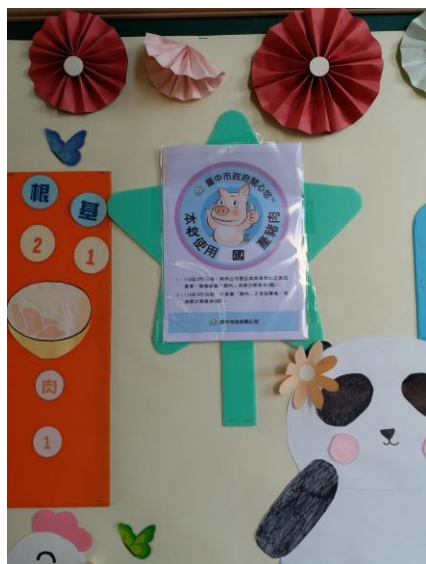
圖 7、學校張貼標示情形