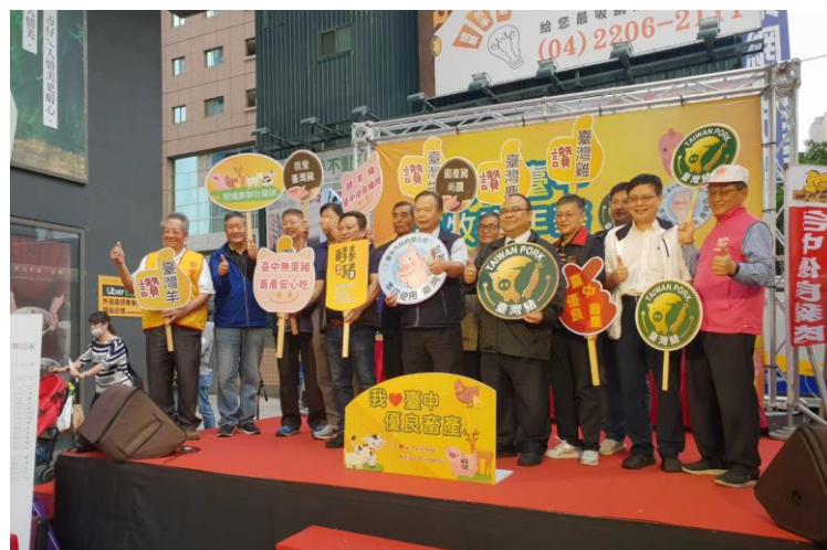
圖 18、109 年 11 月 14 日農業局舉辦畜牧嘉年華宣導相關標章標示