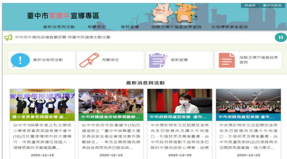
圖 14、臺中市萊豬牛宣導專區(示意模擬圖)

民眾或業者除可瞭解本府各單位最新的法規規定及政策作為外，也可以下載相關的標示圖檔自行列印張貼，另外更提供市民以文字或地圖點位方式查詢本府各單位最新的標示稽查或抽驗的結果，其中可查詢到包含產地國別、萊克多巴胺檢驗結果等重要資訊，可做為消費選擇參考，專區預計本(109)年底上線，透過查驗資訊的透明公開，擴大市民參與監督，也提昇業者自主管理的把關，共同維護食安與健康。