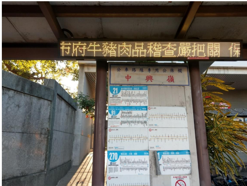
圖 17、交通局運用公車智慧站牌宣導照片