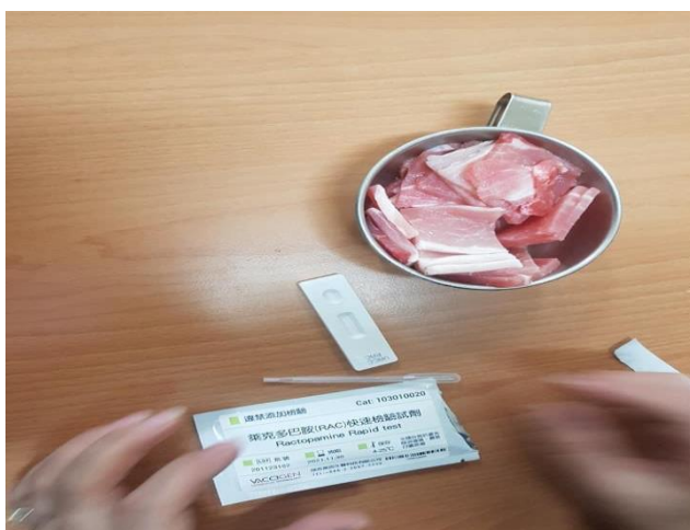
圖 10、設有午餐廚房之學校自主快速檢驗情形