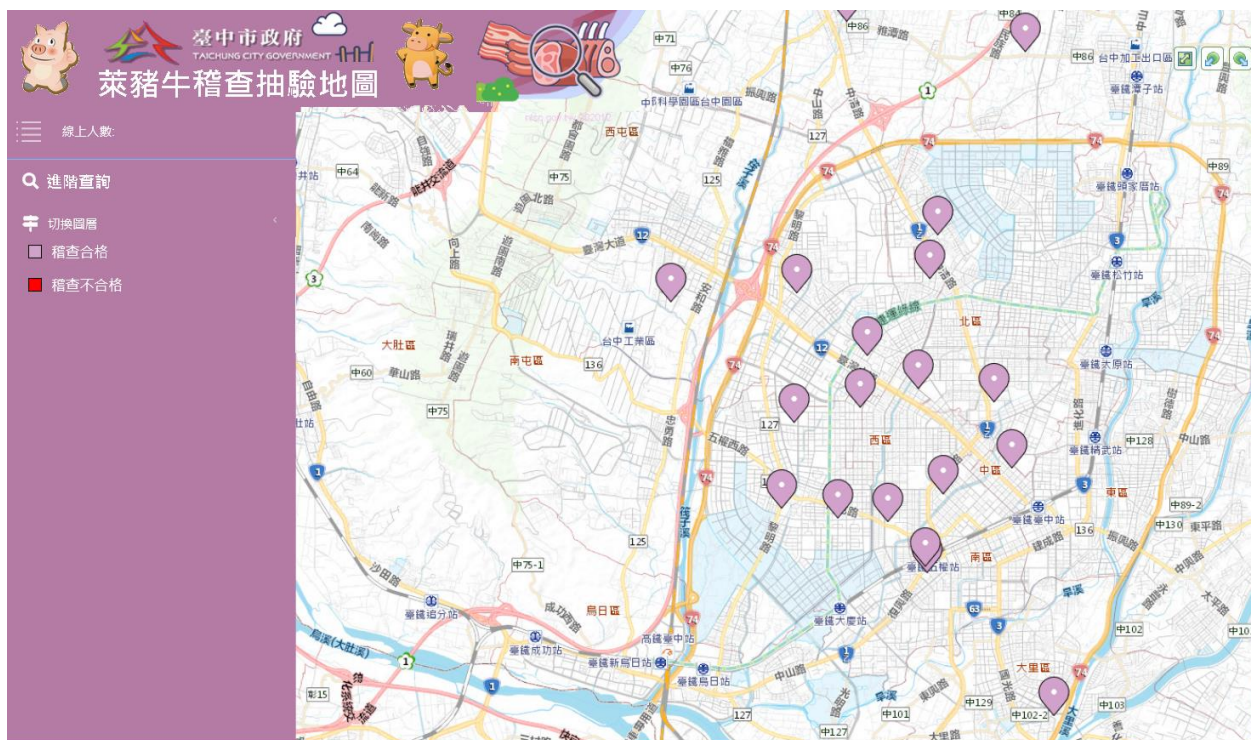
圖 15、菜豬牛稽查抽驗地圖(示意模擬圖)