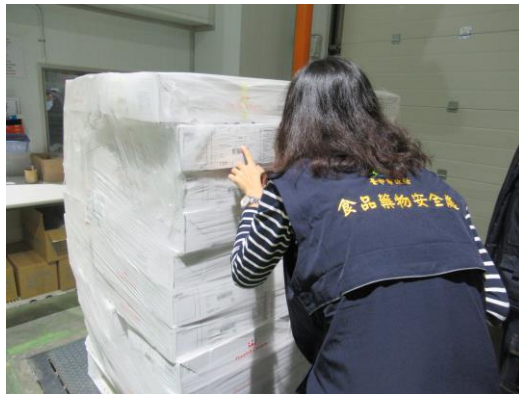
圖 3、肉品輸入業產品標示稽查情形

本市豬肉及牛肉輸入業者計 40 家，肉品製造業者計 190 家，依現行食安法第 9 條規定，本府(衛生局)於 109 年間函知肉品輸入及製造業者，應依規線上登錄及申報產品流向，落實產品追蹤及溯源之紀錄，並完成稽查輔導 230 家次；110 年針對輸入業者及製造業全面啟動無預警稽查，加強查核進貨憑證、進口報單、屠宰證明或購買單據等肉品來源資訊，比對肉品瘦肉精檢驗報告及標示稽查，如查獲不符規定，於食品安全衛生管理法額度內(未依規定標示可裁罰 3 萬到 300 萬；標示不實可裁罰 4 萬到 400 萬)，依行政罰法，視業者違規情節提高罰則，以為警惕。截至 3 月底已完成查核 305 家次，並執行標示查核 530 件、肉品抽驗 167 件，結果皆符合規定(如圖 3)。