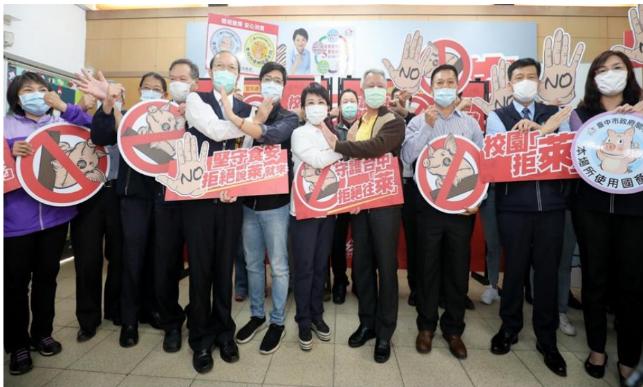
圖9、「堅守食安 校園拒菜」護食安宣導

110年已完成361家次校園午餐供應廠商契約、業者菜單上之肉品來源產地及登錄肉品來源於校園食材登錄平台之查核，並將持續不定時稽查抽驗，以維護校園食安，保障學童健康、讓家長安心。