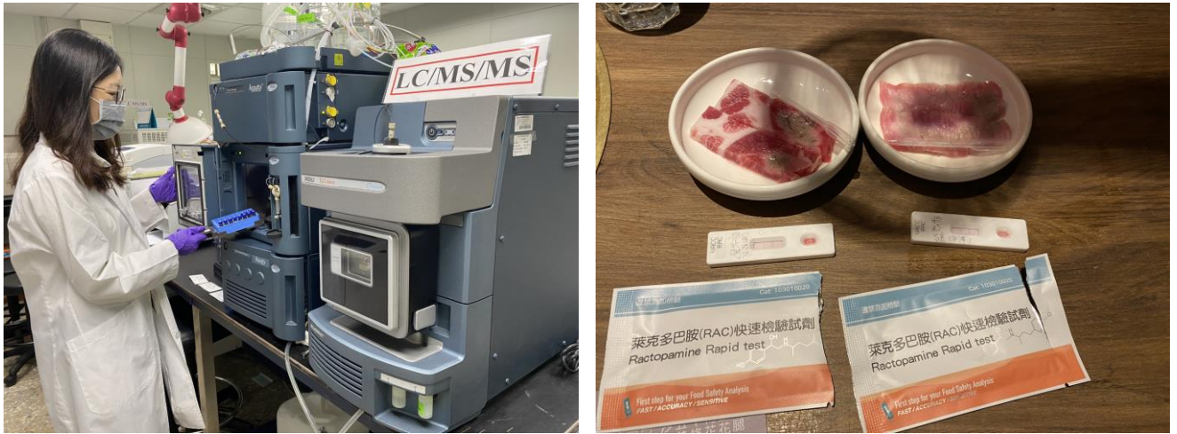
圖 7、本市食安實驗室運用先進儀器檢測瘦肉精並引進快篩試劑把關

現場利用快篩試劑檢測是否含有萊克多巴胺，現場結果若呈陽性，則立即將該批產品暫時封存，再進一步抽樣回實驗室利用化學分析儀器檢驗，待正式檢驗報告確定違規後，即將該批產品銷毀，避免流入市面；已採購 7,000 片快篩試劑，配合稽查時使用。