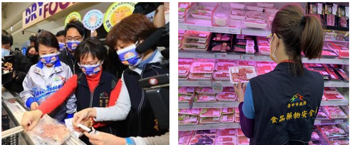
圖 8、連鎖量販店查驗及快篩情形

本府於本(110)年 1 至 2 月間，配合春節專案擴大至大型量販店、超市、超商、大型百貨商場及地區型商店等稽查(如圖 8)，嚴格查核肉品來源並稽查標示共 366 件，均符合規定，另隨機進行肉品快篩試驗 109 件，均為陰性，並抽驗牛、豬肉品共 55 件檢驗瘦肉精，結果均符合規定。