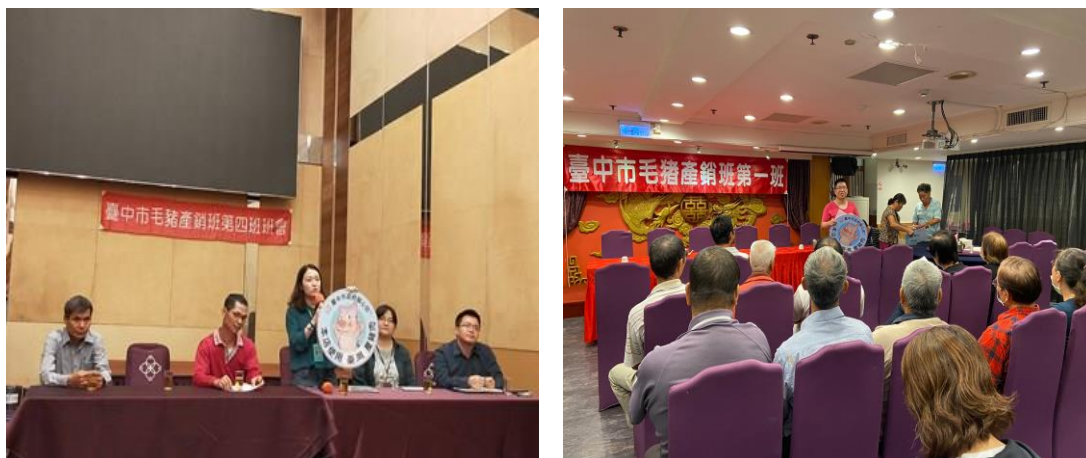
圖 2、教育講習宣導情形

109 年共計完成畜牧場豬毛髮、豬血清及使用飼料抽驗 1,727 件。110 年至 3 月底已完成 407 件，結果皆符合規定；另辦理業者正確用藥教育宣導 7 場次，加強宣導用藥安全及法規說明(如圖 2)。