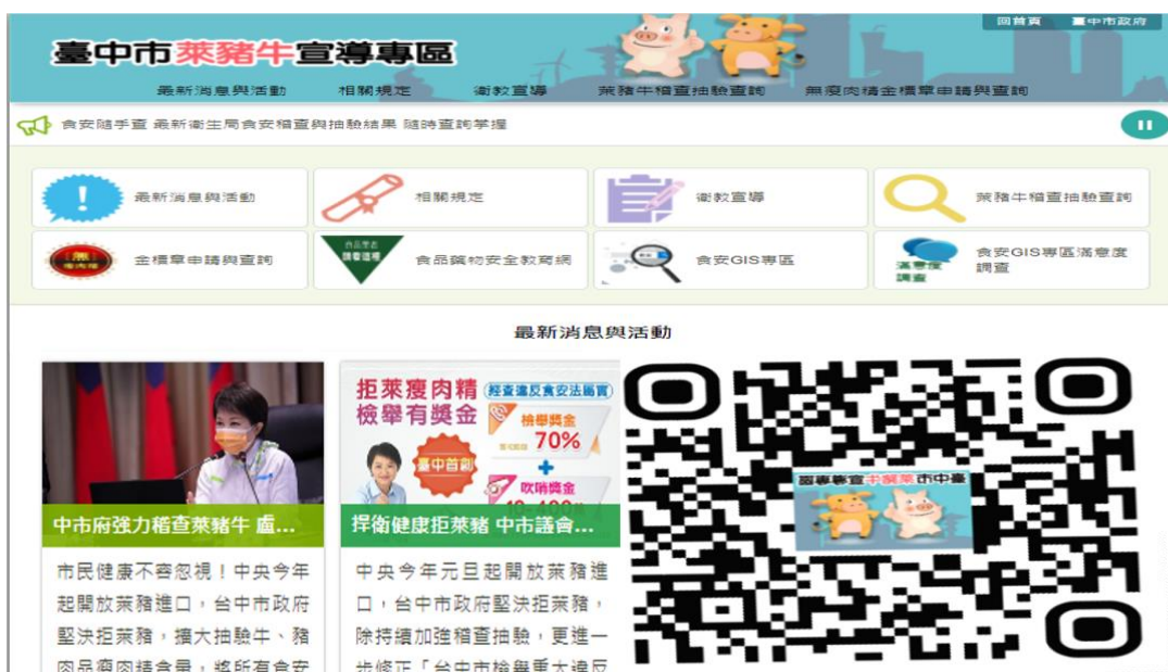
圖 12、「臺中市萊豬牛宣導專區」網頁

自 110 年起加強肉品抽驗力道，已檢出 16 件牛肉產品含有微量萊克多巴胺(明細如表 2)，雖低於法規限值，但仍公開於「萊豬牛宣導專區」中，讓民眾能有自由選擇、消費參考之來源，鼓勵民眾一起來關心食安、監督不法業者。