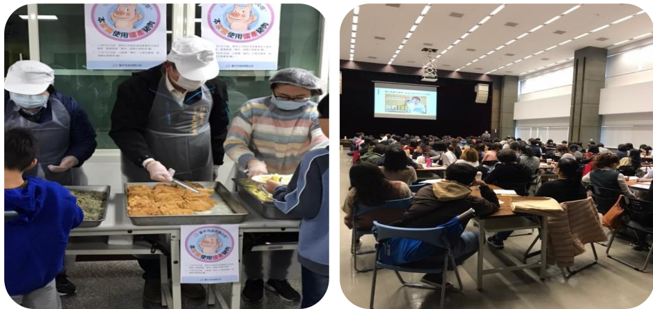
圖 10、兒少安置機構供餐訪視(左)及食安宣導說明會(右)

為加強肉品產地標示法規及政策宣導，本府(社會局)特邀集 166 家托嬰中心、64 家老人福利機構、17 家身障福利機構、7 家兒少安置機構及 1 家婦女安置機構，辦理瘦肉精食安監控說明會，輔導各機構使用國產豬肉，並辦理相關機構供餐訪視，了解落實情形，共同為民眾健康及食安努力(如圖 10)。