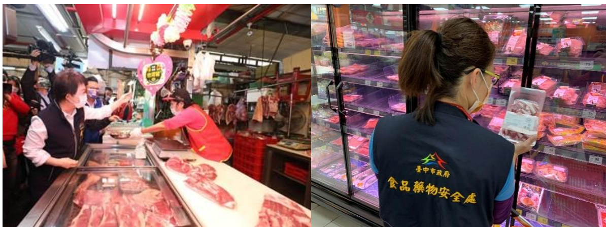
圖 5、肉品販售店家肉品快篩及標示稽查情形

如經查獲標示不符規定者，依違反食品安全衛生管理法第 22 條(完整包裝食品)或第 25 條(散裝食品、直接供應飲食場所)規定，處 3 萬元以上 300 萬元以下罰鍰，如經查獲標示不實者，依違反食品安全衛生管理法第 28 條規定，處 4 萬元以上 400 萬元以下罰鍰。