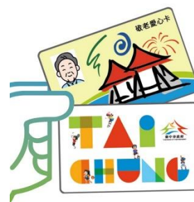
敬老愛心卡、台中市兒童卡 搭捷運享5折