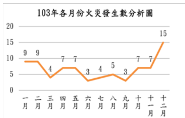
圖 2 103 年各月份火災發生數分析圖