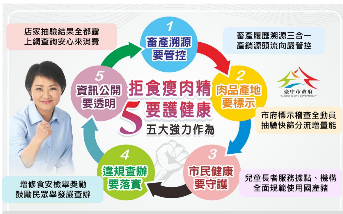
圖 1、本府 5 大強力作為推動示意圖

本府於去(109)年 9 月起，為守護民眾健康及食安，提前於萊豬叩關前完成跨局處整合資源，強化瘦肉精管控與監測，推動「畜產溯源要管控」、「肉品產地要標示」、「市民健康要守護」、「違規查辦要落實」、「資訊公開要透明」5 大強化作為，強化肉品從源頭到餐桌管理，擴大 10 倍查驗量能；同年底亦增修食安檢舉獎勵規定，率先全國將萊豬檢舉案件擴大適用發放檢舉獎金，藉此鼓勵民眾監督舉報不法，並建置「臺中市萊豬牛宣導專區」將市府全面加嚴密集把關成果主動公開，杜絕瘦肉精影響民眾健康，完善本市食品及餐飲消費環境(如圖 1)。