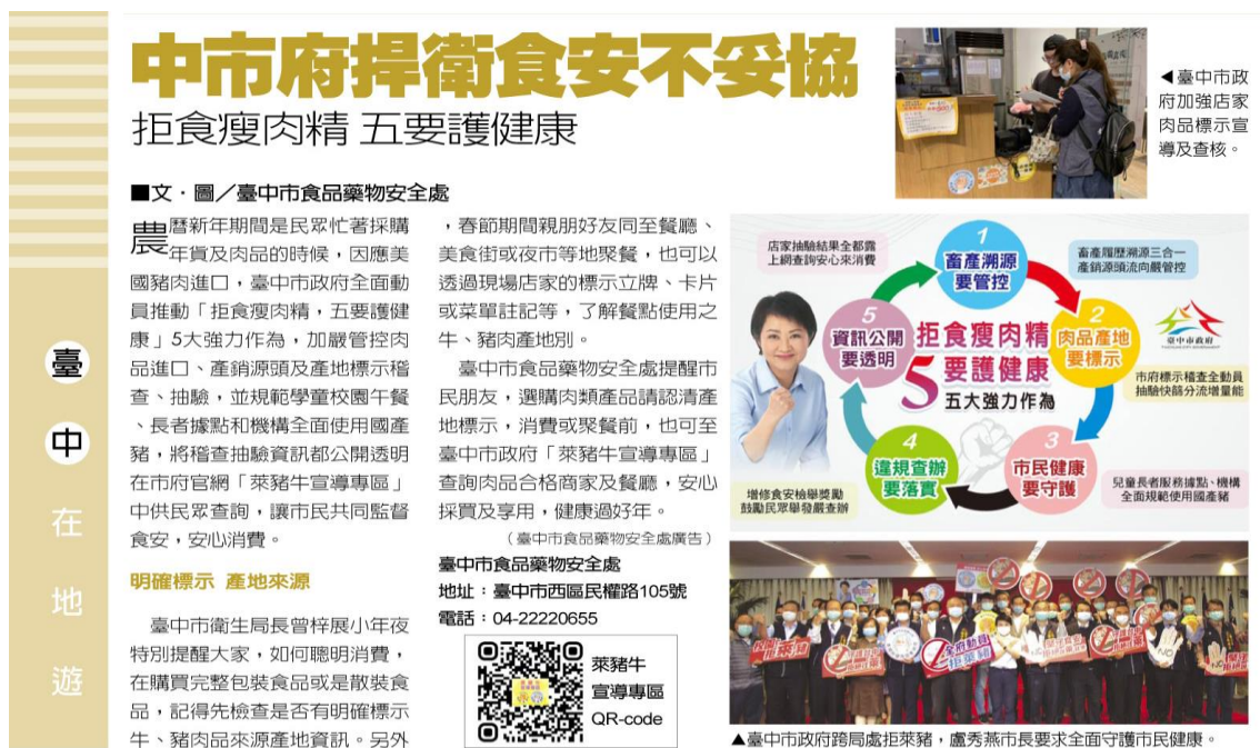
圖 14、平面媒體登載本府拒食瘦肉精 5 大強化作為

依據電話訪問滿意度調查結果，市民對本市因應萊豬牛議題推出的各項作為中，有超過六成的受訪者滿意「主動公布肉品產地國別及瘦肉精檢驗數值」的作為，顯示透明公開食安資訊，可提供民眾安心消費的選擇依據，有效穩定民心。