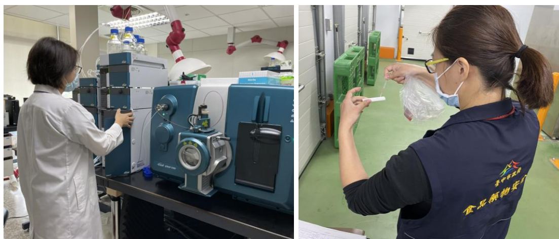
圖 8、本市食安實驗室運用先進儀器檢測瘦肉精

另，率先全國導入萊克多巴胺快篩試劑，因應大量高風險肉品檢驗，若查有含萊克多巴胺之豬肉流入本市時，本府可先於業者端，現場利用快篩試劑檢測是否含有萊克多巴胺，現場結果若呈陽性，則立即將該批產品暫時封存，再進一步抽樣回實驗室利用化學分析儀器檢驗，待正式檢驗報告確定違規後，即將該批產品銷毀，避免流入市面。