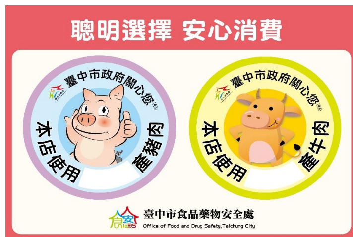
圖 4、「牛哥豬弟」肉品安心標示貼紙圖

為全面輔導本市食品業者落實產地標示，除透過食品及餐飲業相關公會、公所、里長等管道發放宣導外，本府啟動跨局處聯合分工，由各機關盤點所屬場域相關食品業者，動員協助宣導發放，提供市民清楚辨識，並作為消費選擇的參考。