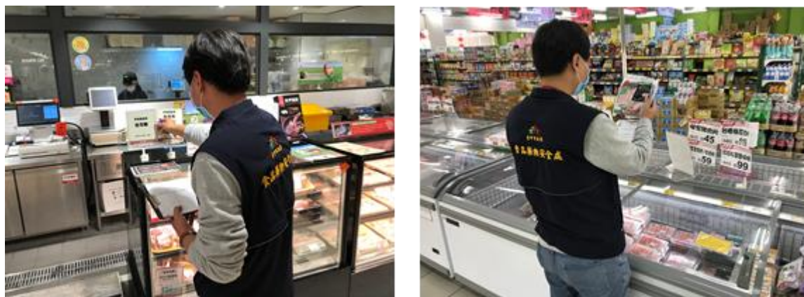
圖 5、輔導業者落實肉品產地標示

為提升食品業者落實標示法規規定，本府透過 110 年度「畜肉安心計畫」補助專案，輔導本市夜市攤商、公私有市場、美食街、購物中心、賣場及直接供應飲食場所等場域業者，完成肉品標示張貼，並確認標示之正確性，本(110)年 1-9 月底，已輔導 1 萬 3,989 家業者(如圖 5)。