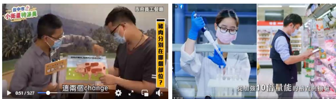
圖 15、萊豬牛相關宣導影片