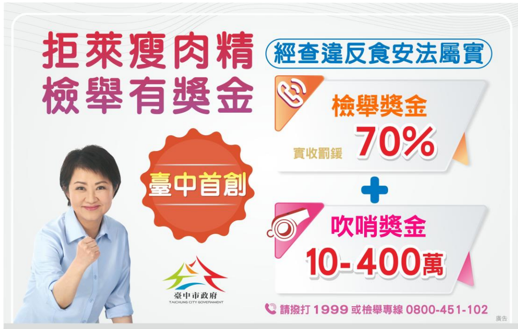
圖 11、本府「拒萊瘦肉精 檢舉有獎金」宣導圖卡

市民可透過臺中市民一碼通 1999 專線或 0800-451-102 免付費電話提供具體情資，只要是未經有關機關發現的違法案件，可採書面或言詞口頭方式向衛生局提供具體事證，並留具真實姓名及資料，即完成受理，對於足以辨識個人之相關資訊，市府將依法保密(如圖 11)。