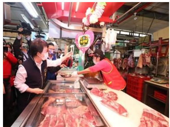
圖 6、肉品販售店家肉品快篩及標示稽查情形