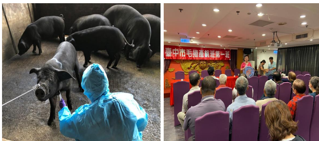
圖 2、落實畜產用藥管理及教育講習宣導情形

驗畜牧場豬毛髮、豬血清及使用的飼料，並針對相關業者持續辦理正確用藥教育宣導，建立合法及正確用藥觀念。本(110)年 1-9 月底已完成 1,093 件，結果皆符合規定；另辦理業者正確用藥教育宣導 7 場次，加強宣導用藥安全及法規說明(如圖 2)。