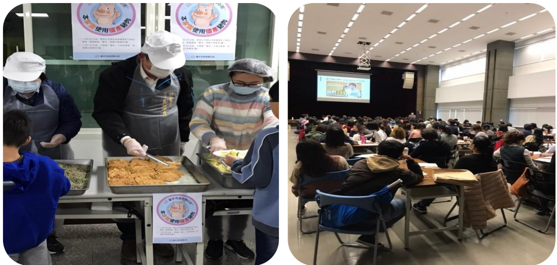
圖 10、兒少安置機構供餐訪視(左)及食安宣導說明會(右)

為加強肉品產地標示法規及政策宣導，本府(社會局)特邀集 166 家托嬰中心、64 家老人福利機構、17 家身障福利機構、7 家兒少安置機構及 1 家婦女安置機構，辦理瘦肉精食安監控說明會，輔導各機構使用國產豬肉，並辦理相關機構供餐訪視，了解落實情形，共同為民眾健康及食安努力(如圖 10)。本(110)年 1-9 月底完成肉品標示查核計 427 家，查核件數 470 件，結果均符合規定。