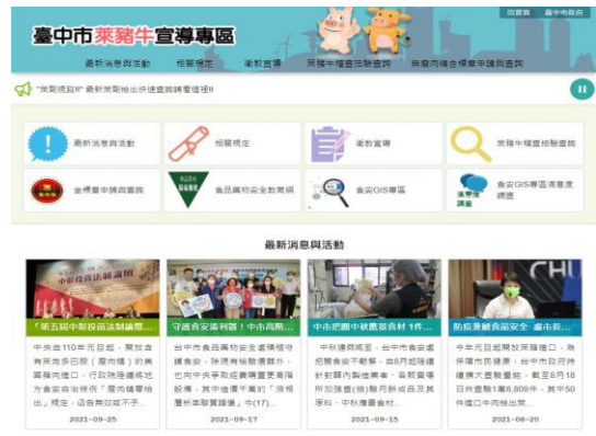
圖 12、「臺中市萊豬牛宣導專區」網頁