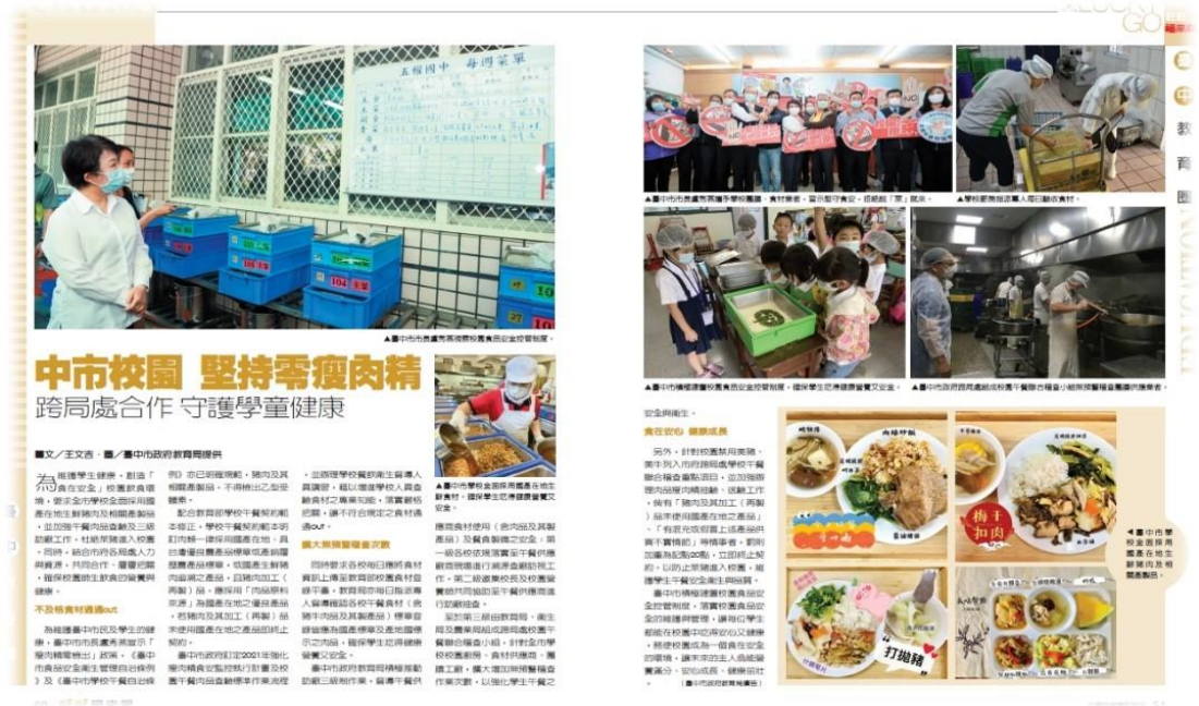
圖 9、透過媒體報導宣導本市校園「瘦肉精零檢出」政策

本(110)年已完成 946 家次校園午餐供應廠商契約、業者菜單上之肉品來源產地及登錄肉品來源於校園食材登錄平台之查核，並將持續不定時稽查抽驗，保障學童健康、讓家長安心；本(110)年 1-9 月底，完成肉品標示查核 3,613 件及抽驗 73 件，結果均符合規定。