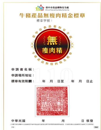
圖 7、全國首創金標章-牛豬產品無瘦肉精金標章