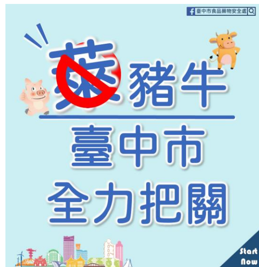
圖 13、本市萊豬牛查驗結果及政策圖卡宣導