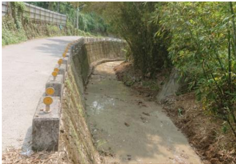
東新里勢林街46號旁排水溝清淤