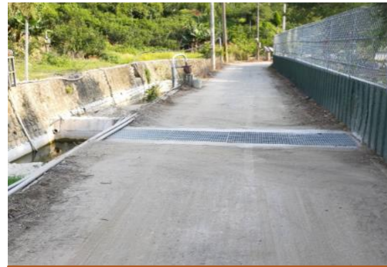
明正里直坑及橫坑道路施設截水溝工程