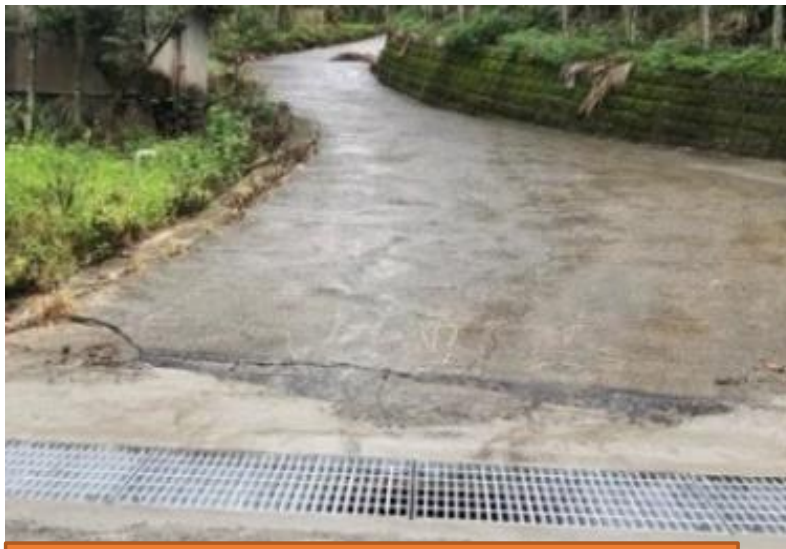
慶福里東關路四段小坑產業道路旁截水溝崩壞修復工程