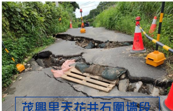
茂興里天花井石圍牆段 869地號道路邊坡改善 復建工程(前後對照)