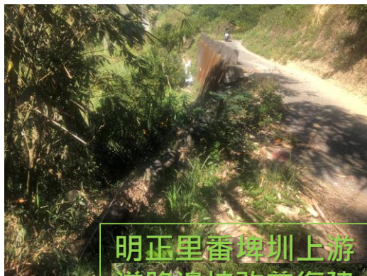
明正里番埤圳上游 道路邊坡改善復建 工程(前後對照)