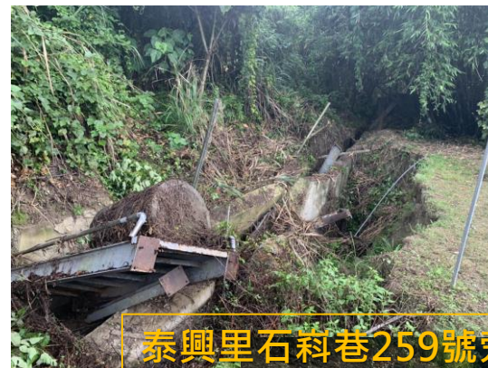
泰興里石料巷259號旁坑溝災 害復建工程(前後對照)