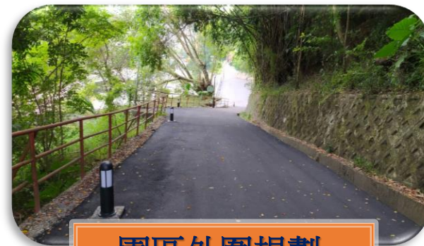
園區外圍規劃- 臺中山城樂活公園