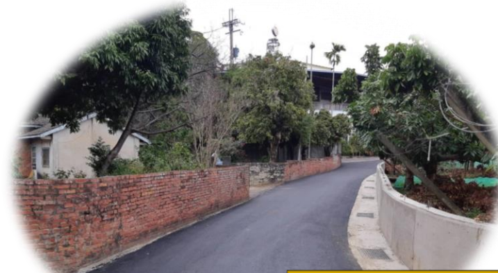
埤頭里內道路拓寬