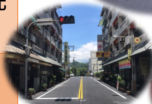
廣興里第三橫街 道路創鋪