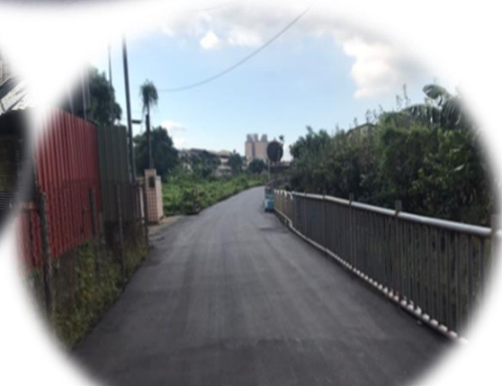
新盛里東關路 1168巷道路創鋪