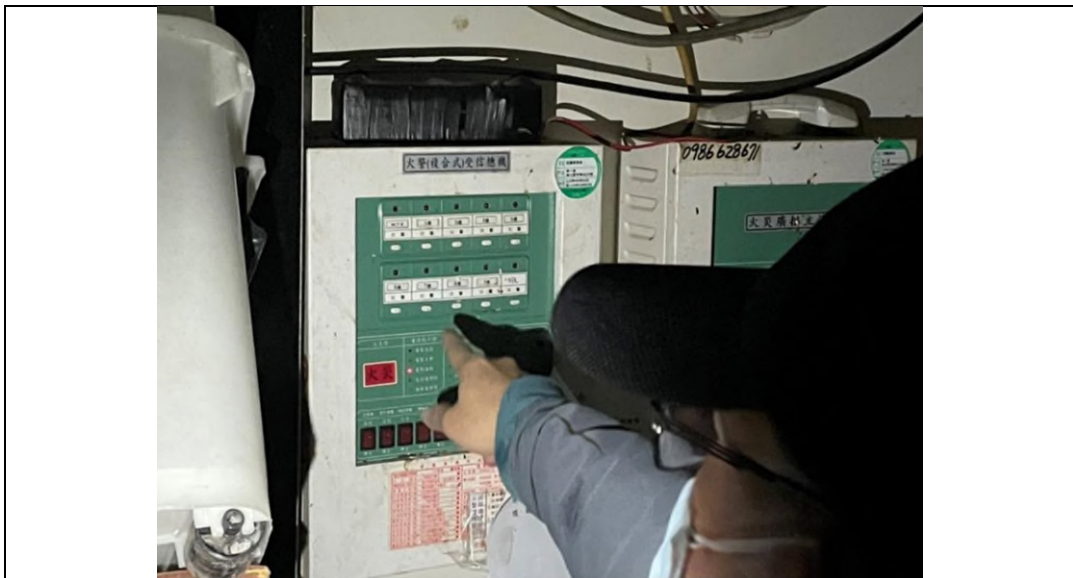
圖5-內政部消防署實地勘查情形