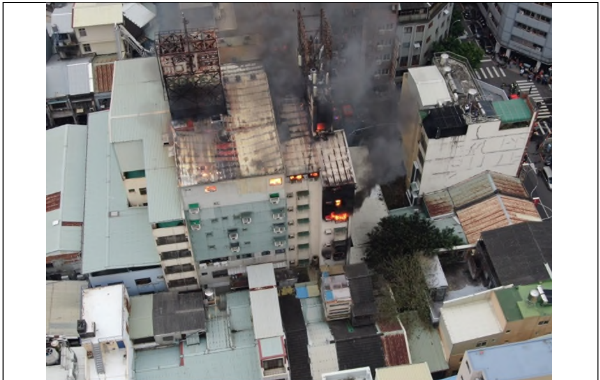
圖6 初期火勢空照圖