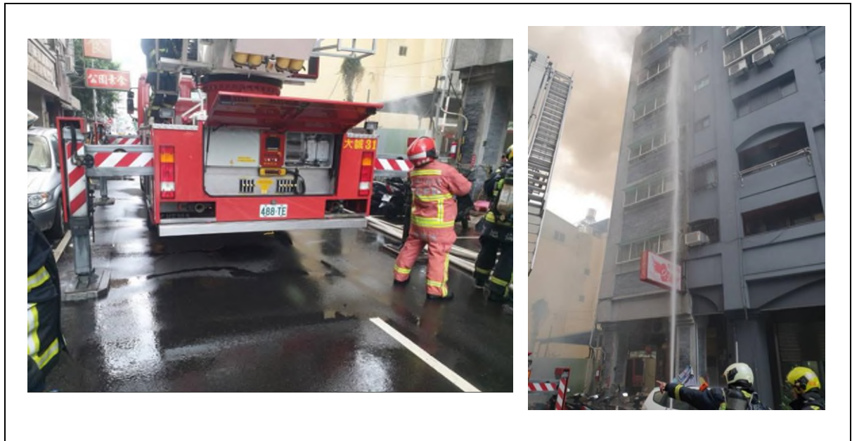
圖2-雲梯車作業情形