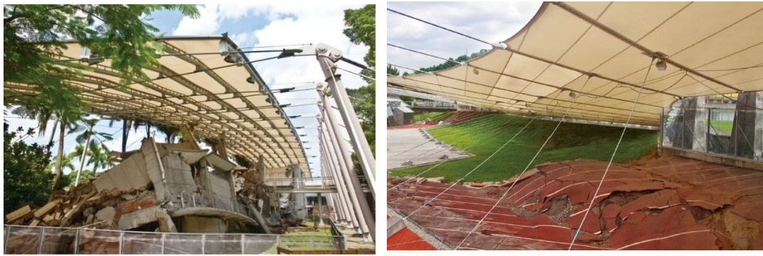
圖2 霧峰區921地震時倒塌房屋(光復國中)