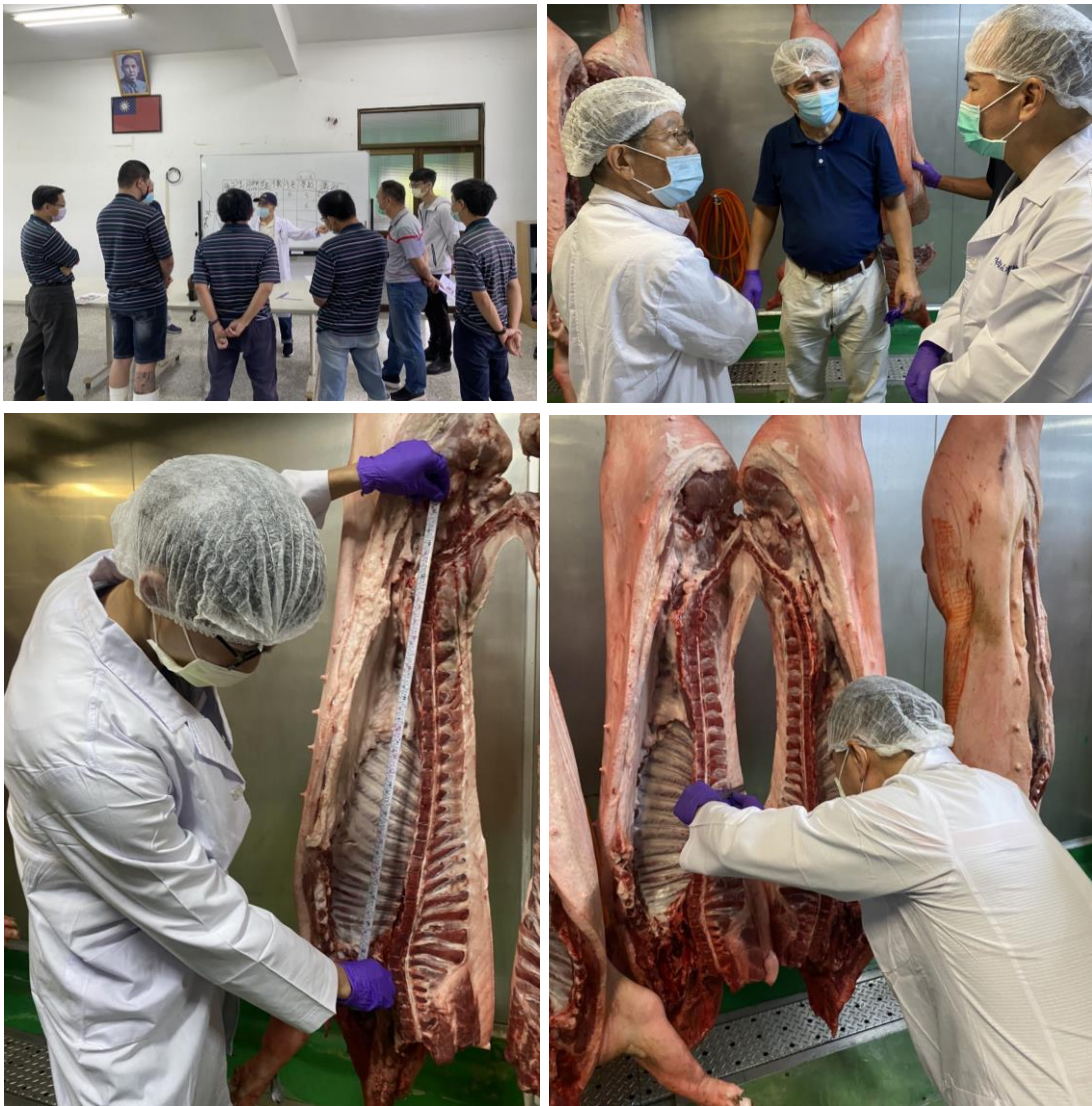
圖 6 肉品公司員工屠體拍賣培訓

未來屠體拍賣制度將可使肉品交易更公平、合理、衛生，提升營運效率，畜產產業得以邁向更現代化發展，同時透過改善屠宰場設備及培植屠體評級相關技術人員，推動一貫化之冷鏈系統和行銷體系，以提升國產豬肉之安全、衛生與品質。