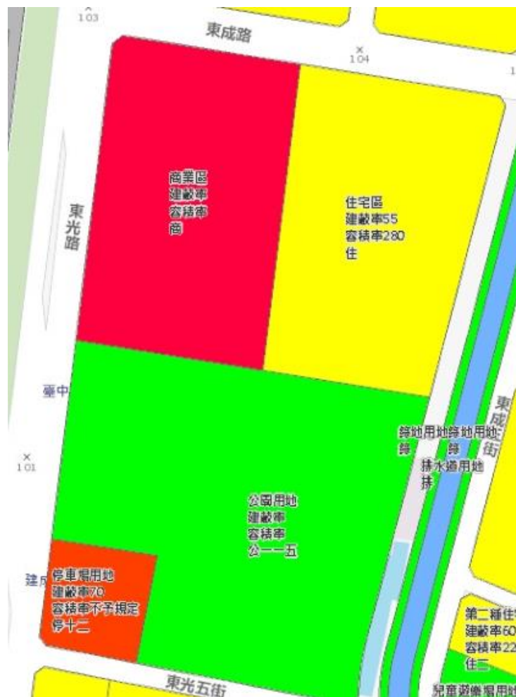
圖 1 肉品市場原址都市計畫示意圖

臺中市肉品市場設置營運至今 40 餘年，運輸豬隻臭味飄散、噪音、污水等相關問題引起地方民怨，本市於 109 年起推動「肉品市場原址轉型活化」，以拆建取代遷建，110 年起解除肉品市場屠宰及拍賣業務，拆除舊有屠宰設備，現原址已完成都市計畫變更為商業區、公園用地、住宅區(如圖 1)，其中商業區將轉型為複合式商場，公園用地將融合歷史元素與創意概念，新闢為主題性共融公園，住宅區將規劃社會住宅，透過多元轉型，活化開發運用，將原本肉品市場「鄰避設施」轉變為「鄰聚設施」，同時整合周邊資源，重塑都市空間，改造區域整體環境，啟動北區新動能，打造未來地區發展之新契機。