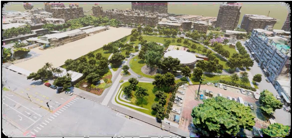
圖 4 豬事圓滿公園意象示意圖

配合中肉公司轉型規劃，第一期公園業於 111 年 4 月 22 日由盧市長主持開工動土典禮進行開闢，第二期工程待中肉公司點交相關建物後，辦理相關拆除及開闢事宜。