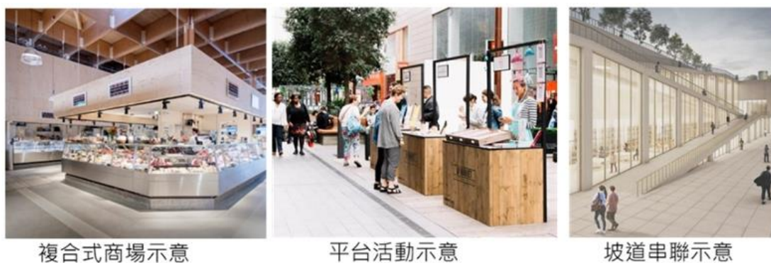
圖 3 商業區意象示意圖