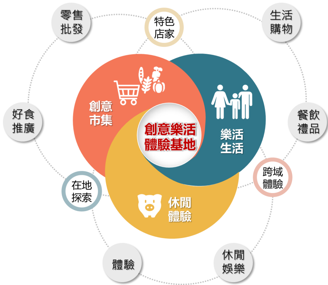
圖 2 商業區發展定位示意圖