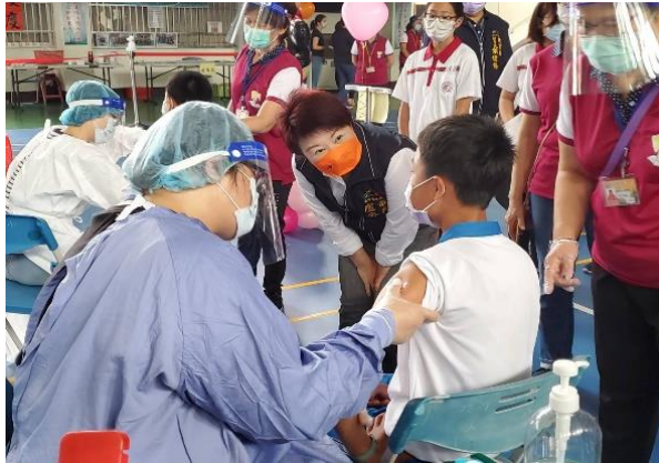
圖 1：市長視察莫德納疫苗校園接種情形

施打速度，規劃於 6 月 25 日、6 月 26 日開始施打兒童 BNT 疫苗第 2 劑。