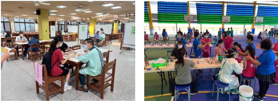
圖 3：國高中學生接種追加劑

本市於 5 月 30 日起推動高中、國中 BNT 疫苗集中接種作業，鑒於疫情嚴峻，為讓學生加速提升保護力，教育局已各校跟合約醫療院所媒合調整施打期程，全市國高中學校至 6 月 20 日可施打完畢，近期施打疫苗期間適逢全市暫停實體課程期間，亦已要求各校依規劃請學生分流返校，如期完成施打作業，強化國高中學生保護力。