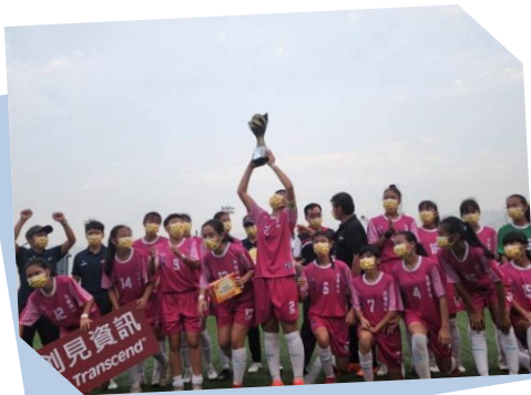
五權國中女足奪 首冠