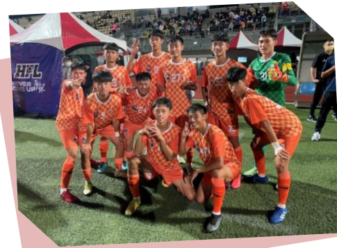
惠文高中男足 奪冠