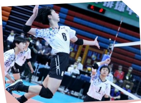
雙十國中女排 連霸