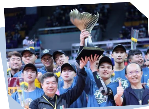
豐原高商男排 奪冠