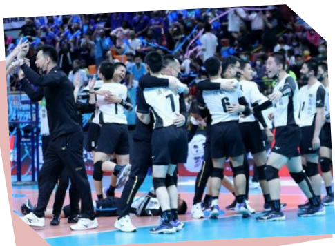
潭秀國中男排奪 首冠