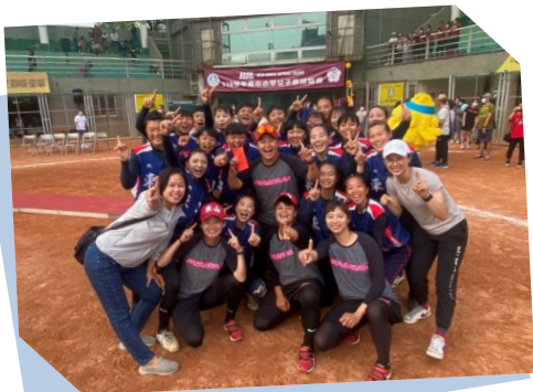
東山高中女壘奪 首冠