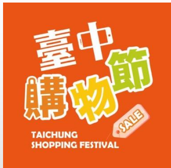
經發局-台中購物節網站 規劃TCOD專區