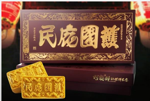
視覺及包裝設計類