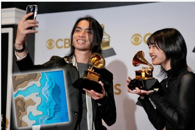
設計指導：李政瀚 2022葛萊美最佳唱片包裝設計獎得主