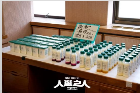
新聞局-媒合影視道具或品牌贊助