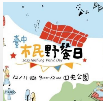
建設局-秋季野餐日設 TCOD專區推廣