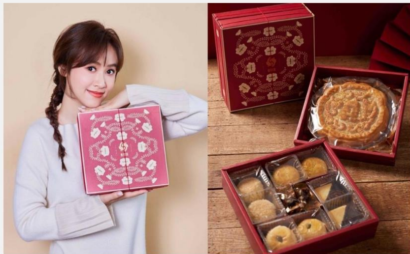
吳姍儒欽點台中名舖「喜豐香1985」為喜餅品牌，並量身訂做專屬的禮盒。

藝人明星指定的喜餅禮盒，每每曝光都會掀起一陣話題，金鐘女主持人吳姍儒Sandy將在29日舉辦婚禮，備受討論的「中式喜餅」也搶先公開品牌！原來是由台中名舖「喜豐香1985」專為Sandy量身訂做的禮盒，充滿巧思的設計更帶入「紅線」的元素，喜餅口味也由準新娘一手挑選，傳統大餅、以及創意的糕餅名稱都別出心裁。