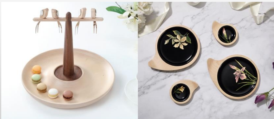
2021 TCOD 創意生活類 WOOD MU 梧得木 | 鳥叉棲憩盤

將原木運用木質的溫度，結合不同的線條，將家具轉化為家居，為文藝雅緻增添文化美感溫度，將可愛與幸福融入古典詩詞、精雕具有形器具，賦予上所有精緻細節從任何的特性，使鳥兒快樂飛動，創造出與家人相愛的歡愉氣氛。