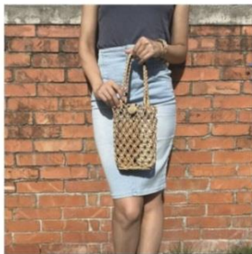
【溪泉】蘭編窗花提袋 | 手工編織手挽袋