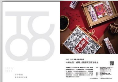
商品型錄推廣+企業採購