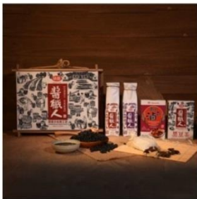
【味醇】尋蹤人黑豆蔴油禮盒 | 油蔴(蔴) | 油包 | 茶包