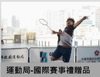
運動局-國際賽事禮贈品