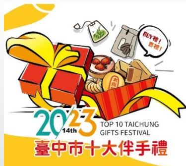
工策會-鼓勵參與十大伴手 禮徵選