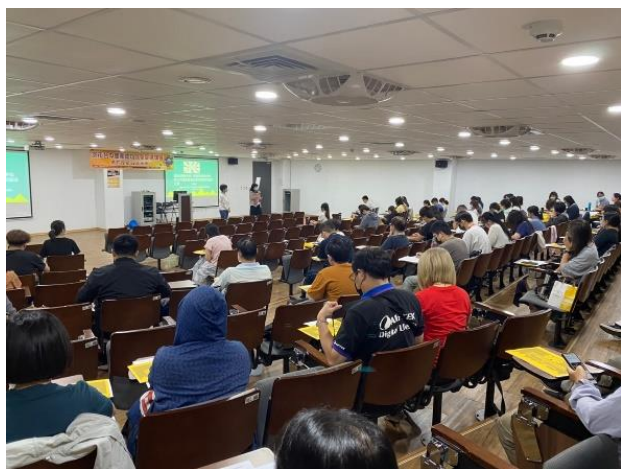
➤ 辦理跨域聯繫暨研習活動