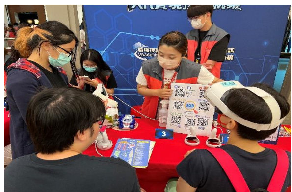
➤ 開發 VR 設備，就業服務員向民眾說明操作方式