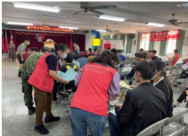
➤ 向役男宣導本市就業服務資源

為兼顧在地化就業服務與產業發展及擴大就業服務量能，與本府經發局、社會局、衛生局、民政局、原民會、教育局、交通局等跨機關建立完善轉銜機制，不定期召開跨部門聯繫會議，研擬與辦理各式就業協助模式，積極協助民眾順利求職。