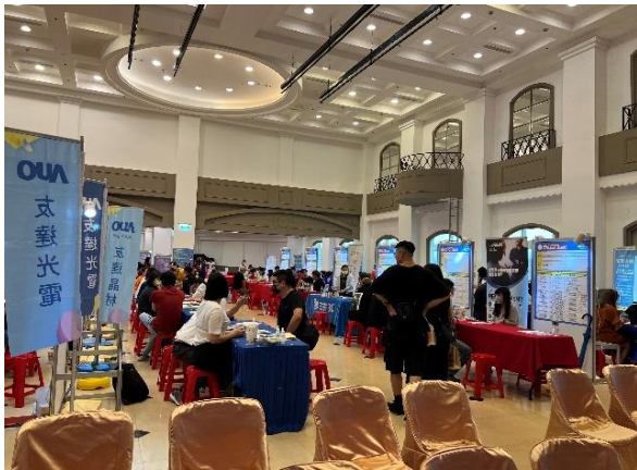
➤ 與中友百貨合作辦理徵才活動