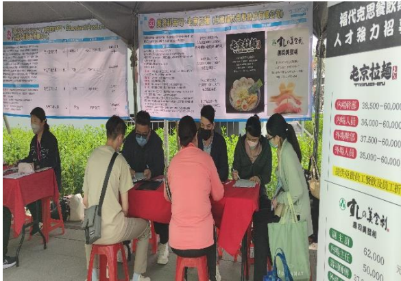
➤ 因應台中 LaLaport 開幕，積極辦理徵才活動