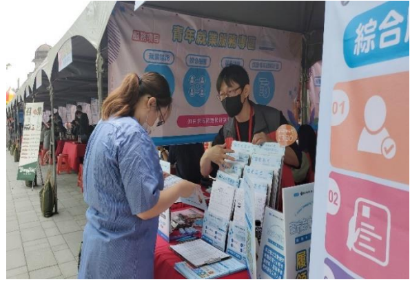
➤ 就業服務員向民眾說明專案內容