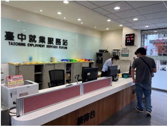
➤ 民眾服務台(個案分流)