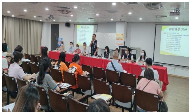
➤ 勞工局長說明本市就業服務資源