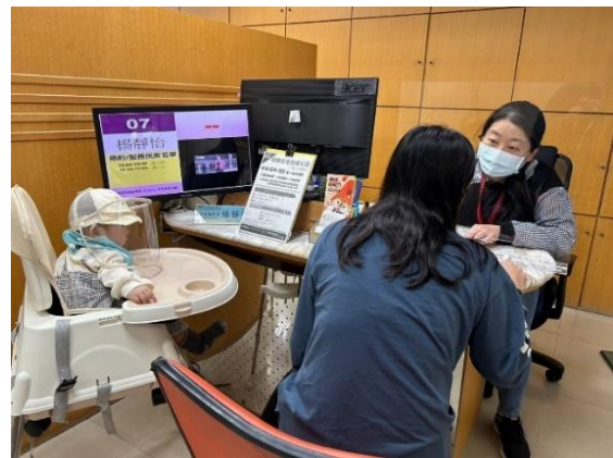
➤ 使用寶貝安全座椅，貼心服務民眾