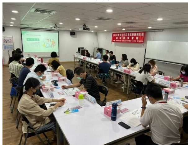
➤ 辦理區域聯繫會報