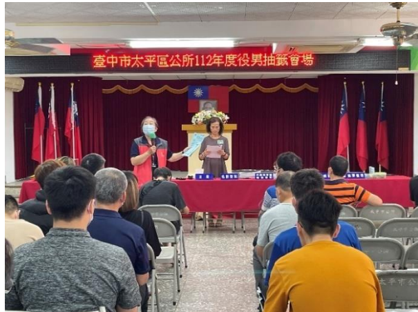
➤ 至役男抽籤會場宣導本市就業服務資源