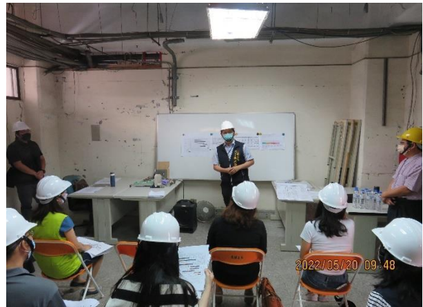
➤ 勞工局長督導臺中就業服務 站工程施工