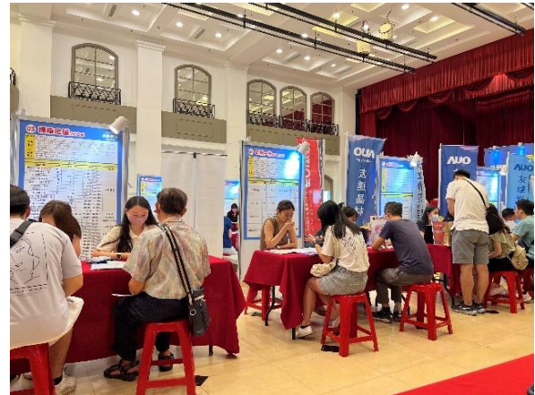
➤ 辦理徵才活動民眾踴躍參加面試