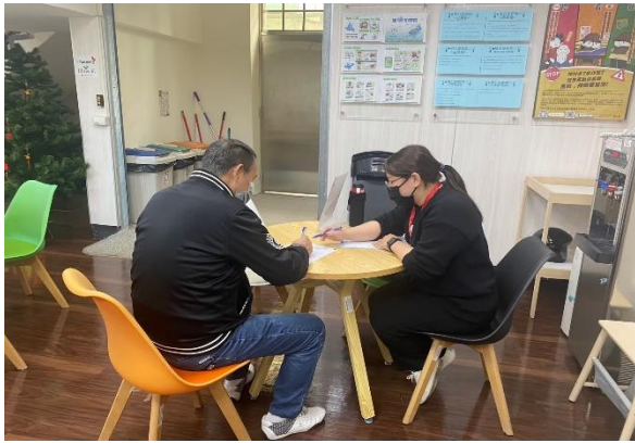
➤ 於家庭福利服務中心合作提供駐點諮詢服務