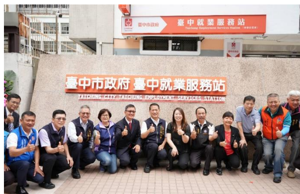
➤ 臺中就業服務站正式揭牌