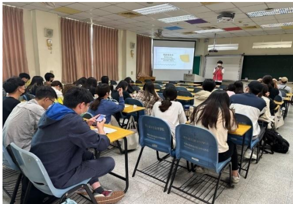
➤ 至大專院校宣導說明青年就業促進施及專案補助方案