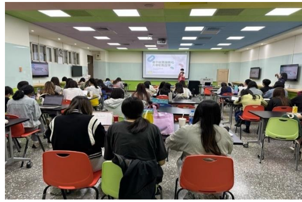
➤ 至大專院校宣導說明青年就業促進施及專案補助方案