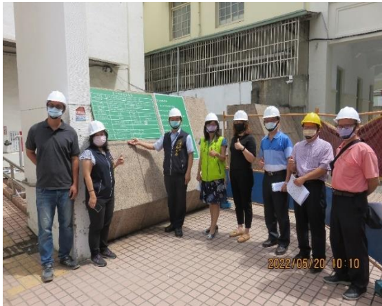
➤ 臺中就業服務站新址整修開工