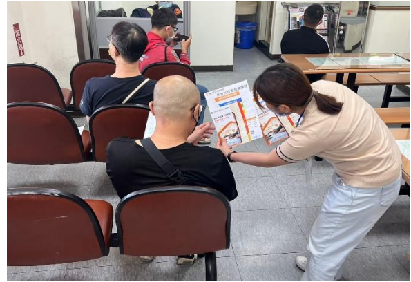
➤ 與地檢署觀護人室合作提供駐點諮詢服務