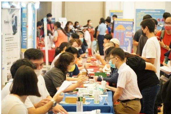
➤ 辦理徵才活動民眾踴躍參加面試