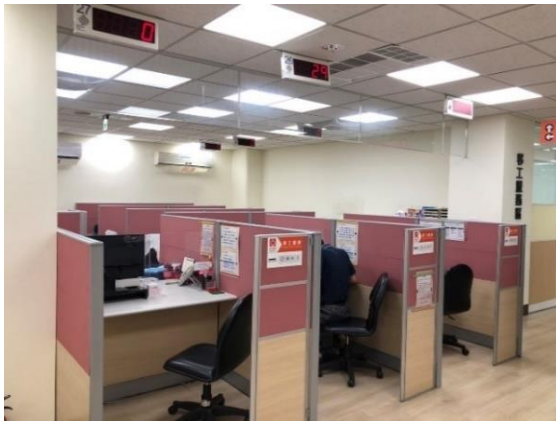
➤ 求職求才服務櫃台